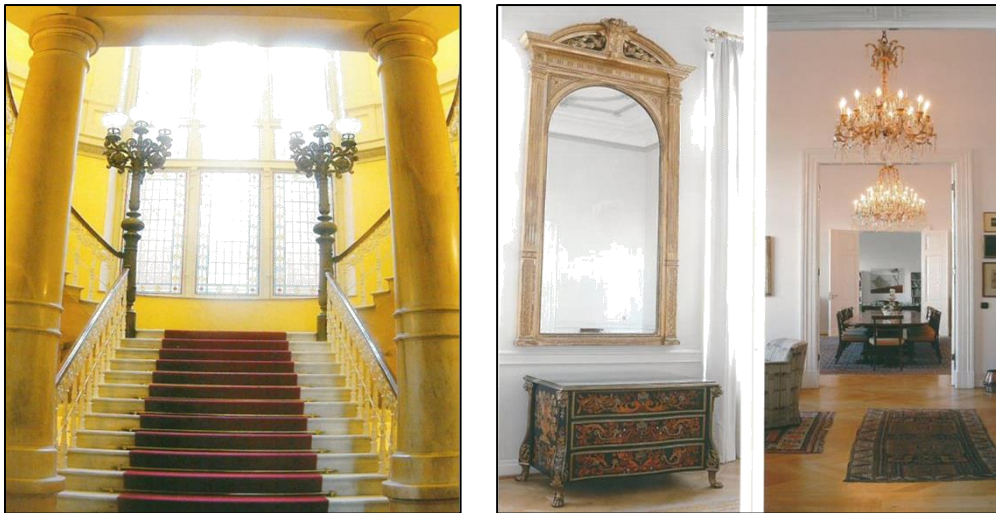
Şekil 9. Alman Sarayının merdiven. (a.g.e) Şekil 10. Alman Sarayı iç mekan. (a.g.e)