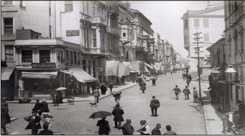
Şekil 4. 19 yy da Pera.

19. yüzyılda İstanbul ve büyük liman şehirlerinde yeni bir hayat başladı. Bu yeni hayat tarzı, sadece kâgir konaklar, Avrupa mobilyası ve alafranga sofrada adabı olarak özetlenemez. Kadınlar eğitim görüyordu. Gazete ve dergi okunuyordu, asıl önemlisi roman okunuyordu. Kaç-göç büyük ölçüde devam etmekle beraber, yüksek sınıftan kadını toplum hayatına giriyordu, gezinti yerlerinde kadın-erkek flörtü başlamıştı. (Ortaylı, 2007)