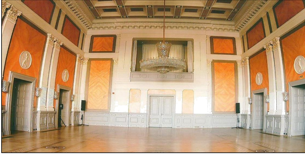
Şekil 8. Alman Sarayının kabul salonu. (a.g.e)

Binanın iç alanı 506.436 m 2 , bütün arazi ise inşaat zamanında toplam 8.234.25 metrekare idi. Yer tanzimi ise şu şekilde planlanmıştı: Zemin katta, büyükelçilik çalışma odaları, kapıcının odası, kavasların odaları ve bunun yanında bekar ataşelerin ve ikinci ve üçüncü dragomanların (sefaret tercümanları) yatacak yeri düşünülmüştü. Birinci katta ve ara katta ise büyükelçinin çalışma odası, ikametgahı ve kabul salonları bulunmaktadır. (a.g.e) Sarayın giriş holünden, gösterişli bir merdiven ile önce Kayzer'in kabul salonu ve diğer kabul salonlarının bulunduğu kata ve oradan büyükelçinin evine ve yardımcısı ile birinci dragomanın evlerine ulaşılmaktadır. Yatak ve oturma odalarında, o dönem Almanya'da adet olduğu gibi, çini sobalar yerleştirilmişti. Bunlar daha sonra yerlerini 1905-1907 yıllarında Hanover'deki Kosting firmasının santral buhar kazanlarına bıraktılar. Yalnızca, iki adet zarif çini soba, zemin kattaki 'Berlin Odası' diye adlandırılan konferans salonunda bugüne kadar kalmıştır. (a.g.e)