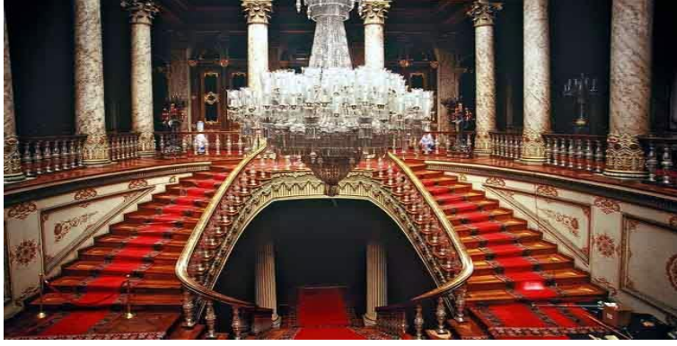
Şekil 2. Dolmabahçe Sarayı.