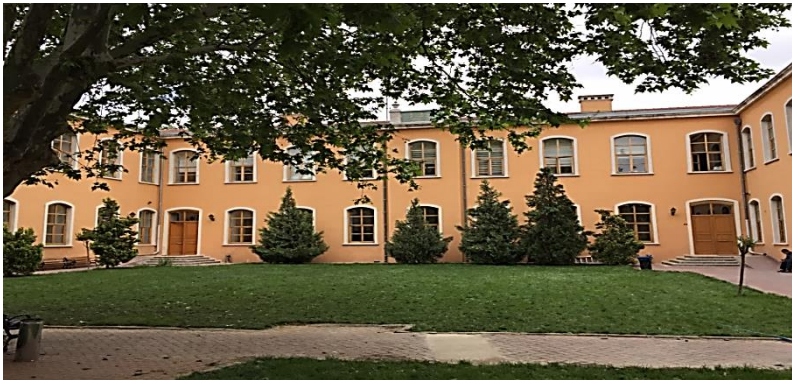
Şekil 1. III. Selim tarafından 1794-1795 yıllarında yaptırılan Humbaracı Kışlası.