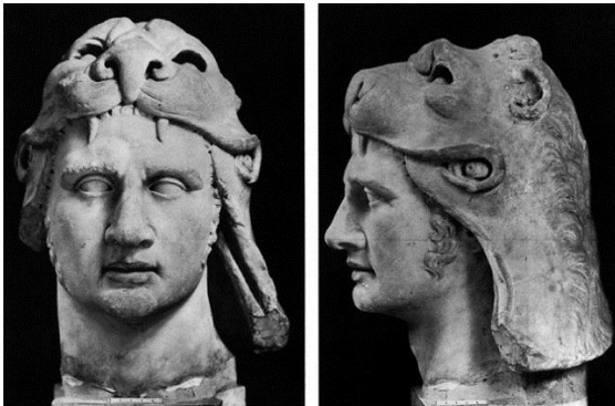
Resim 11-12. Mithradates VI Eupator, Pontus Kralı, Louvre Müzesi, MÖ 120-MÖ 63, Paris.

çeşitliliğin ve bu çeşitliliğin birleştirici unsurlarının bir sonucu olduğu değerlendirilmektedir. Attis için hazırlanan törenlerde bir çam ağacını süslemek ve sonrasında da o ağacı kesmek önemli bir ritüel olarak görülmektedir. İnanca göre Attis her ilkbaharda dirilir ve yapılan törenle Kibele ile evlendirilirdi (Ünal, 2001, s. 34–35). Noel kutlamalarında çam ağacının süslenerek bir kutlama gerçekleştirilmesinin, Attis için hazırlanan törenlerdeki özelliklerle göstermiş olduğu benzerlik, yaşanan etkileşimin bir yansıması olarak görülmektedir (Işık, 1997, s. 458). Anadolu’da hâkim olan Kibele kültü ile karşılaşan magiler, doğuya ait Mithra ile Anadolu’ya has olan Kibele kültürünü birleştirip, bir şekilde İran ve Mezopotamya’da varlık gösteren Mithra’yı tanrıça Kibele üzerinde tekleştirdiler. Mithra, Kibele ile beraber anılmaya başlandı ve bu iki inanç Ahamenişler döneminde tek bir inanç olarak varlık gösterdi. Mithra inancında önemli bir ritüel olan taurobolium (kurbanın altında adayın kanla vaftiz edilmesi) da bu değişimden sonra, Kibele ile birlikte ortaya çıkan bir değerdir (Cumont, 1911, s. 65–66).