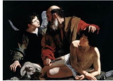
Resim 4. Michelangelo Merisi da Caravaggio İshak'ın Kurbanı, Tuval Üzerine Yağlıboya, 1598-1599.