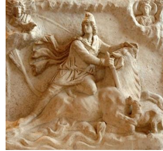
Resim 14. Mithra'nın Boğayı Kurban Etmesi (Heykelin Roma Dönemi Kopyası), II.yy., British Müzesi, Londra.