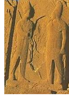
Resim 16. Nemrut Dağı Batı Terası, Apollon Mithras, Adıyaman.