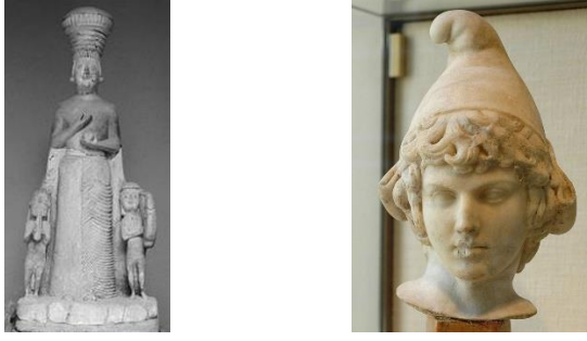
Resim 9. İki Müzisyen eşliğinde Ana Tanrıça Kibele heykeli, Kireçtaşı, Boy 126 Cm, Ankara, Anadolu Medeniyetleri Müzesi, MÖ 6. yüzyıl-Frigya Dönemi, Ankara.