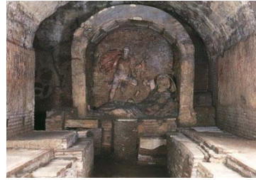
Resim 5. San Clemente Kilisesinin altındaki Mithraeum, Roma, III. yy.