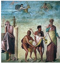
Resim 3. Roma Freskосу, İphigeneai'nın Kurbanı, MS. I. yy. (Aslı MÖ 4. yy. Timanthus).

Dünya üzerindeki hemen hemen tüm toplumlarda farklı ritüellerle işlenmiş olan ortak mitlerden birisi olan “Kurban”, Paleolitik dönemden en yakın zamana kadar tüm insanlık tarihinin inanç sistemlerinin ayrılmaz parçası olan bir mittir. Nitekim Neolitik dönem sunak ve altar gibi mekânların günümüze kalan arkeolojik kalıntıları, bu inanç ve onun yansıması olan ritüellerle ilgili önemli maddi kalıntılardır. Truva savaşının başlayabilmesi için tanrıça Artemis'in Agamemnon'un kızı İphigeneai'nın kurban edilmesini talep etmesi aynı şekilde semavi dinlerdeki Hz. İsmail-İshak'ın kurban edilme girişimi farklı inanç sistemlerinin yansıyan ortak özellikleri olarak görülmektedir. Özellikle aynı konunun resim ya da diğer sanatçılar tarafından ele alınış biçimlerinde çok önemli benzerlikler bulunmaktadır. Antik döneme ait vazolarda ve duvar resimlerinde bu trajik sahnenin ele alınması, konunun önemini ve tarihsel süreç içerisinde ne kadar eskiye gittiğini ortaya koymaktadır.