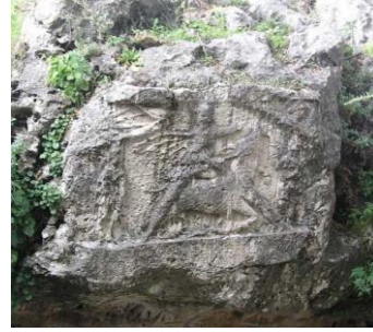
Resim 13. Santa Maria Capua Vetere de Mithraeum (Eski Capua"), II. yy. İtalya.