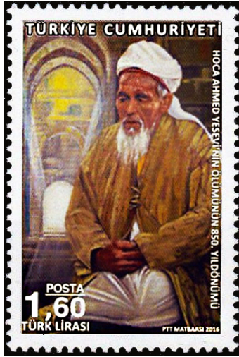
Resim 19. Hoca Ahmed Yesevi 30x45 mm.