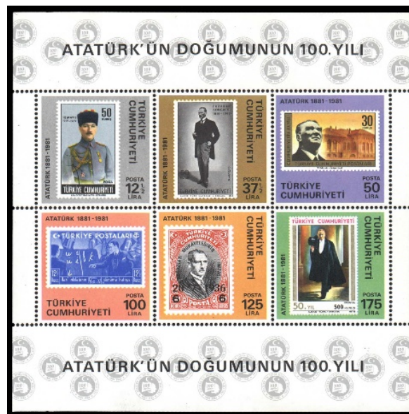
Resim 1. Atatürk’ün Doğumunun 100. Yılı 120x120 mm.

1978’de gerçekleştirilen UNESCO Anma ve Kutlama Programına Türkiye ilk kez Atatürk’ün Doğumunun Yüzüncü Yılı teması ile katılmıştır. 152 üyenin tamamının onayladığı kararda “Atatürk uluslararası anlayış, işbirliği ve barış yolunda çaba göstermiş üstün kişi, UNESCO’nun yetki alanlarında yenilikler gerçekleştirmiş bir inkılapçı, sömürgecilik ve yayılcılığa karşı savaştan ilk önderlerden biri, insan haklarına saygılı, insanları ortak anlayışa ve devletleri dünya barışına teşvik eden, bütün yaşamı boyunca insanlar arasında renk, din, ırk ayırımı gözetmeyen, eşi olmayan devlet adamı ve Türkiye Cumhuriyeti’nin kurucusudur” ifadesine yer verilmiştir (UNESCO, 2016).