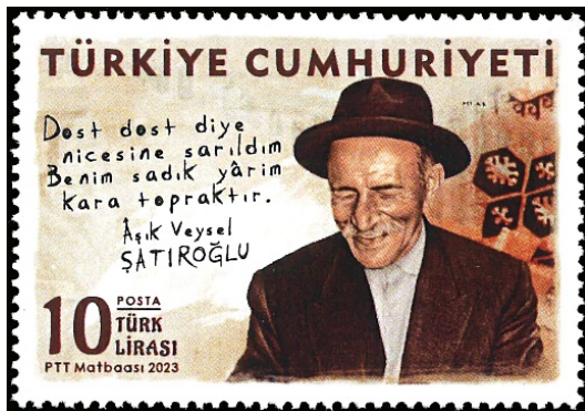
Resim 21. Âşık Veysel 36x52 mm.

Sivas'ın Sarkışla ilçesinin Sivrialan Köyü'nde doğan Âşık Veysel, henüz küçük yaşta iken yakalandığı çiçek hastalığı nedeniyle bir gözünü akabinde yaşadığı kaza sonucunda ise diğer gözünü kaybetmiştir (Oy, 1991:6). Her iki gözünü kaybeden Âşık Veysel babasının kendisine aldığı saz ile vakit geçirmeye çalışmıştır. İlk zamanlarda acemiliği nedeniyle başarılı olamayan Âşık Veysel, babasının ısrarı üzerine çalmaya devam etmiş ve kısa zamanda iyi bir saz ustası olmuştur (Şarkışla Belediyesi, 2023). İnsan sevgisi, tabiat, taşlama, dostluk, tasavvuf, vatan-millet, din ve fikir konularına değinen Âşık Veysel, katıldığı I. Sivas Halk Şairleri Bayramı'ndan sonra kendi şiirlerini okumaya başlamıştır. Âşık Veysel'in günümüzde 179 adet yazılı ve sözlü şiiri tespit edilmiş olup hakkında yazılmış onlarca yayının yanı sıra belgesel, festival, film ve sergi bulunmaktadır (T.C. Sivas Valiliği, t.y.).