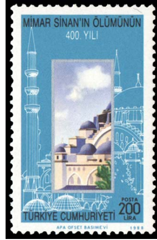
Resim 3. Süleymaniye Cami 26x41 mm.