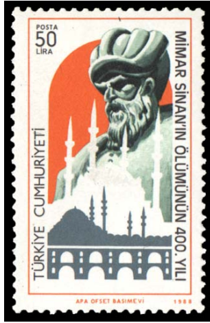
Resim 2. Mimar Sinan 26x41 mm.