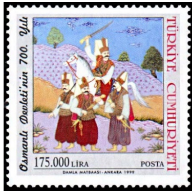
Resim 6. Yeniçeriler.

El yazması kitapları süslemek amacıyla sulu boya ile yapılan resimler için kullanılan minyatür tabiri Türk dünyasında, nakış terimine karşılık gelmekte olup boya ile resim yapma anlamında kullanılmaktadır (Binark, 1978:271). Uygur Türklerinin, başşehir Hoço başta olmak üzere 8. yüzyıldan itibaren Turfan bölgesinde meydana getirdikleri minyatürler, Türklerin en eski minyatürlerinin kaynağı olarak sayılmaktadır (Aslanapa, 1986:851). Özellikle Moğol istilası ile birlikte İslâm dünyasına birçok kâtip ve sanatkar sığınmış bu sayede resim ve heykelin yayılmasında Türk sanatının etkileri görülmeye başlamıştır. Osmanlı dönemi Türk minyatürleri ise ancak Fâtiş Sultan Mehmet zamanından itibaren günümüze intikal edebilmiştir. Fâtiş Sultan Mehmet ile başlayan bu gelişme Kanunî Sultan Süleyman döneminde olgunluğa erişmiştir. Sonraki süreçte Kıncı Mahmut, Nigârî ve Kefeli Hasan Çelebi gibi üstatlar yetişmiş ve Lale Devri'nin önemli sanatçılarından biri olan Levni tarafından bir mektep tesis edilmiştir (Binark, 1978:275-277). Osmanlıda süsleme ve resim sanatı olarak görülen bu geleneğe savaşlar, sosyal hayat ve saray yaşamı gibi konular minyatürlere yansımıştır.