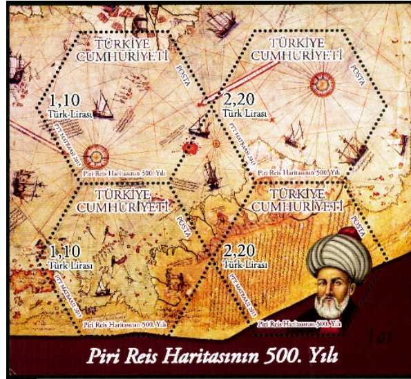
Resim 18. Pîri Reis Haritası 116x105 mm.

kolaylaştıracak olan Kitab-ı Bahriye isimli diğer eseri hazırlamıştır. Eseri inceleyen İbrahim Paşa kendisinden, tuttuğu notları gözden geçirmesini ve çalışmayı yeniden düzenlemesini istemiştir. Kitabın tamamlanmasının ardından İbrahim Paşa kitabı Kanunî Sultan Süleyman'a sunmuştur. Padişahın kabulü üzerine Piri Reis, Hint Donanması Kaptanlığına getirilmiştir. Ayrıca Piri Reis 1528'de birincisine göre teknik açıdan çok daha nitelikli bir eser olan ikinci bir dünya haritası çizmiştir (Sezgin, 2013:4-7; Topdemir, 2013:42-44).