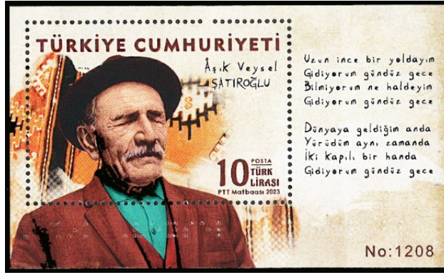
Resim 23. Aşık Veysel Seri Numaralı Anma Bloku 87x52 mm.

Resim 21 ve 22’de 2023’te tedavüle çıkarılan ve Aşık Veysel Şatıroğlu başlıklı çalışmayı oluşturan iki adet anma puluna yer verilmiştir (Filateli, t.y.). Yatay formata sahip olan pullarda Aşık Veysel ’in portresi, şiirleri, sazı ve kilim motifleri tema olarak kullanılmıştır. Ozanın fötr taktığı ilk tasarımda, dokuma kültüründe yaygın olarak kullanılan akrep motifi ile Dost dost diye nice nicesine sarıldım vecizesi yer alırken diğer tasarımda yine kendi eseri olan Aldanma cahilin kuru lafına kültürsüz insanın küllü yalandır vecizesi ile sazı ve dokuma kültüründe yaygın olarak görülen göl ve çengel motifi yer almaktadır.