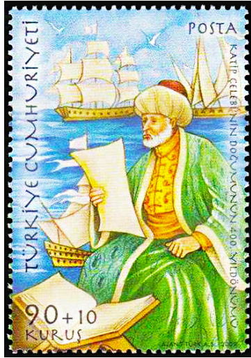
Resim 14. Kâtip Çelebi 36x52 mm.

1608'de İstanbul'da doğan Kâtip Çelebi bibliyografya 1 , biyografi 2 , coğrafya ve tarih ile meşgul olmuştur. Asker olan ve aynı zamanda Enderun Mektebi'nde iyi bir tahsil görenek yetişen babası, henüz küçük yaşlarda olan oğlu Kâtip Çelebi ile ilgilenmeye başlamış ve oğlunun iyi bir eğitim almasını sağlamıştır. Günümüzde 20 kadar önemli eser verdiği bilinen Kâtip Çelebi, en eski Coğrafya kitabımız olarak bilinen Cihannümmâ ile on beş bine yakın kitap ve on bine yakın müellifi tanıtan Keşf-üz-Zünûn an Esâmi'il Kütüb vel-Fünûn isimli bibliyografyayı yazmıştır. 1656'da vefat eden Kâtip Çelebi'nin kabri İstanbul'un Fatih ilçesinin Unkapanı semtinde yer almaktadır (Acaroğlu, 1961:139; Kâtip Çelebi, t.y:111-113).