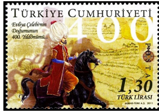
Resim 17. Evliya Çelebi 36x52 mm.