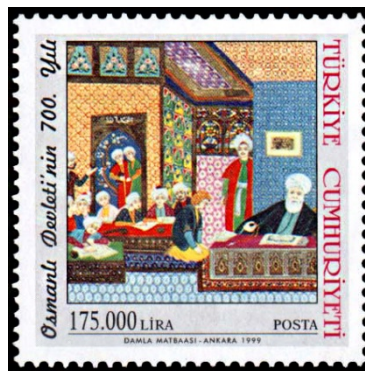
Resim 8. Enderun Mektebi. Görsel Kaynak: Araştırmacının arşivinden

Görsel Kaynak: Araştırmacının arşivinden