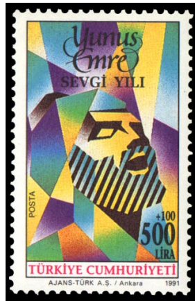
Resim 4. Yunus Emre Sevgi Yılı 26x41 mm.

13. ila 14. yüzyıllarda Orta Anadolu'da yaşamış olan önemli şahsiyetlerden birisi de Yunus Emre'dir. Türkçe'ye iyi derecede hâkim olan Yunus Emre, Hacı Bektaş Veli'nin sohbetlerine icabet etmiş ve yine onun telkiniyle Tapduk Emre'ye giderek uzun yıllar hizmetinde bulunmuştur (Banarlı, 1971:326). Kuraklık ve kıtlığın yanı sıra Anadolu'daki siyasi istikrarın da iyice bozulduğu o dönemde Yunus Emre hem Allah (cc) sevgisi, dini inanç ve ahlaki değerler gibi konuları Türk-İslâm sentezi çerçevesinde teşekkül etmeye çalışmış hem de dönemindeki Farsça eserler üreten şahsiyetlerden farklı olarak tasavvufa dair manaları Türkçeleştirerek kendine özgü üslubuyla sunmuştur (Yavuz, 2017:27-29).