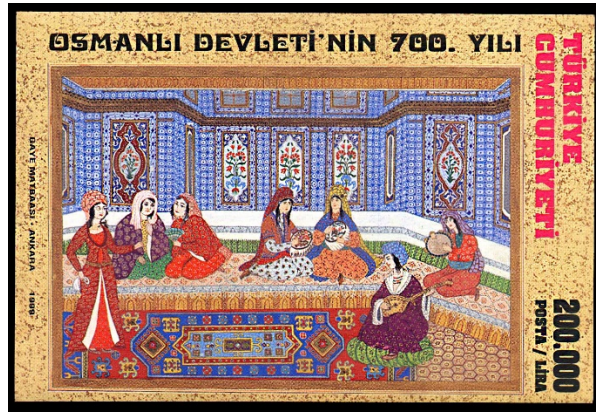
Resim 10. Osmanlı Sarayında Yaşam.