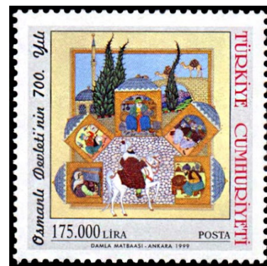
Resim 7. Osmanlıda Günlük Yaşam.