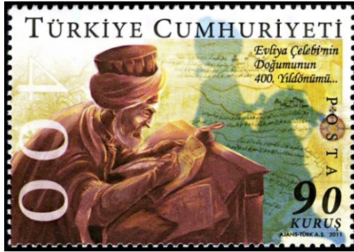
Resim 16. Evliya Çelebi 36x52 mm

İstanbul'un Unkapanı semtinde 25 Mart 1611'de dünyaya gelen Evliya Çelebi kendisini seyyâh-ı alem ve nedim-i ben-i âdem Evliya-yı bi-riyâ olarak tanıtmıştır. Babası Mehmet Zilli Efendi Saray-ı Âmire'nin kuyumcubaşısıdır. Fıkıh, Tefsir, Kalam ve Hadis ilimlerinin yanı sıra nakış ve hat dersleri de alan Evliya Çelebi 25 yaşından sonra 4 yıl kadar Enderun Mektebi'nde eğitim görmüştür. Sarayda bulunduğu süre içerisinde musahiplik görevinde bulunan Evliya Çelebi askerlik hizmetini yerine getirerek 22 sefere çıkmıştır. Yine kendisi seyyah oluşunu istihareye yattığı sırada gördüğü bir rüyaya bağlamıştır. Buna göre: Rüyasında Peygamber Efendimiz Hz. Muhammed'i (S.A.V) ve arkadaşlarını gören Evliya Çelebi şefaathane Resulallah diyeceği yerde heyecandan seyahat ya Resulallah dediğini beyan etmiştir. Bunun üzerine kendisine hem şefaathane edilmiş hem de seyahat izni verilmiştir. Rüyasındaki Sa'd b. Vakkas ise gittiği yerlerde gördüklerini yazmasını istemiştir. Gördüğü rüyanın etkisinde kalan Evliya Çelebi sabah uyandığında Mevlevi Şeyhi Abdullah Dede'ye gitmiş ve gördüğü rüyayı anlatmıştır. Rünyayı yorumlayan Abdullah Dede gezmeye öncelikle İstanbul'dan başlamasını ve topladığı bilgileri yazmasını istemiştir. Bunun üzerine hayatının kalan kısmında gezip dolaşan Evliya Çelebi Türk kültür tarihi açısından oldukça önemli olan 12 ciltlik Seyahatname isimli eserini yazmıştır (Özçelik, 2012:11-20).