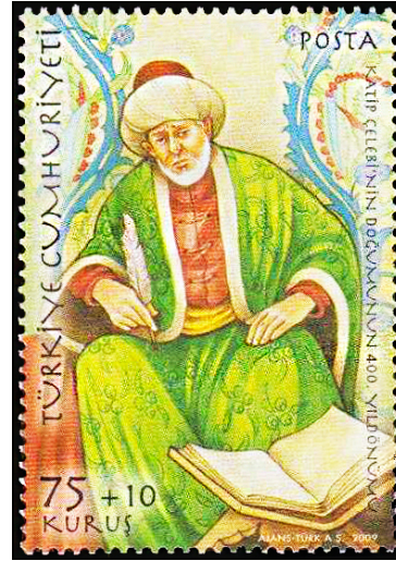
Resim 15. Kâtip Çelebi 36x52 mm.