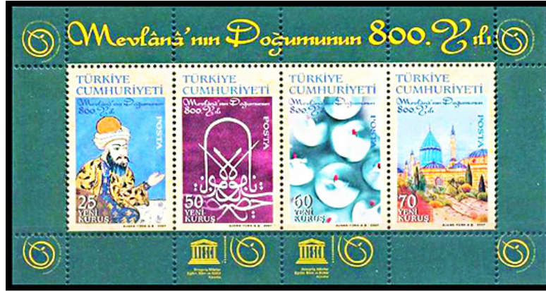
Resim 11. UNESCO Mevlânâ'nın Doğumunun 800. Yılı 130x67 mm.