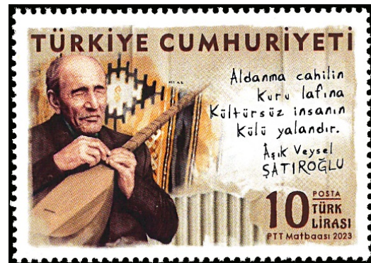
Resim 22. Âşık Veysel 36x52 mm.