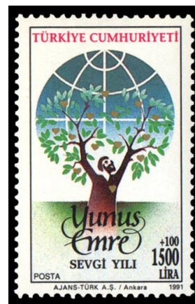
Resim 5. Yunus Emre Sevgi Yılı 26x41 mm.