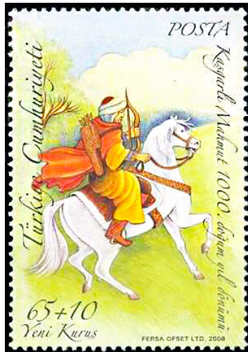
Resim 12. Kaşgarlı Mahmut 36x52 mm.

Kesin olmamakla birlikte doğum tarihi 1025 olarak kayıtlanan Kaşgarlı Mahmut, Karahanlılar döneminde yetişmiş ilk Türk dil bilginidir. Kaşgarlı Mahmut Tahir Mervezi, Beyhaki ve Gerdizi gibi âlimlerle birlikte Türk illerini dolaşarak Türk kültürünün Araplara tanıtılmasında önemli katkılar sunmuştur. Etnograf, filolog ve ilk Türk haritacısı olan Kaşgarlı Mahmut yaşadığı dönemdeki Türk illeri ile oba ve boylarının kullandığı ağızları Divanü Lugati't-Türk adlı eserine taşımıştır (Sarı, 2016:5-8).