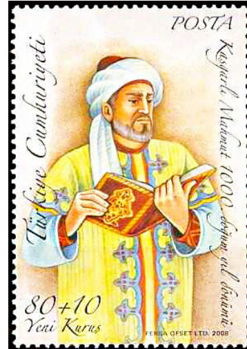
Resim 13. Kaşgarlı Mahmut Divanü Lugati't-Türk 36x52 mm.