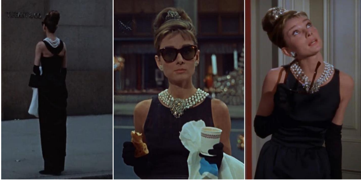
Şekil 3. Tiffany&Co önündeki kahvaltı sahnesi 01:34,01:48 ve 04:43 dakikalar

Bu çalışmada zarafetin vücut bulmuş hali olan Audrey Hepburn’ü stil ikonu haline getiren kıyafetlerinden 5 tanesinin göstergebilimsel analizi yapılmıştır.