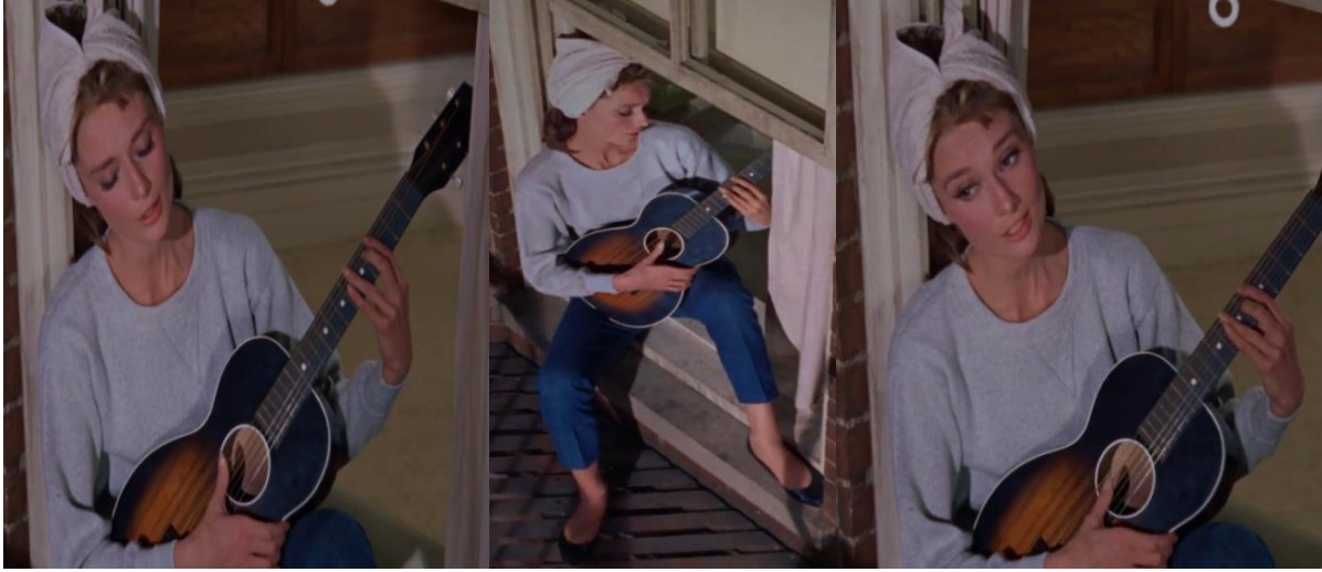
Şekil 5. Pencere kenarında gitarla şarkı söylediđi sahne 42:31 dakika Figure 5. Scene of singing on the windowsill with a guitar 42:31 minutes

Holy, dođal gzelliđiyle pencere kenarında gitarla şarkı sylerken masum yzn ve zarifliđini ortaya ıkaran sade kıyafetler tercih ettiđi sahne Şekil 5.'de gsterilmiř ve izelge 3.'de gstergebilimsel analizi yapılmıřtır.