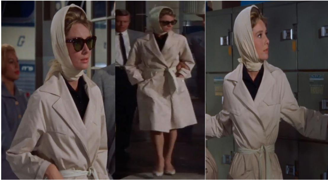
Şekil 6. Otobüs terminali sahnesi 53:20 ve 53:25. dakikalar

Minimalist lacivert burnu sivri babetleri düz kesim koyu toz mavi pantolonu da karakterin içindeki masum çocuksu yanını dışa vurmaktadır. Özensizce başına sarmış olduğu krem renk havlu, güven oluşturmanın yanına mütevazılığında göstergesi niteliğindedir. Pencere önünde gitar çalarken hiçbir takı aksesuarının üzerinde olmaması sadeliğin yanında ortama uygun kıyafet ve aksesuar seçtiğini göstermektedir.