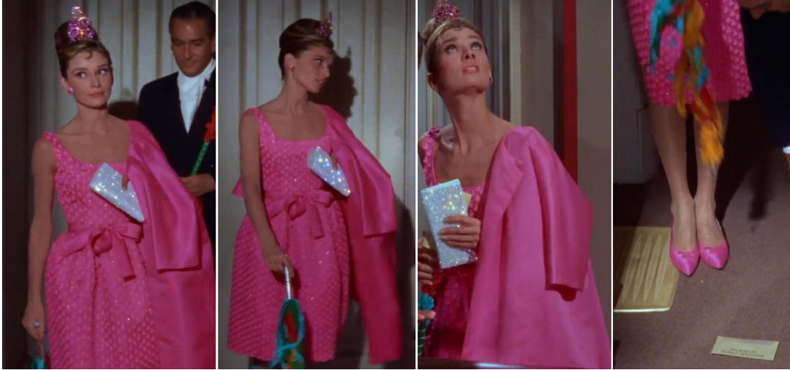
Şekil 8. Parti sahnesi 01:29:00, 01:30:02, 01:30:38 dakikalar