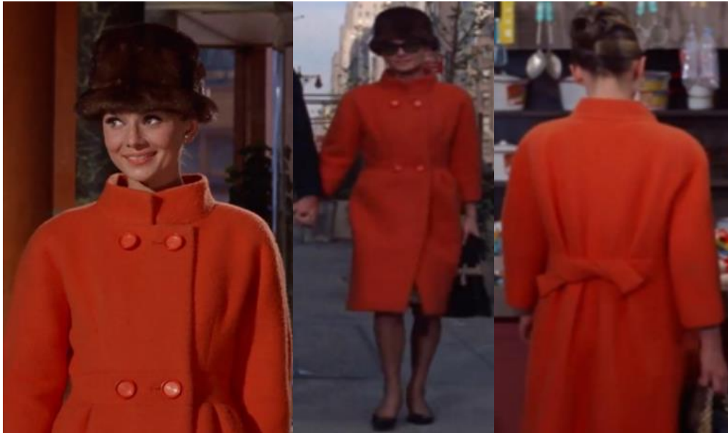
Şekil 7. New York sokaklarındaki sahne 01:08:56, 01:09:03, 01:17:10 dakikalar Figure 7. Scene on the streets of New York 01:08:56, 01:09:03, 01:17:10 minutes

Kültürel Kodlar: Küçük yaşta evlenmek zorunda kaldığı Teksaslı veteriner D. Golightly'in aniden New York'a gelerek onu götürmek istemesi Holy'nin hayallerini tehlikeye atar. Holy, askerdeki kardeşi Fred'le birlikte Meksika'da deniz kenarında bir at çiftliği kurmak için bu kötü hayata katlanmaktadır. Eşini kendisiyle gelemeyeceğine ikna eder ve D. Golightly'i otobüs terminalinden uğurlarken en sade haliyle ona veda etmek ister. Krem renk trençkotu sade ve duru görünümünün yanı sıra, güçlü ve kendinden emin kadın imajı çizmeyi hedeflemektedir. Kahverengi wayfarer büyük çerçeveli gözlük tercihinin nedeni eşinden ayrılan kadının gözlerindeki hüznü saklamaktır. Krem eşarpı evli kadın imajıyla birlikte ayrılığın üzüntüsünü vurgulamaktadır. 60'larda bu tarz eşarplar aksesuar olmakla birlikte kadın saçlarının düzgün olması için de tercih edilmektedir.