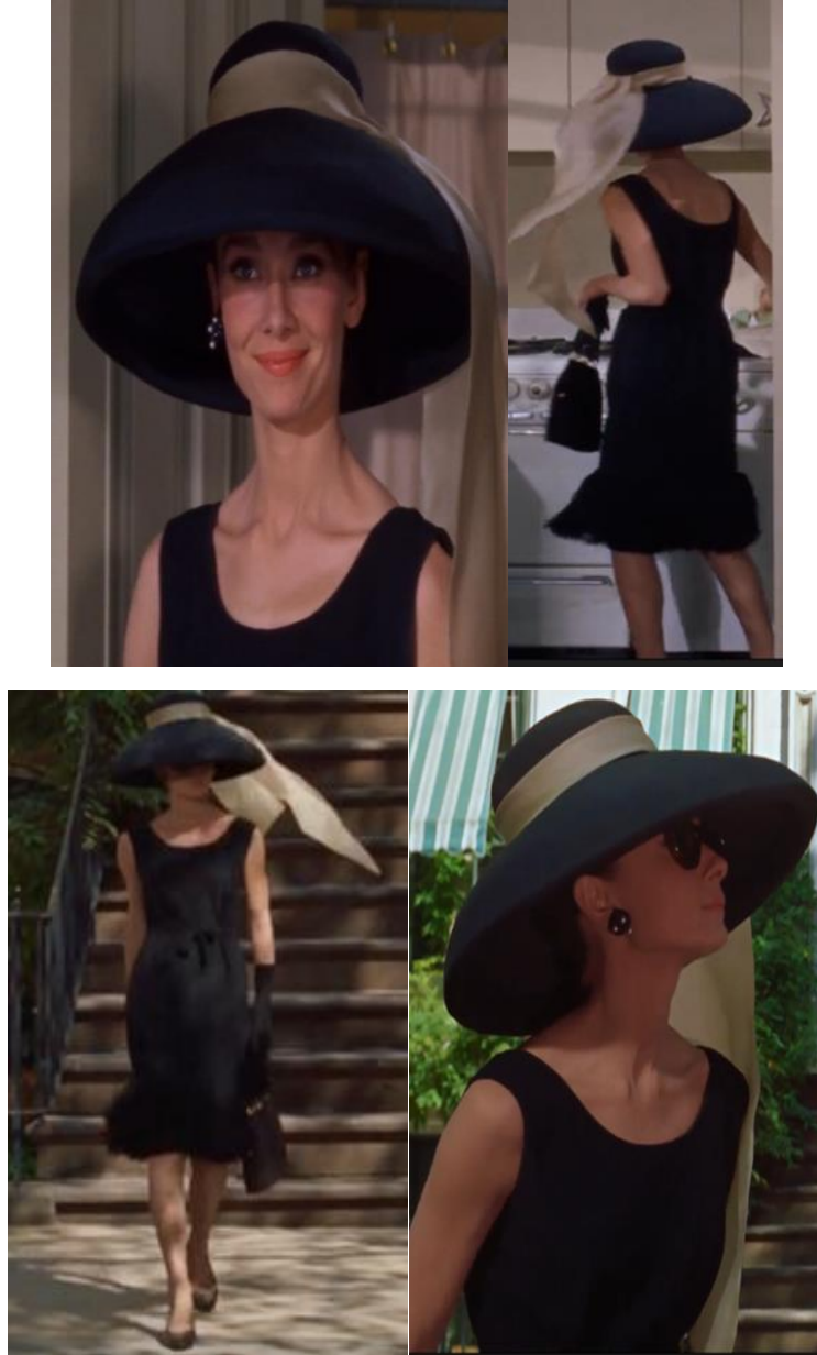
Şekil 4. Hazırlık sahnesi 12:18,12:38, 13:29 ve 13:35 dakikalar Figure 4. Preparation scene at minutes 12:18, 12:38, 13:29 and 13:35

Audrey Hepburn'u bir moda ikonu haline getiren "Küçük siyah elbise" filmde Holy'nin eski bir arkadaşını hapiste ziyarete giderken karşımıza çıkmaktadır. Holy komşusuyla sohbet ederek binadan çıkarken koridorda makyajını tamamlar ve taksiyi ıslıkla çağırarak komşusunu şaşırtır (Şekil 4.).