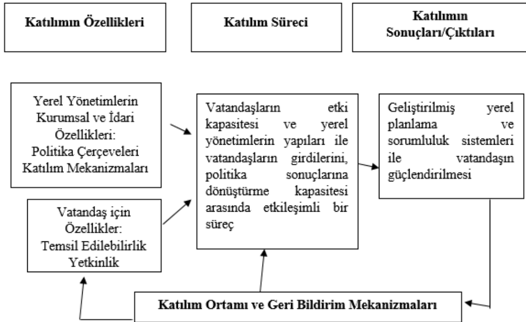
Şekil 1. Vatandaş katılımının dinamik çerçevesi ve elde edilen sonuçlar

Katılım, çift yönlü bir iletişim sürecini öngörmektedir. Katılımın başarılı olabilmesi bu iletişim sürecinin taraflarının (yönetici ve vatandaş) katılımın özelliklerini, katılım sürecinin gerekliliklerini ve katılımın çıktılarını içselleştirmelerine bağlıdır. Vatandaş katılımının dinamik çerçevesi ve elde edilen sonuçlara ilişkin şekil aşağıda verilmiştir (Pandeya, 2015, s. 72):