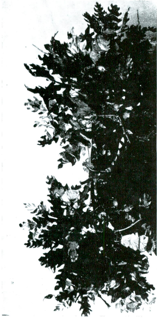
Bergama'da bulunmuş altın taç