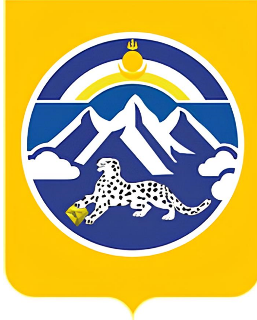
Soyot Türklerinin sembolü "Kar Leoparı"