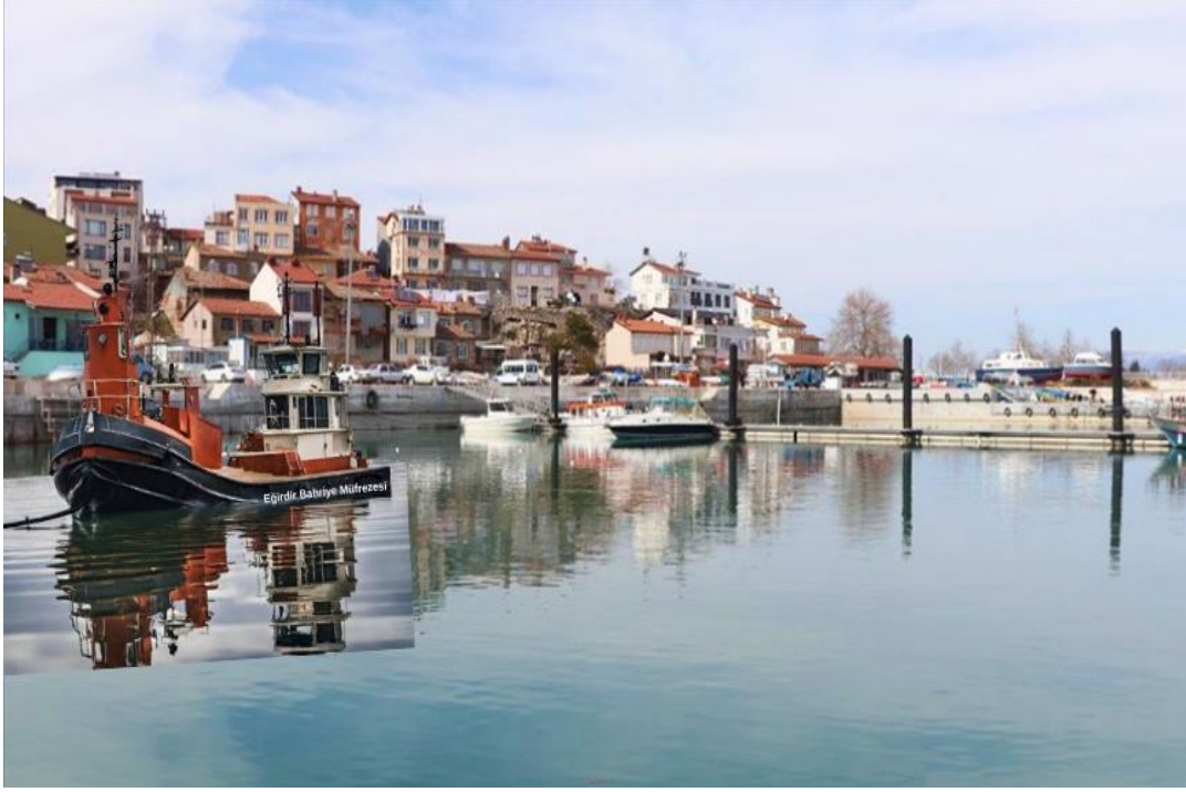
Fotoğraf 5. Eğirdir Limanı'nda, yapılması düşünülen römorkör görseli.