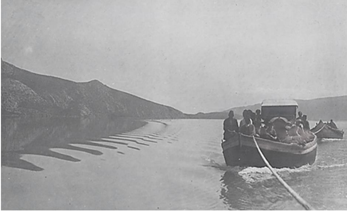
Fotoğraf 1. 1922’de Eğirdir Gölü üzerinden römorkörle bağlı kayıkların lojistik destek sağlama amaçlı personel ve mühimmat taşınması (Bozkurt, 2014, s. 185).

Sakarya Meydan Muharebesi’nin kazanılmasından sonra Büyük Taarruz hazırlıkları için eksikliklerin giderilmesine çalışılmıştır. Bunlar arasında Sakarya’da 100.000 kişi olan insan mevcudunun 200.000 kişiye çıkarılması ilk sırada yer almaktadır. Elbette gösterilen çabaya rağmen, sayısal anlamda Yunan ordusundan yine de noksan kalınmıştır (Kündeyi, 2023, s. 576). Milli Mücadele’de Büyük Taarruz öncesi Türk ordusunun Sakarya Nehri’nin güneyine çekilmesi ile yeni bir planlama yapılmış ve kış gelmeden Yunanlıların Anadolu’dan atılması kararlaştırılmıştı. Bu bağlamda Afyon’dan başlatılacak olan Büyük Taarruz planlanmış; bunun yanı sıra konunun da mihenk noktalarından birini teşkil edecek olan bir de gizli planlama yapılmıştı ki bu plana SAD planı adı verilmişti. (Belen, 2014, s. 367). Bu plana SAD denilmesinin nedeni, herhangi bir aksaklık durumunda ordunun geri çekilmesi söz konusu olur ise Yunan ordusunun içerilere girmesini engellemek amacı ile Sandıklı (Sandıklı’nın ‘S’ si; Arapça Sad Harfini simgeler) merkezinden hareketle Yunan ordusuna saldırı emri verilmiştir. (Çalışlar, 2007, s. 24). Bu bağlamda dönemin Genelkurmay Başkanlığı’nın Birinci Ordu’ya gönderdiği bildiri;