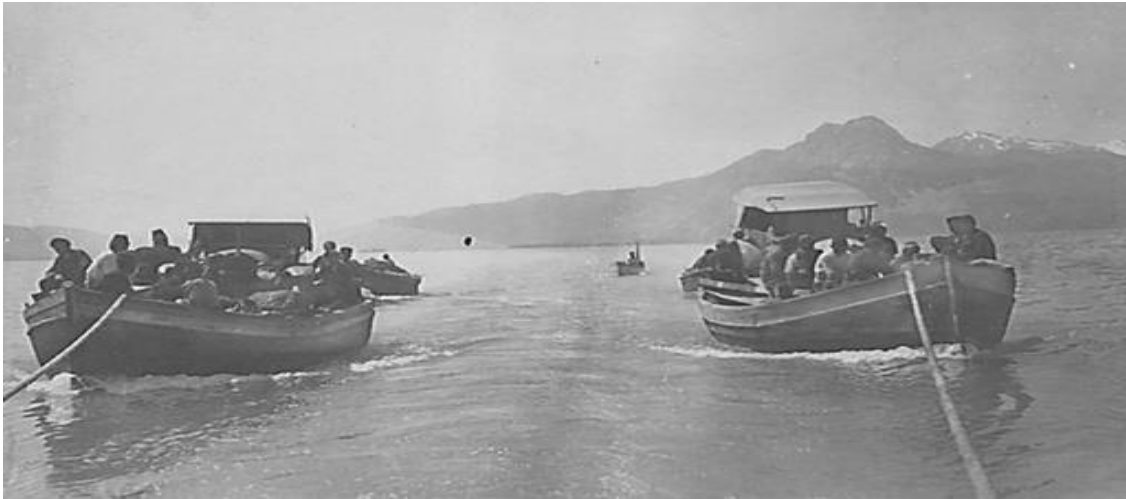
Fotoğraf 4. 1922 yılında General Harington'un aracının Eğirdir Gölü üzerinden taşınması. (Eğirdir Milli Mücadeleleri, Eğirdir Belediyesi ve Eğirdir Kaymakamlığı, 2021, s. 9. (General Charles Harington: İstanbul'un işgali sürecinde, işgal güçlerinin komutanlığını yapmış olan İngiliz komutan. Aracı İngiltere'den gemi ile Antalya Limanına getirilmiştir. Antalya'dan kara yolu ile Konya'ya, oradan Akşehir'e, Akşehir'den Aşağıkaşıkara'ya, oradan da römorkörler ile Eğirdir Gölü üzerinden çekilerek Tren vagonuna yüklenmiş ve İzmir'e gönderilmiştir)

Buradaki organizasyonu gizlice yapabilmek için de Eğirdir Gölü'nde işletmeciliğini Fransız şirketinin (Eğirdir Şimendifer İşletme Kumpanyası) yaptığı 100 Tonluk bir römorkör, 4 Duba ve 6 yerli araçtan oluşan filo Fransızlardan alınarak Genelkurmay Başkanlığına devredilmiştir. Eğirdir Gölü'nde bulunan tüm kayıklara el konularak, kayık sahipleri de yeni kurulan Bahriye Müfrezesi'nde çalıştırılmak ve askerlik hizmetinde kullanılmak üzere Eğirdir Bahriye Müfrezesinde silahaltına alınmışlardır (Müderrişoğlu, 1994, s. 394).