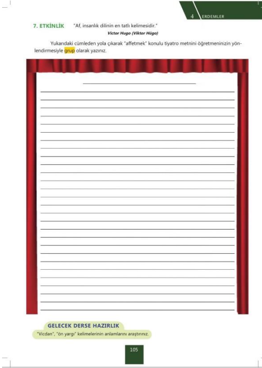
Resim 5. 6.Sınıf Türkçe ders kitabı etkinlik örneği

Resim 5'teki etkinlikte öğrencilerin öğretmenlerinin rehberliğine arkadaşları ile bir grup çalışması yapmaları istendiği görülmektedir. 21. yüzyıl becerilerinden iş birlikli çalışmanın, grup olma bilinci ile görev ve sorumluluk alma noktasında önemli olduğu düşünülmektedir. Öğrencilerin liderlik ve sorumluluk becerilerini de desteklediği düşünülen bu çalışmaların iş birlikli öğrenmeyi, grup içerisinde var olmayı ve görev ile sorumluluk bilinci geliştirmeyi desteklediği söylenebilir.