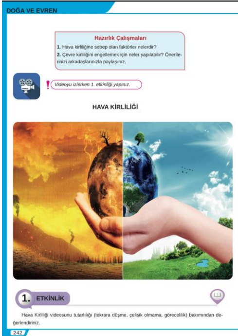
Resim 15. 8. Sınıf Türkçe ders kitabı etkinlik örneği

İncelenen kitapta yer alan ve 21. yüzyıl becerilerini içeren etkinlik örnekleri aşağıda verilmiştir: