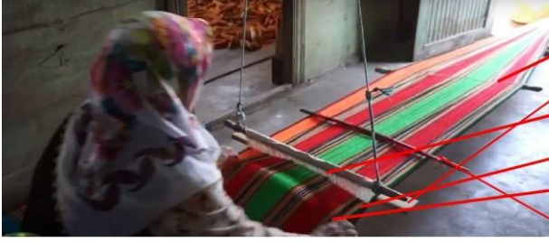
Fotoğraf 37: Evin girişine kurulmuş cimem tezgâh 2

bağlanır, ardından bu ipler evin geniş bir alanında tavana asılarak kurulan tezgâha yerleştirilir (Bk. Fotoğraf 37). Dış mekânda kurulan dokuma tezgâhı ise üççatal adı verilen ağaç dallarının tepeden birbirlerine bağlanmasından oluşur. Bu tezgâh benzer şekilde üç ağaç dalının tepeden bağlanarak birleştirildiği Özbeklerin üçayak anlamına gelen sipaya tezgâhlarına isim ve yapı olarak benzerlik gösterir.