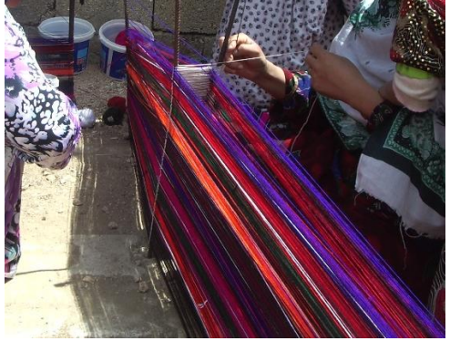
Fotoğraf 15-16: Mama ve tecrübeli kadınlar dokuma iplerinin renk ve sayısını takip ediyor

Dastarhan iki kat ipliklerin dokunmasıyla oluşur. Bu nedenle iplikler demir kazıkların etrafından tezgâha yerleştirilmesi amacıyla iki kat üst üste gelecek şekilde hazırlanır ve bir kadın iplerin doğru sırada ve sayıda olup olmadığını kontrol eder (Bk. Fotoğraf 17-18)