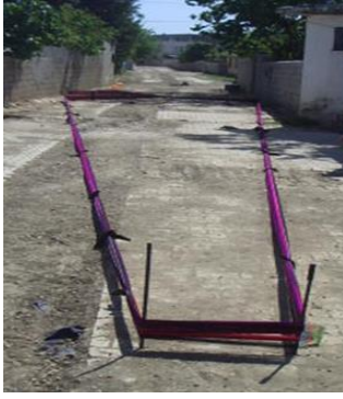
Fotoğraf 3: İplerin gerildiği düzenek (dar alan ) ön kısım (geniş alan)