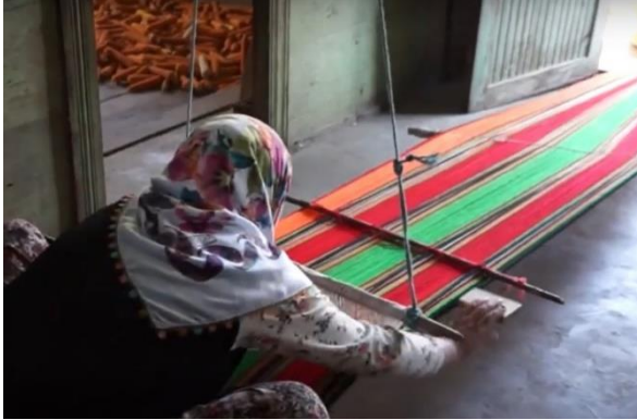
Fotoğraf 38: Cecim dokuma da tezgâh ve dokuma biçimi bakımından dasdar ve dastarhan ile benzer özellikler göstermesi dikkat çekicidir

İpliklerin kazıkların etrafında gerilerek dolanmasından oluşan çözgü aşaması, tezgâhın kurulması, kullanılan araç ve gereçler, dokuma işlemi ve sonrası dastarhan ve cecim ile benzer özellikler göstermektedir (Bk. Fotoğraf 38). Cecimde de dastarhanda olduğu gibi elde edilen dokuma istenilen ürüne göre kesilip birbirlerine dikilmesiyle hazırlanmaktadır.