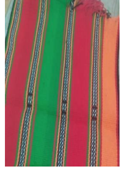
Fotoğraf 39: Cecim (Ayşe Sencar Arşivi) Fotoğraf 40-41: Cecim Pazar çantası ve cecimin güzeli denilen çiçek motifi, dizimin çiçeği (Ayşe Sencar Arşivi)