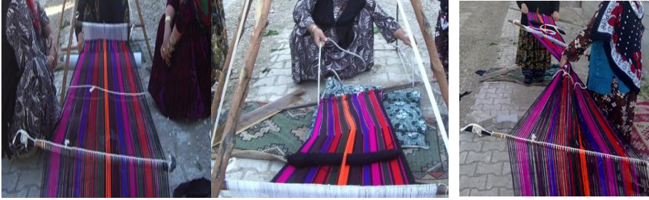
Fotoğraf 24: İpliklerin deneme amacıyla tezgaha yerleştirilmesi Fotoğraf 25-26: Tezgah ve iplerin evin avlusuna taşınması

kenetlendiği uçayağa sabitlenen tezgâha dokuma yapmak amacıyla hazırlanmış ipler yerleştirilir. Burada amaç, dokuma sırasında olası çıkabilecek sorunların önüne geçmektir. İplerin sırası, gerginliği, bağlı oldukları yerler tecrübeli kadınların müzakereleriyle karara bağlanır (Bkz. Fotoğraf 24). Ön dokuma işlemi tüm kadınların incelemelerinden geçtikten sonra toplanır ve evin avlusuna ya da bahçesine kurulan yer tezgâhına dokuma bitene kadar kaldırılmamak üzere yerleştirilir (Bk. Fotoğraf 25-26).