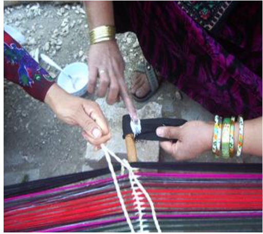
Fotoğraf 22: Dokumada su borusu kullanımı Fotoğraf 23: Ahşap çubuğun ucunun kumaşla kapatılması

İplerin tezgâha yerleştirilmesi oldukça dikkat edilmesi gereken bir aşamadır. Bu aşamada özellikle tecrübeli kadınların yardımlarına ihtiyaç duyulur. Sokakta deneme amacıyla sipaya denilen üç ağaç dalının tepeden