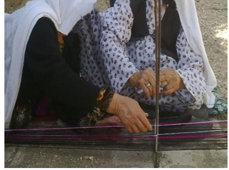
Fotoğraf 1 3 : Dastarhan dokuyan mama Fotoğraf 2: Mama ile dokuma ustası kadının fikir alışverişi

Birbirine paralel yaklaşık 30 ya da 40 m uzakta iki kazık çakılır. İki demir kazık arası ne kadar açılırsa dokumadan o kadar çok dastarhan elde edilir (Bkz. Fotoğraf 3 ve 4). Dokumanın kaç metre olacağı kulaç ölçümüyle belirlenir. Genellikle 30 m olan dokumadan en az 4 ya da 5 adet dastarhan elde edildiği belirtilmiştir.