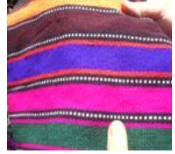
Fotoğraf 10: Dokumada kullanılan renkli ipler Fotoğraf 11-12: Dokumada ölçü alınan dastarhan

İpler örnek dastarhandaki renk sırasına ve sayısına göre kazıklar etrafında döndürülürken gerektiğinde iplere ekleme yapılır. Bu işi genellikle dokumacıliktan anlayan tecrübeli kadınlar yapar. Dokuma öncesi tezgâha iplerin yerleştirilmesi işleminin sorunsuz geçmesini sağlamak amacıyla kadınlar önemli noktalarda oturur ve süreci yakından takip ederler (Bk. Fotoğraf 13-14).