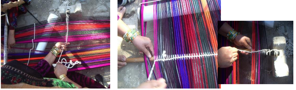
Fotoğraf 19-20-21: İp dolama işleminden sonra belirli sayıdaki ipler dokumak amacıyla gruplandırılarak bağlanır

amacıyla ipler bağlanır. Ardından ipler renklerine göre birbirinden ayrılarak dokumaya hazır hale getirilir (Bk. Fotoğraf 19-20-21).