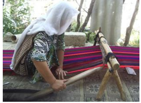
Fotoğraf 29-30: Yaklaşık 30-40 m dastarhan dokuma ve örnek ağaç tezgâh