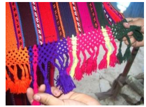
Fotoğraf 31: Birleştirilmiş dastarhan parçaları Fotoğraf 32: Düz dastarhan Fotoğraf 33: saçaklı dastarhan

Eni yaklaşık 30 cm olan üç parça dokumanın el dikişleriyle birleştirilmesinden elde edilen dastarhan sofranın üst ve alt uç kısımlarının kumaşla çerçevesiyle örnekler atalardan kalma denilen eski örneklerdendir (Bkz. Fotoğraf 34). Dastarhan, gündelik hayatta, bayram ve kutlamalarda yer sofrası olarak kullanıldığı görülür (Bk. Fotoğraf 35-36).