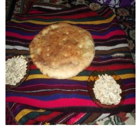
Fotoğraf 34: Eski dastarhan dokuma örneği Fotoğraf 35: Dastarhan sofrası Fotoğraf 36: Dastarhan ve nan (ekmek)