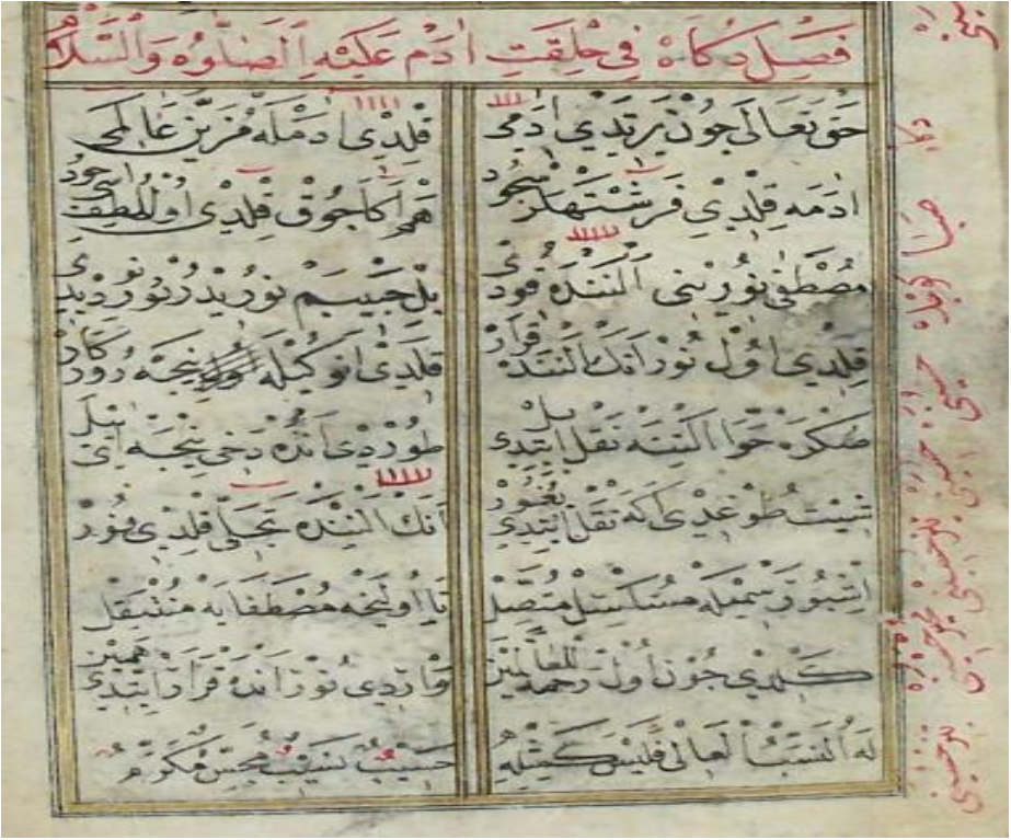
(Bursa Orhan Kütüphanesi Nüshasındaki Nur Bahri)

Buradan hareketle tespit edebildiğimiz farklı yıllarda yazılmış 21 makam kayıtlı mevlid nüshası, yaptığımız bu tez çalışmasıyla mukayese edilmiş ve yakın zamanımızdaki meşhur mevlidhanların icra örnekleriyle de karşılaştırılarak, besteli mevlid geleneğinin günümüze kadar gelip gelmediği tespit edilmeye çalışılmıştır.