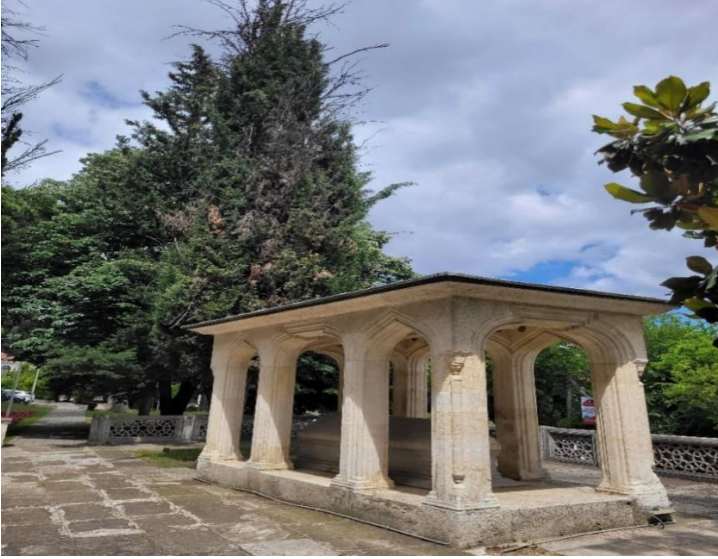
Görsel-1 (Süleyman Çelebi'nin Bursa'da Bulunan Türbesi)

Süleyman Çelebi'nin kaybolmaya yüz tutmuş türbesinin, Kazım Baykal'ın başkanlığında Bursa Eski Eserleri Sevenler Kurumu vasıtasıyla, tekrar yapılmasına karar verilmiştir. Bu vesileyle türbenin ne şekilde olacağıyla alakalı ödüllü bir proje yarışması düzenlenmiştir. Birinci olan proje hayata geçirilerek türbe 1 Kasım 1952 yılında tamamlanmıştır. (Baykal, 1952: 16)