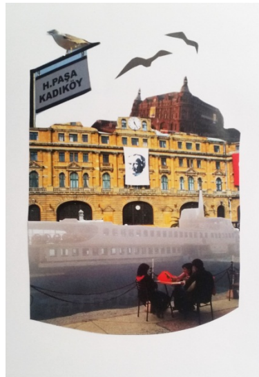
Şekil 3: Öğrenci Çalışması

Şekil 1'de araştırmanın uygulama aşamasında incelenmek üzere seçilen Burhan Doğançay'ın "İstanbul" adlı çalışması yer almaktadır. Tuval üzerine akrilik ve kolaj teknikleri kullanılarak yapılan bu çalışmanın konusu İstanbul'dur. Şekil 2 ve Şekil 3'te bu çalışmadan yola çıkılarak, öğrencilerin kendi yorumlarıyla yaptıkları İstanbul konulu öğrenci çalışmaları yer almaktadır.