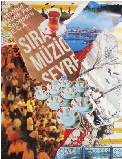
Şekil 2: Öğrenci Çalışması