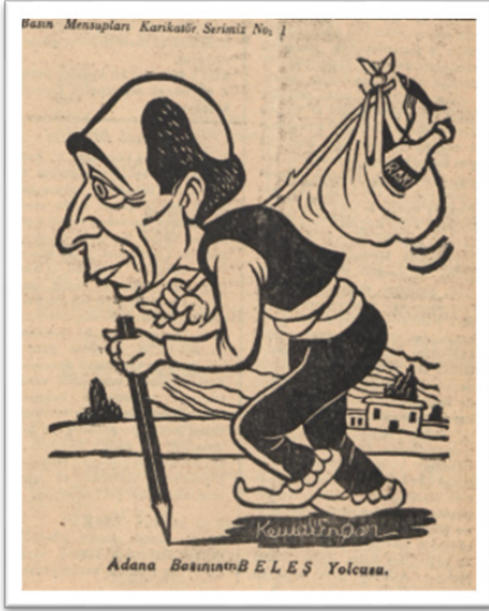
Görsel-2: Seyhan 32. Nüshasında Yer Alan Karikatür