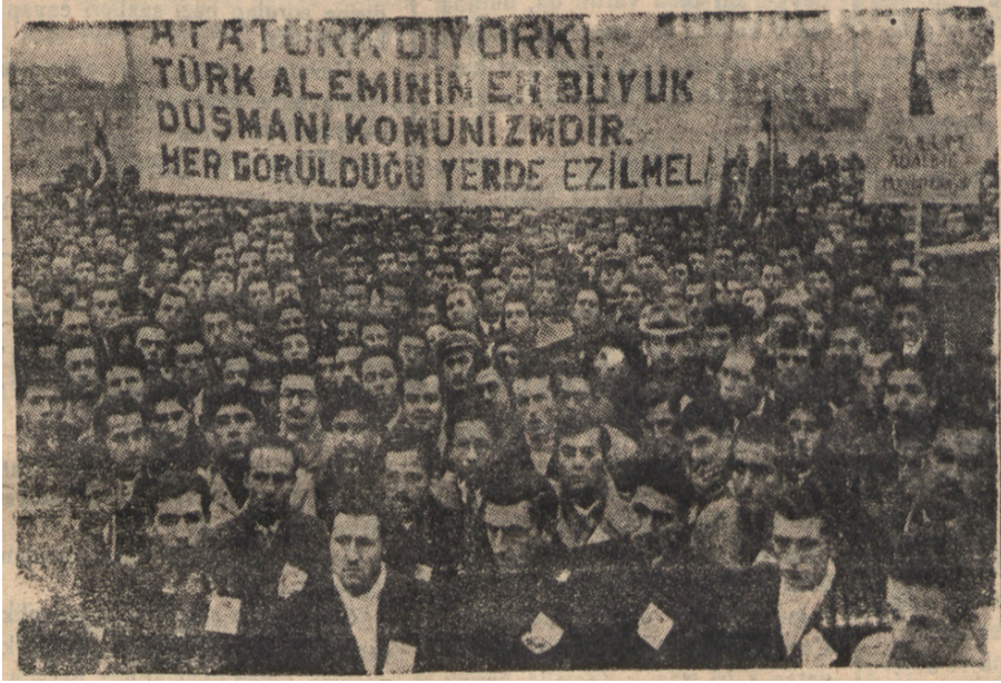
Görsel-6: Erkek Lisesi Öğrencilerinin Komünizm Karşıtı Gösterilerinden Bir Görsel

Fotoğraftan anlaşılacağı üzere Mustafa Kemal Atatürk'ün komünizmle ilgili sözlerinin olduğu dövizler Erkek Lisesi öğrencileri tarafından taşınıyordu. Aynı sayfada Orhan Kuntalp tarafından yazılan “ Ezilecek Başlar ” başlıklı yazıda dünyanın nefretini kazanmış olan kızılara (komünist Ruslar) karşı birkaç kişinin bile gönül vermesinin kabul edilemeyeceği açıkça ifade ediliyordu. Türklüğe uzanacak ellerin/bu tür girişimlerin hiç tereddüt edilmeden kırılabileceği belirtiliyordu. Ayrıca Seyhan sonraki sayılarında da komünizm karşıtı yazı ve bölümlere çeşitli içeriklerle yer vermeyi ihmal etmedi.