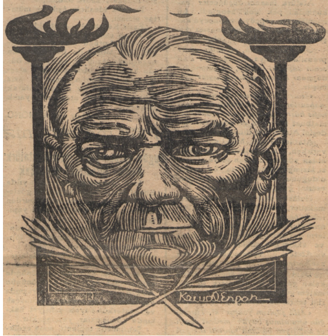
Görsel-9: 10 Kasım Münasebetiyle Paylaşılan Resim

Millî anma/kutlama günleriyle ilgili içerikler düzenli olarak okuyuculara sunulmaktaydı. Örneğin, 30 Ağustos 1949'te Zafer Bayramı münasebetiyle paylaşılan içeriklerde Valilik tarafından yapılacak program yayınlandı. Seyhan'ın 128. nüshasının ilk sayfasında güne özel yazılar ve bölümler paylaşıldı. Türk'ün gurur günü mottosuyla aktarılan içeriklerde köşe yazıları, tam boy Atatürk görseli ve şiirlere yer verildi. Ek olarak gazetede Adana kenti bayram kutlamalarında bando gösterileri ve fener alayı düzenleneceği bilgisi de paylaşıldı. 46