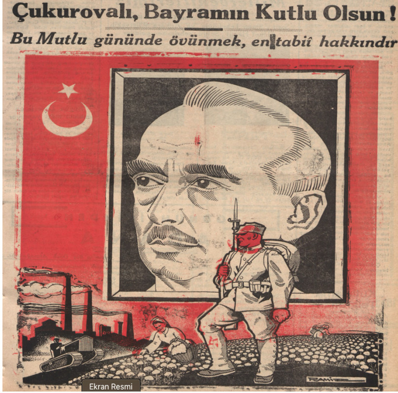
Görsel-8: Adana'nın Kurtuluşu Münasebetiyle 5 Ocak 1948 Tarihli Seyhan'ın Paylaştığı Görsel

Görselden anlaşılacağı üzere çizeri "Ramiz" idi. İsmet İnönü portresi önünde pamuk tarlasında çalışan kadınlar, tarımda makineleşmeyi gösteren bir paletli makine, fabrika bacaları ve bir Türk askeri resimleri görülmektedir. Çukurova'nın aksettirildiği görsel adeta dönemin iktisadi-politik mesajlarını içeriyordu. 5 Ocak günü sadece Adana değil Tarsus ve İskenderun gibi kentlerde de kutlandı. Ayrıca ünlü şair Arif Nihat Asya "Bir Yolcudan Beş Ocak Armağanıdır" notuyla okuyuculara sunduğu "Adana" adlı şiiri de gazetede paylaşılmıştı. Adı geçen şiirin bir bölümü şu şekildeydi: 44