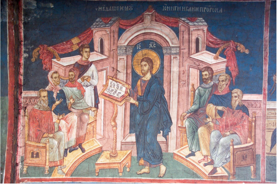
Res.1: İsa Mesih Sinagog'da Vaaz Veriyor (Bk. URL 1)

Bunlara ek olarak parrhēsiān ın “açık konuşma”nın yanı sıra “açık tavırda olmak” şeklinde görüldüğü kısımlar da söz konusudur. Parrhēsiastēs İsa Mesih'ten Yuhanna 7:4, kendini dünyaya göstermesi ya da tanıtması istenir. Çünkü insanlar, kendini “açıkça” anlatmak isteyen kişinin gizli işler yapmayacağını düşünür. Bu yüzden İsa Mesih'in eylemlerini “ ἐν παρρησίᾳ ” 73 yani “açık bir şekilde” ya da “açık sözlülükle/yüreklilikle” yapması gerektiği belirtilir. Benzer bağlamda John 11:54'te bu kez İsa Mesih'in dikkat çekmemek amacıyla “ οὐκέτι παρρησίᾳ ” 74 dolaştığı yani daha fazla kendini açık etmediği aktarılır 75 . Bu ifade parrhēsiastēs olarak İsa Mesih'in artık tamamen görünmeden gizli şekilde yaşadığı anlamına gelmez. Hayatını ortaya koyduğu şeylerden vazgeçmemiştir; yalnızca Yahudilerin arasında açık şekilde bulunmamaya karar vermiştir 76 .