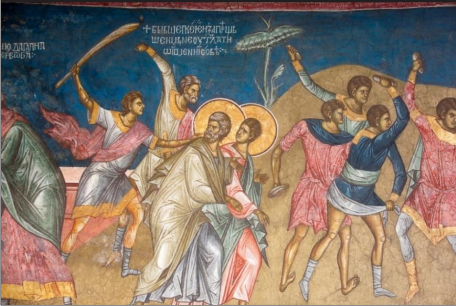
Res.6: Havarilerin Cezalandırılması ve Sürülmesi (Bk. URL 6)