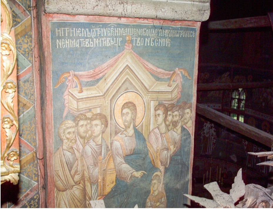
Res.2: İsa Mesih Havarilerini Eğitiyor

Bu nedenle Hristiyanlık çerçevesindeki mürit, öğrendiği veya bildiği hakikati ne pahasına olursa olsun duyurması gereken kişidir 78 . Buradaki önemli bir detay da müride yani parrhēsiastēse yol gösteren ilahi figürün varlığıdır 79 . Antik Yunan'da yol gösteren ile parrhēsiastēs aynı kişi iken Hristiyanlıkta değildir. Hristiyan parrhēsiastēsi ona gösterileni geniş kitlelere aktarandır.