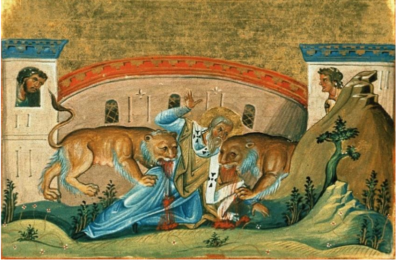
Res.8: Aziz Ignatios'un Şehitliği (Bk. URL 8)

inancını reddetmesi için ikna etmeye çalışmıştır. Hristiyanlıktan dönmelerini ve hatta kendi gençliğine acımasını istemiştir 105 . Ancak Germanikos katı duruşunu bozmamış ve vahşi hayvanlara parçalatılma pahasına Hristiyanlığı savunmaya devam etmiştir 106 . Yönetimin bu çabasına karşın, Germanikos kendini şehitliğe bir adım daha yaklaştırmıştır. Bağışlanmak yerine martır edilmeyi seçen Germanikos, İsa'nın ve müritlerinin izindeki bir Hristiyan olarak öldürülmeyi seçmiştir 107 .