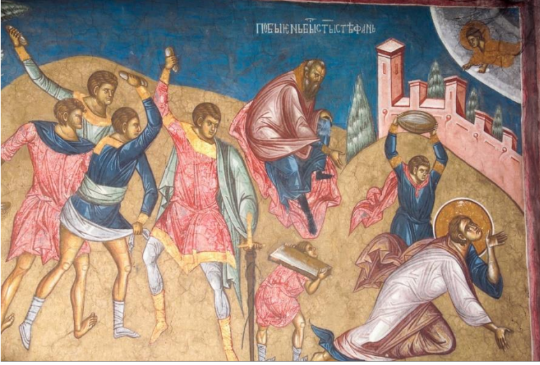
Res.7: Aziz Stephanos'un Taşlanması (Bk. URL 7)

temas geliştirmiştir. Ancak yaşamını adadığı Hristiyan inancı, Aziz Ignatios'un da hayatına mal olmuştur. Ignatios, imparator Trajan'ın yönetim döneminde yaşamıştır 99 . Hristiyan öğretilerini yayma faaliyetleri sonucu eylemlerinin hesabını vermek üzere imparatorun huzuruna çıkartılmıştır. Ancak imparator Trajan'ın ve Romalıların inandığı Tanrılara iblis demesi ve sadece tek Tanrı'nın var olduğunu savunması sonucu, hayatını tamamen riske atmıştır 100 . İsa Mesih'de de görüldüğü üzere aslında yönetimin önceliği yargıladığı kişiyi caydırmaktır. Benzer şekilde Antiokheialı azize karşı da aynı yönetim tavrı beklenmektedir. Buna ek olarak halihazırda, yönetim ve Hristiyan cemaat arasındaki sorunların azizin hünerleri ve sağduyusu sayesinde kolaylık çözüldüğü ve kimsenin zarar görmediği de Ignatios'un şehitliğinde belirtilmektedir 101 . Ancak azizin imparatora karşı kendi inancını ve hakikatini açık sözlülükle ve cesurca dile getirmesi, Ignatios'un Trajan tarafından ölüm fermanının imzalanmasına neden olmuştur. Sonuç olarak Ignatios elleri bağlanarak tutsak edilmiş ve vahşi hayvanlarca öldürülmek üzere Roma'ya gönderilmiştir 102 (Res.8).