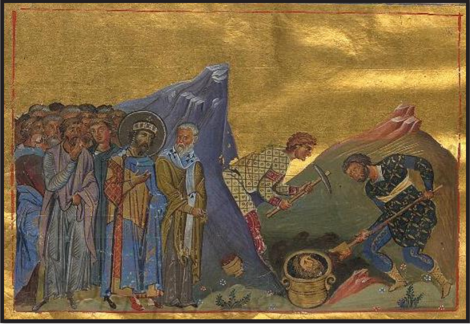
Res.3: Vaftizci Yahya'nın Kesik Başının Bulunması (Bk. URL 3)

des'in doğum gününü kutladığı gün, evlendiği kadının kızı verilen şölen sırasında dans eder. Herodes ve konukları bu danstan çok memnun olur. Bunun üzerine Herodes dans eden kıza yemin ederek, "dile benden ne dilerse, krallığının yarısı da olsa sana vereceğim" der. Genç kız ne dileyeceğini annesine sorar ve annesi de kızından Vaftizci Yahya'nın başını istemesini söyler 82 . Kral Herodes üzülse de verdiği sözü tutmak zorunda kalır ve Vaftizci Yahya'nın başını bir cellada kestirir 83 . Vaftizci Yahya'nın Yahudi geleneklerine bağlı kalmayan kralı kınaması ve doğal olarak bir kusurunu açıkça ortaya koyması, Yahya'nın ölümüne neden olur (Res.3).