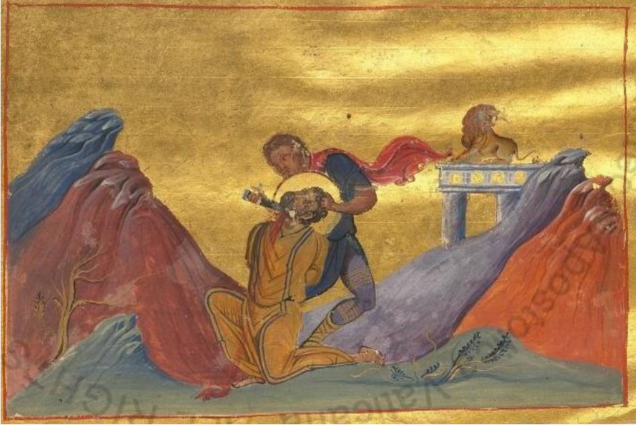
Res.5: Havarı Yakup'un Martyr Edilmesi (Bk. URL 5)