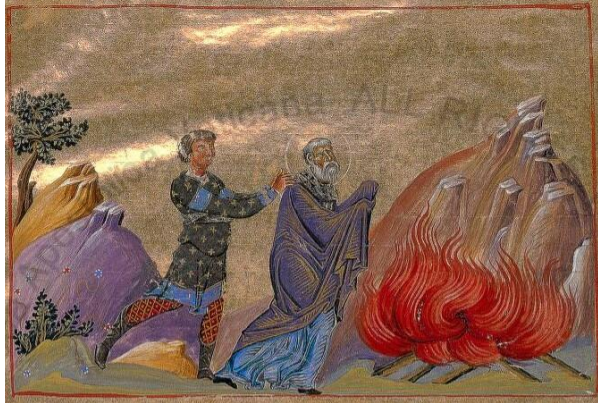
Res.10: Aziz Polykarpos'un Martyr Edilmesi (Bk. URL 10)

çıkartılır 121 . Rusticus Ioustinos'un inancını ve onun neye inandığını sorar. Ioustinos ise tüm dini öğretileri öğrenmeye çalıştığını ancak başkalarını memnun etmese bile gerçek öğretileri yani Hristiyan doktrinini kabul ettiğini söyler. Rusticus, Ioustinos'un bulunduğu durumla alay ederek "Bunlar mı seni memnun eden öğretiler; zavallı adam?" 122 diye sorar. Daha sonra Ioustinos'un öğrencileri olan bir grup Hristiyan da Rusticus tarafından sorgulanmaya başlar;