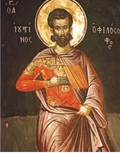
Res.11: Aziz Ioustinos (Philosophos) (Bk. URL 11)

miştir. Tanak'ın birinci ve üçüncü kısmını oluşturan Torah ile Ketuvim'de, parrhēsianın Tanrı'nın insanları özgür kılma, cesaretlendirme ya da onlara güç vererek güven içinde kalmalarını sağlama gibi çeşitli anlamlarıyla karşılaşılmaktadır. Bunların yanı sıra yine aynı bölümlerde Tanrı'nın kendi eylemselliği ve sorumluluk alma şeklinin de yine parrhēsia ile ifade edildiği görülmektedir.