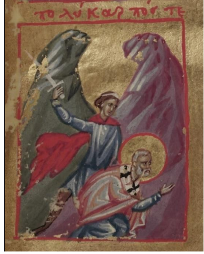
Res.9: Aziz Polykarpos’un Hançerlenmesi (Bk. URL 9)

Hem bir Hristiyan apologist 117 hem de din şehidi olan Ioustinos 118 da parrhēsiastēs olarak karşımıza çıkmaktadır 119 (Res.11). Ioustinos, Yahudiye’de 120 yaşamakta ve Hristiyan öğretilerini yaymaktadır. Bir gün Rusticus, bölgenin yerel yöneticisinin huzuruna sorgulanmak üzere