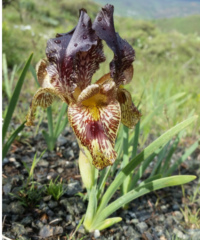
Şekil 3. Araştırma alanımızda yayılışı olan endemik Iris sari 'nin orijinal habitatındaki görünümü.