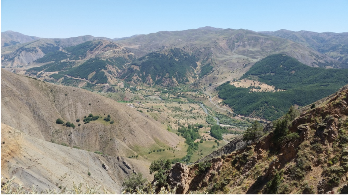
Şekil 2. Araştırma alanı içinde kalan Kaynarpınar Köyü çevresinden genel bir görünüm.

öbekler halinde tahrip edilmiş meşe toplulukları görülür. Ormanlık alanlara ve orman formasyonlarına 1400 m yükseklikten başlayarak 2400 m'lere kadar rastlanır.