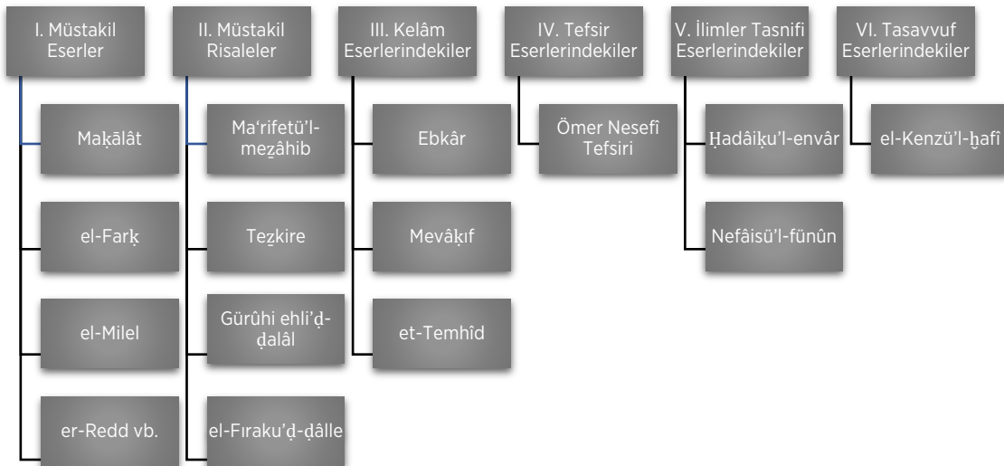
Tablo 14. Klasik Dönemde Fırka Tasniflerini İçeren Telif Türleri

Erken dönemde mezhepler tarihi eserleri ekseriyetle müstakil biçimde telif edilmiştir. Eş'arî geleneğinden Bağdâdî'nin el-Farq 'ı İsferyânî'nin (ö. 471/1078) et-Tebşîr 'i, -dinler tarihi boyutu olsa da- Şehristânî'nin el-Milel 'i alanın meşhur müstakil eserlerindendir. Doğu Hanefî geleneğinde ise müstakil tek metin Mekhûl en-Nesevî'nin er-Redd 'idir. Bunlar dışında Eş'arî ve Ka'bî'nin (ö. 319/931) Mağâlât 'ı, Nevbahtî'nin (ö. 311/924) Fıraku's-Şî'a 'sı, Malâtî'nin (ö. 377/987) et-Tenbîh 'i,