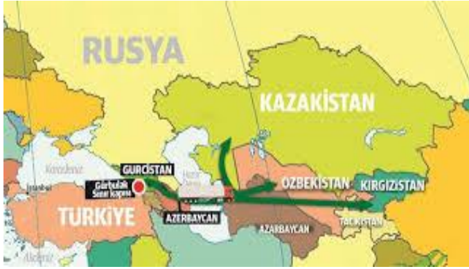
Şekil 3: Türkiye ve Özbekistan'ın coğrafi konumları