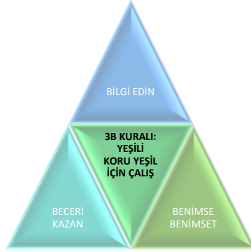
Şekil 1: 3B Kuralı

Yeşil yönetimde uygulanan bazı kural tipleri mevcuttur (Önel, 2021: 23-25). Bunlar; 3B kuralı ve 4R kuralı dır. 3B kuralı yeşili koruma amacıyla genellikle bireylerin çevreye yönelik davranış şekillerini değiştirmeye yöneliktir. Bilgi-beceri-benimseme olarak açıklanabilen kuralda amaç kişilerin çevreyi korumakla ilgili bilgi edinmeleri, buna yönelik olarak beceri kazanmalarını ve önce kendilerinin öğrendiklerini benimseyerek diğer kişilere bunu benimsetmesini kapsamaktadır. 4R kuralı ise kelimelerin İngilizce versiyonuyla kodlanmaktadır: Reduce (azalt), Reuse (yeniden kullan), Recycle (geri kazan), Refuse (reddet). Birey ve işletmeler aynı anda hitap eden kuralın amaçları şu şekilde özetlenebilir; azaltmak dinamiği ile kullanılan ürün ya da hizmetlerin kullanım sürelerini artırarak atık oranını azaltmak. Yeniden kullanmak ile bir ürün veya hizmetin birden fazla kullanılmasını sağlamak. Geri kazanım aşamasında atık ürünlerin gerekli işlemler sonrası tekrar kullanıma hazır hale getirmek. Son olarak reddetme aşamasında çevreye zararı olan, ekolojik dengenin bozulmasına neden olabilecek ürün veya hizmetleri kullanmayı reddetmektir.