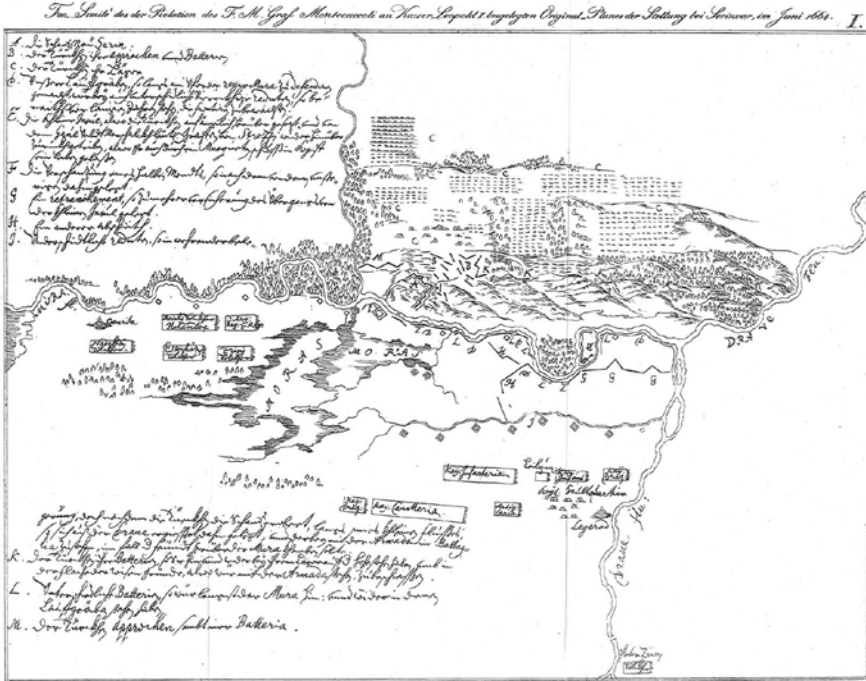
Harita 2. Raimondo Montecuccoli'nin kuşatma haritası (Doberdó, 1940, 23. ek)

27 Haziran'da kalede barut fiçılarının patlaması sonunda Montecuccoli, kullanılabilir silahları kaleden çıkarttırdıktan sonra kaleyi mayınlama emri verdi. 30 Haziran'da Osmanlı askerlerinin üçüncü taarruzu başarılı oldu. Morelen çöken savunma kuvvetleri kaleyi patlatmadan bırakıp kaçtılar.