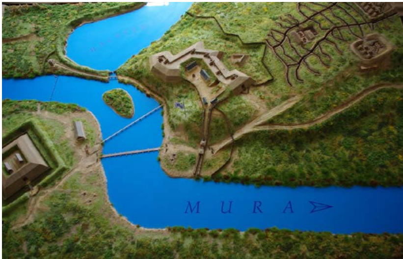
Resim 1. Zrínyi-Újvár maketi

125 mm çaplı bir top güllesinin bulunduğu 5 Mart 2008 tarihli kazıda yeni bir seviyeye ulaşıldı. Güllenin bulunduğu yerin civarlarında sonradan yapılan kazılarda 10-20 cm derinlikte daha çok kurşun bulundu. Yaz kazıları boyunca daha fazla, ama küçük (65-115 mm çaplı) top güllesi keşfedildi; bundan yola çıkılarak Osmanlı top siperinin bulunduğu söylenebilir. Kaynaklara göre Osmanlı kıtaları özellikle küçük toplarla Mura ırmağının diğer tarafında konuşlanan Hristiyan kuvvetlere, daha sonra da tekneköprüsüne ateş ediyorlardı. Ondan sonra yamaçta da araştırmaya başladı. Bu yer hakkında olan eski haritalar ve hava fotoğrafları alanda sürekli bir orman olduğunu bahsetti, bunun için orada toprak bozulmamış kazılmamış durumda kalabilirdi. Top sipari önünde iki kuşakta kullanılmış ve kullanılmamış kurşunlar bulundu. Tahmine göre bu bir saldırının iziydi. Silahşorlar belirli bir sıra üzerinde durup ateş ediyorlardı. Kullanılmış kurşunlar Osmanlıların ateşlediği kurşunlardı; kullanılmamış kurşunlar ise silahşorların bıraktığı kurşunlardı 19 .