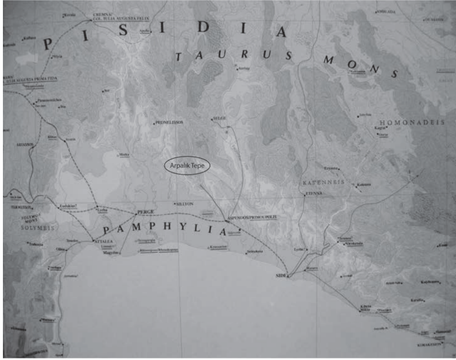
Figür 1. Arpalık Tepe, Genel Görünüm (Talbert, 2000, 65).