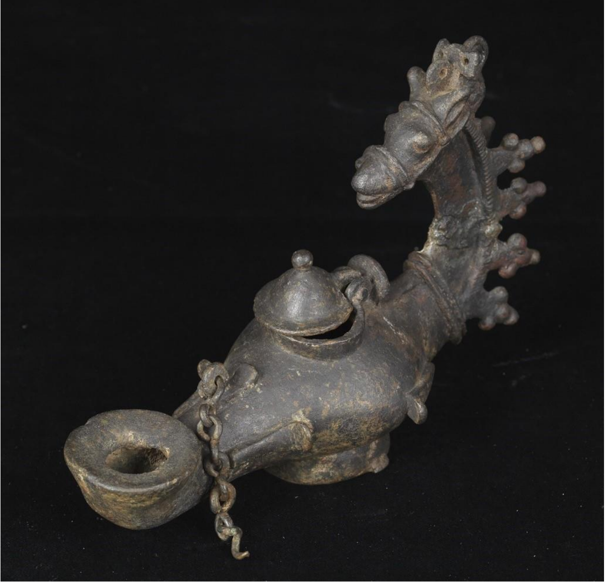
Şekil 5. Metsovo Folk Art Müzesi, At Protomlu Kulpa Sahip kandil, (Envanter No: 1015). 68