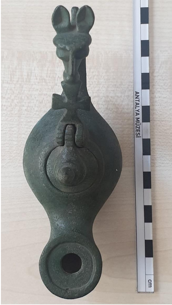
Şekil 1. Antalya Müzesi, grifon kulplu kandil, üstten görünüm