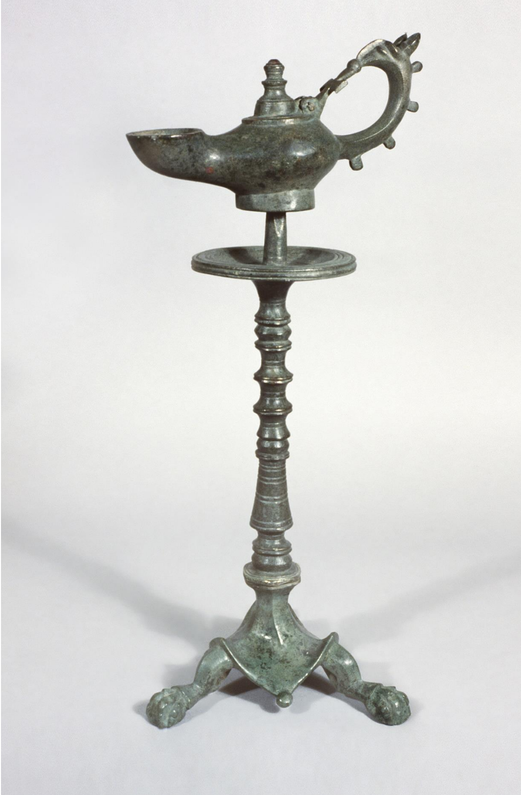
Şekil 6. Dumbarton Oaks Koleksiyonu, Grifon Kulplu Kandil ve Kandelabrum (Envanter No: BZ. 1950.26-27). 69