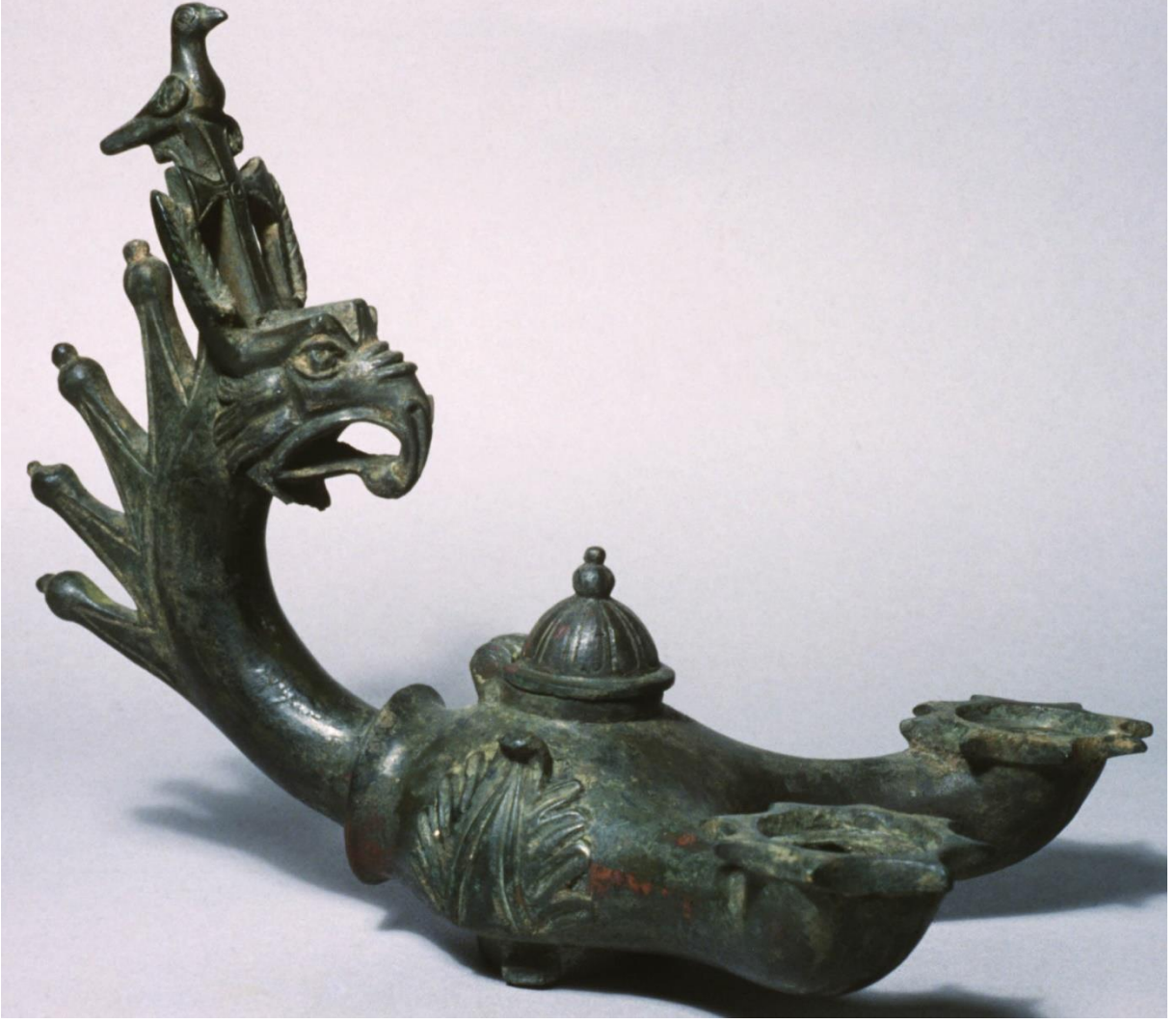
Şekil 8. Dumbarton Oaks Koleksiyonu, Grifon Kulplu Kandil, (Envanter No. BZ.1962.15). 71