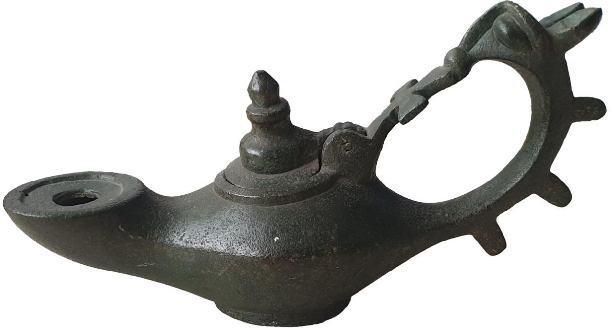
Şekil 1. Antalya Müzesi, Grifon Kulplu Kandil, (Envanter No: A787) Yandan Görünüm