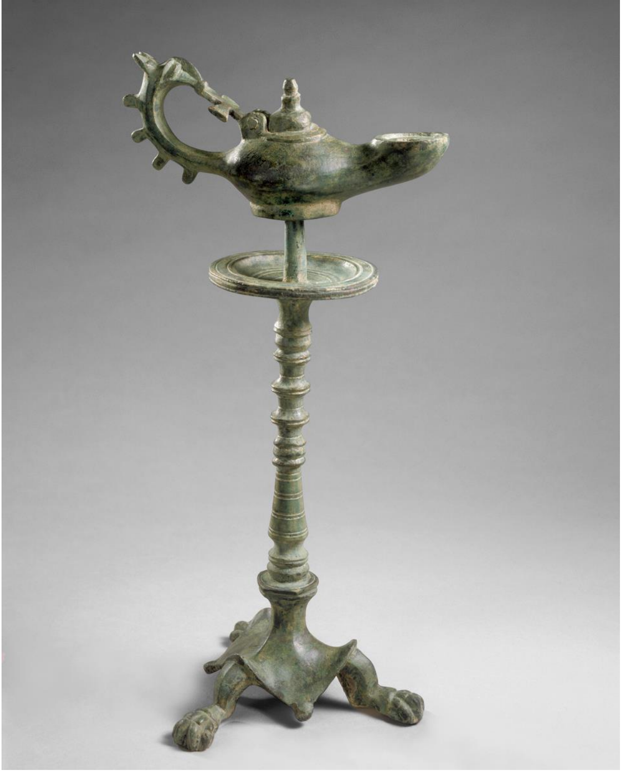
Şekil 7. Cenevre Sanat ve Tarih Müzesi Koleksiyonu, Grifon Kulplu Kandil ve Kandelabrum. (Envanter No: AA 2004-0218). 70