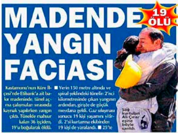
Şekil 10. 9 Eylül Tarihli Hürriyet Gazetesi Haberi

karbon monoksit ve diğer zararlı gazlar çalışanların zehirlenerek ölmelerine ya da yaralanmalarına sebebiyet vermiştir (MMO, 2004). Şekil 10'da 9 Eylül'de yayınlanan Hürriyet gazetesindeki haber görülmektedir.