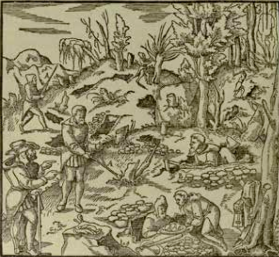
Şekil 1. Eski Zamanlarda Maden Arayan İnsanlar (Agricola, 1912).

İnsanoğlu hayati ihtiyaçlarını karşılayabilmek için varoluşunun başından beri tarım ve madencilik yöneltmiştir. Bu sebeple madencilik tarihi insanlık tarihi kadar eskiye dayanmaktadır. Bilinen ilk madencilik faaliyetlerinin kesin bir tarih olmakla birlikte M.Ö. 300.000'e dayanmadığı ve bu tarihte insanoğlunun silah ve çeşitli araç-gereç yapımı için sileks, çakmaktaşı ve obsidiyen çıkarmaya ihtiyaç duyduğu belirtilmektedir (Hartman, 1992). 1960'lı yıllara kadar kayıtlara geçen ilk madencilik faaliyetinin Sina Yarımadası'nda gerçekleştirilen turkuaz madencilik olduğu öne sürülmekteydi ancak, 20. Yüzyılın ortasında yapılan keşifler sonucunda ilk madencilik faaliyetinin Svaziland'daki hematit ocağı olduğu ve M.Ö. 43.000 yılında işletildiği sonucuna varılmıştır (Unwin, 2012). Belki de ileriki yıllarda yapılacak keşifler, arkeolojik kazılar ve araştırmalar madencilik tarihinin çok daha eski olduğunu gözler önüne serecektir. Şimdilik ilk madencilik çalışmalarının bu tarihlere dayandığını ve bu tarihten sonra da insanoğlunun beslenme dışındaki tüm ihtiyaçları için yer kabuğunu kazarak maden çıkarmaya, işlemeye ve kullanmaya günden güne daha fazla ihtiyaç duyduğunu kesin bir şekilde söyleyebiliriz. Bu bağlamda bakıldığında bile madencilik medeniyetin gelişmesindeki öneminin, madencilik konusuna uzak olan tarihçilerin anlattığından ve sıradan halkın bildiğinden çok daha fazla olduğu aşikârdır. (Lewis ve Clark, 1964; Hartman, 1992).