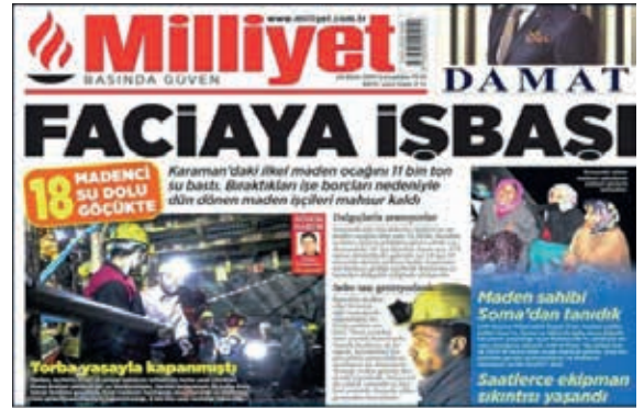
Şekil 13. 29 Ekim Tarihli Milliyet Gazetesi

Bu çalışmada, ülkemiz ve dünya madencilik tarihine ve meydana gelmiş önemli bazı maden kazalarına değinilmiştir. Metinde bahsedildiği gibi madencilikte karşılaşılan kitle ölümlerine sebebiyet veren kaza türleri grizu, kömür tozu patlaması, göçük oluşumu, ocak yangınları, su baskını ve şev kaymaları olarak ana başlıklar altında toplanabilir. Bu kaza türlerine bakıldığında ilk göze çarpan madencilik kazalarının, mesleğin şartlarına bağlı sebeplerden meydana geldiğidir. Bununla birlikte kazaların büyük çoğunluğunun yeraltı kömür ocaklarında meydana geldiği de dikkat çekmektedir. Bunun sebebi ise özellikle yer altı kömür madenciliğinin de diğer madencilik alanlarından ayrılan karakteristik özelliklerinin bulunmasıdır. Bu özelliklere örnek olarak kömürün metan içeriği, üretimi sırasında oluşan kömür tozu, tabakalı yapısından dolayı meydana gelen stabilite sorunları ve kimyasal yapısından kaynaklanan kendiliğinden yanma riski verilebilir. Bu parametreler kömür madenciliğini diğer madencilik faaliyetlerinden daha zor ve daha riskli hale getirmektedir. Bu noktada madencilik birçok sektörden ayrı olarak ve kendi içinde de üretilecek madenin cinsine ve üretim yöntemine göre farklı açılardan bakılması gerekmektedir.