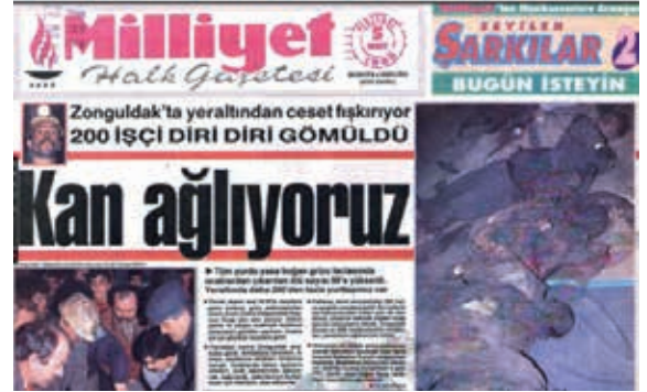
Şekil 9. 5 Mart 1992 Tarihli Milliyet Gazetesi

8 Eylül 2004 tarihinde Kastamonu'nun Küre İlçesi'nde Aşıköy yeraltı bakır işletmesinde meydana gelen yangın sonucunda biri maden mühendisi olmak üzere 19 kişi hayatını kaybetmiştir.