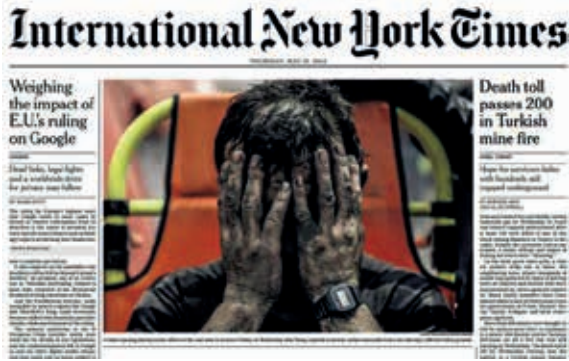
Şekil 12. 15 Mayıs 2014 Tarihli International New York Times Gazetesi

diği yerlerde karbon monoksit seviyesi çalışanları zehirleyecek oranlara ulaşmıştır. Saat 15:00 sularında olay fark edilmiştir. Olaya müdahale edilmeye çalışılsa da sorunun ciddiyeti arttığından dolayı komşu işletmelerden destek talep edilmiştir. Saat 17:00 sularında hava giriş tarafındaki çok sayıda işçi işletmeden dışarı çıkarılmıştır ve hava yönü ters çevrilmiştir. Bu arada ulusal kurtarma ekipleri işletmeye yönlendirilmiştir ve kurtarma çalışmaları sonucunda 5'i maden mühendisi olmak üzere 301 çalışanın cansız bedenlerine ulaşılmıştır (MMO, 2014). Olay tam vardiya değişimi sırasında meydana geldiğinden dolayı içeride 787 kişinin bulunduğu ve bu durumun can kaybının artmasına neden olduğu bilinmektedir. Maden Mühendisleri Odası'nın yayınladığı ön raporda ocağın havalandırmasının yeterli olmadığı ve işletme yönteminin de hatalı olduğu bildirilmektedir (MMO, 2014). Şekil 12'de 15 Mayıs 2014 tarihli International New York Times gazetesi görülmektedir.