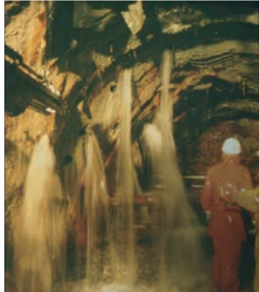
Şekil 4. Kaponig Tüneli'ndeki Su Baskını (Riedmueller ve Schubert, 2002).

Yeryüzü ve yerkabuğunun tabakalarındaki su varlığından dolayı, insanlar tarafından inşa edilen yeraltı boşluklarında ani su basma riskine karşı önlemler alınmalıdır. Çok büyük miktarlarda suyun maden işletmesini basması hem çok fazla can kaybına hem de kurtarma işini tehlikeli hale getiren ve zorlaştıran şartların oluşumuna neden olmaktadır (Mason, 1954). İşletmedeki su geliri tavan ve arın stabilitesini bozarak göçük olasılığını artırır (Arioğlu, 2010). Bu durum madencilik ve tünelcilik faaliyetlerini durma noktasına getirebildiği gibi gerekli önlemler alınmazsa büyük facialara da neden olabilmektedir. Şekil 4'te tünel içine dolan su görülmektedir.