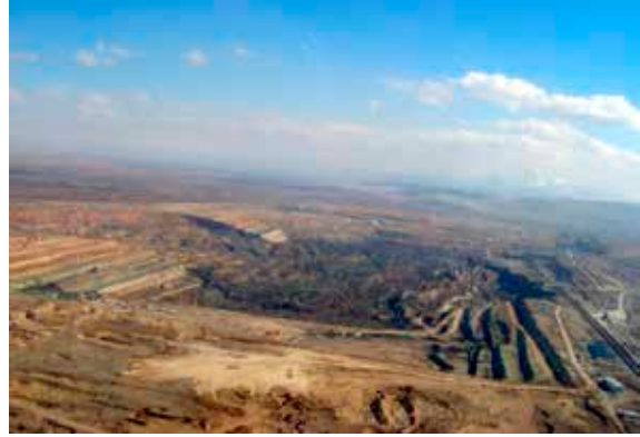
Şekil 11. Şev Kaymasının Ardından Açık İşletmenin Görüntüsü (Anon (k), 2015).

bilinen açık işletme metodunun kullanıldığı bir işletmede, bu denli büyük bir kazanın ortaya çıkması şaşırtıcıdır. İki kaymada toplam 75 milyon m 3 malzeme yer değiştirmiştir ve kazanın üzerinden 4 seneden daha fazla bir zaman geçmesine rağmen dokuz kişi hala kayan malzemenin altındadır. Şekil 11'de kayma gerçekleşen açık işletmenin görüntüsü bulunmaktadır. Yer değiştiren kütlelerin büyüklüğü resimde açıkça seçilebilmektedir.