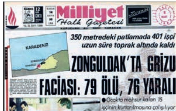
Şekil 8. 8 Mart 1983 Tarihli Milliyet Gazetesi

7 Mart 1983 tarihinde Zonguldak ilinin Ereğli ilçesine bağlı olan Türkiye Taşkömürü Kurumu tarafından işletilen yeraltı taşkömürü işletmesinde grizu patlaması meydana gelmiştir. Bu patlama sonucunda 103 kişi hayatını kaybetmiştir. Armutçuk kazası o tarihe kadar tarihimizde meydana gelen en büyük maden faciası olma özelliğini taşımaktaydı. Şekil 8'de kazanının ertesi gününde yayınlanan Milliyet gazetesinin ilk sayfası görülmektedir.