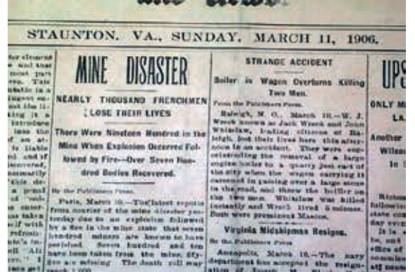
Şekil 6. Courrières Faciasından Bahseden Gazete Kupürü (Anon (c), 2015).

6 Aralık 1907 yılında Batı Virginia'da bulunan Monongah şehrindeki iki yeraltı kömür madeninde sabah saatlerinde bir patlama meydana gelmiştir. Her ne kadar patlama sonucunda çoğunu İtalyan göçmenlerin oluşturduğu 362 kişinin hayatını kaybettiği söylene de o dönemlerde madencilik firmalarının çalışan kayıtlarını düzgün bir şekilde tutmamasından dolayı ölü sayısının 500 civarında olabileceği tahmin edilmektedir. Kesin nedeni anlaşılmamasına rağmen uzmanlar metan ve kömür tozu patlamasının bu kazaya neden olduğundan bahsetmektedir. Bu kaza Amerika Birleşik Devletleri tarihindeki en büyük maden kazasıdır (Anon (d) ve (e), 2015). Şekil 7'de facia sonrasındaki gazete haberi görülmektedir.