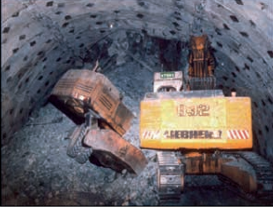
Şekil 3. Galgenberg Tüneli'nde Yaşanan Göçük (Riedmueller ve Schubert, 2002).