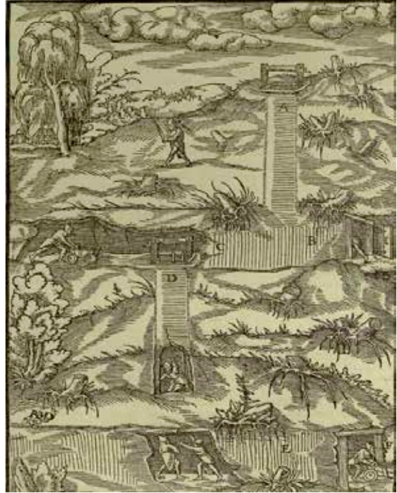
Şekil 2. Eski Zamanlarda Madencilik Çalışmaları (Agricola, 1912).

mahlasını kullanan George Bauer isimli bir Alman tarafından mesleğin geçmişine oranla görece olarak oldukça yakın bir tarihte 1556 yılında Latince olarak kaleme alınmıştır. Kitapta genel olarak madencilikten, rafinasyon ve döküm konularından bahsedilmektedir. De Re Metallica, 1912 yılında 31. Amerika Birleşik Devletleri Başkanı ve aynı zamanda maden mühendisi olan Herbert Hoover ve eşi Lou Henry Hoover tarafından İngilizce'ye çevrilmiştir. Eski dönemlerde ilkel yöntemler ile metal arayan ve madencilik çalışmaları yapan kişiler Agricola (1556) tarafından resmedildiği haliyle 1912 basımı bu çeviri kitabından alınarak Şekil 1 ve 2 de verilmiştir.