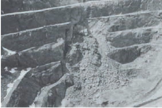
Şekil 5. Tipik Bir Şev Kayması (Kliche, 1999).

Şev, düzensiz ya da belirli bir geometriye ve yüzeye sahip yapılara verilen isimdir. Açık işletme madenciliğinin güvenli olarak yapılabilmesinin yegane yolu şev stabilitesinin sağlanmasından geçmektedir. Şev stabilitesi, şevin yerini ve konumunu koruyabilmesi durumudur. Şevin kayması ise kayan kütlelerin sınırları boyunca gelişen bir makaslama yenilmesine bağlı olarak şevi oluşturan malzemenin aşağı yöndeki hareketidir. Şev kaymalarının nedenleri, dış kuvvetler (sismik aktivite vb.), gözenek suyu basıncındaki artış, makaslama dayanımındaki azalma, şevdeki gerilim durumunun değişmesi, aşınma ve ayrışma gibi sebeplerdir (Ulusay, 2001). Şekil 5'te açık işletmedeki bir şev kayması görülmektedir.