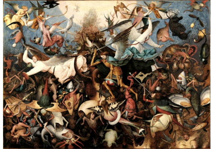
Görsel 8. Pieter Bruegel, "İsyankâr Meleklerin Düşüşü", 1562, Yağlı boya

Rönesans ressamlarından Pieter Bruegel'in grotesk resimlerinden "İsyankâr meleklerin düşüşü" eserinde birçok acayip, korkunç şeytani yaratığın sanatçı tarafından bitki, hayvan ve insan karışımı melezi bir tür oluşturduğuna tanık olmaktadır (Görsel 8).