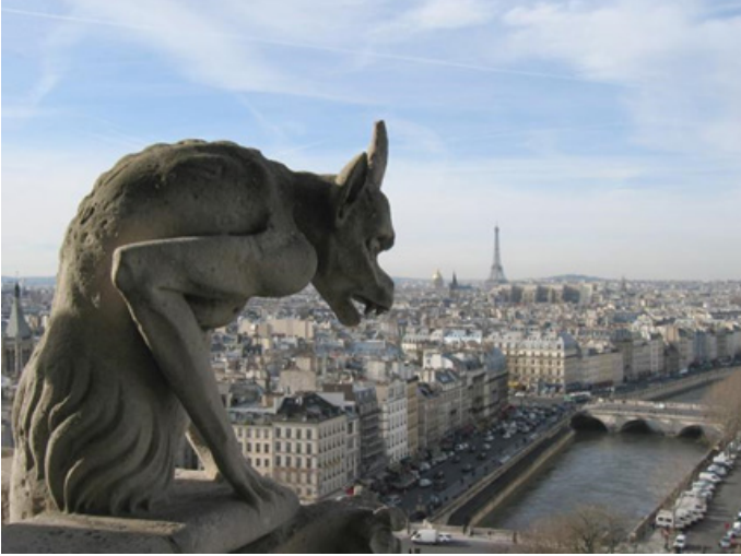
Görsel 2. "Kimeras," Notre Dame Katedrali

lenmiştir. Katedralin en üst noktalarına yerleştirilen ve yukarıdan aşağı doğru bakan kimeralar, kimilerine göre günahları yok eden ve şeytanları kovan bir yaratıkken, bazılarına göre çirkin bedenlerde kötünün temsili olarak da yorumlanmıştır (Görsel 2). Orta Çağ sanatçısına sınırsız bir tasarım özgürlüğü sunan katedraldeki kimeralardan en göze çarpanı, yapının kuzey cephesinde bulunan, Viollet-le-Duc tarafından yapılan Paris'i seyrederken, ellerini düşünceli bir şekilde çenesine dayamış, dili dışarı çıkmış boynuzlu, kanatlı şeytan tasviridir (Görsel 3).