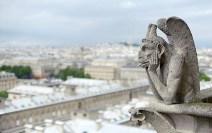
Görsel 3. "Kimeras," Notre Dame Katedrali

Camille (2009), taş formlara sahip olan kimeraların bazı sanatçıların eserlerine konu olduğunu belirtmiştir. 19. yüzyıl baskı ustası Charles Méryon'un baskı resimlerinde (Görsel 4), çizimlerinde ve Henri Le Secq'in fotoğraflarında görselleşen kimeralar izleyicinin onları daha yakından tanımalarına olanak tanıdı (Görsel 5). Bu fantastik yaratıkların birden fazla cinsel niteliklere sahip olduğu düşünülmektedir. Kimeralar cinsiyet değiştirip çağının ötesine giderek toplumsal cinsiyet sorunlarını yansıtır, korku uyandıran dışı avcı, fahişeyi ve hatta cinsel tersliğin temsili haline gelmişlerdir. Bu canavarların minyatürleştirilmiş, evcilleştirilmiş oyuncaklar olarak başlayan serüvenleri sanal ve küresel hayaletlerin gelecekte Gotik'in koruyucuları haline geldiği internetle doruğa ulaşan kültürümüzde, serbest bırakılma ve metalaştırılma yolları ortaya çıkmıştır.