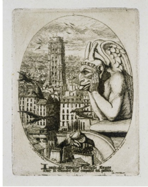
Görsel 4. Charles Méryon, 1853, Baskı Resim

Camille (2009), taş formlara sahip olan kimeraların bazı sanatçıların eserlerine konu olduğunu belirtmiştir. 19. yüzyıl baskı ustası Charles Méryon'un baskı resimlerinde (Görsel 4), çizimlerinde ve Henri Le Secq'in fotoğraflarında görselleşen kimeralar izleyicinin onları daha yakından tanımalarına olanak tanıdı (Görsel 5). Bu fantastik yaratıkların birden fazla cinsel niteliklere sahip olduğu düşünülmektedir. Kimeralar cinsiyet değiştirip çağının ötesine giderek toplumsal cinsiyet sorunlarını yansıtır, korku uyandıran dışı avcı, fahişeyi ve hatta cinsel tersliğin temsili haline gelmişlerdir. Bu canavarların minyatürleştirilmiş, evcilleştirilmiş oyuncaklar olarak başlayan serüvenleri sanal ve küresel hayaletlerin gelecekte Gotik'in koruyucuları haline geldiği internetle doruğa ulaşan kültürümüzde, serbest bırakılma ve metalaştırılma yolları ortaya çıkmıştır.