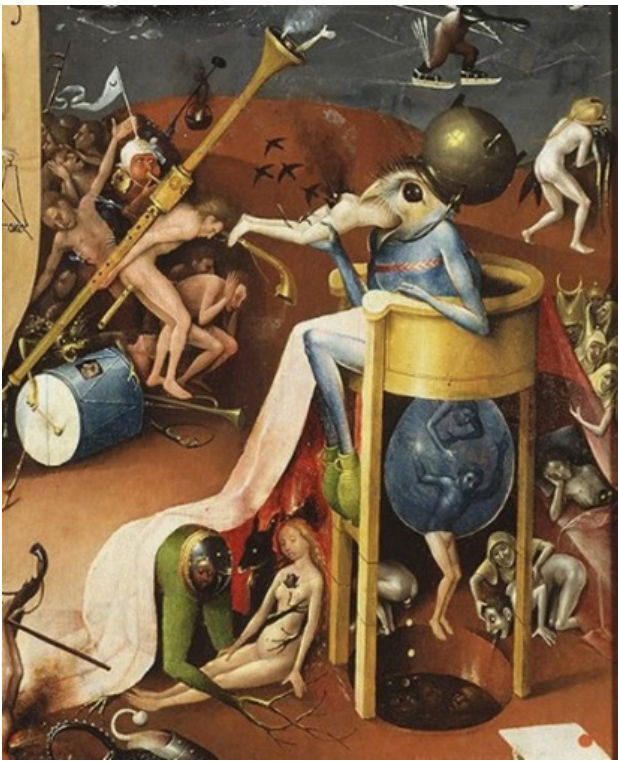
Görsel 7. Hieronymus Bosch, "Cehennem Prensi"

Rönesans ressamlarından Pieter Bruegel'in grotesk resimlerinden "İsyankâr meleklerin düşüşü" eserinde birçok acayip, korkunç şeytani yaratığın sanatçı tarafından bitki, hayvan ve insan karışımı melezi bir tür oluşturduğuna tanık olmaktadır (Görsel 8).