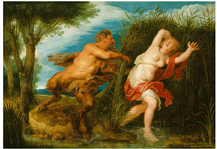
Görsel 9. Peter Paul Rubens, "Pan and Syrinx", Yağlı boya, 1620