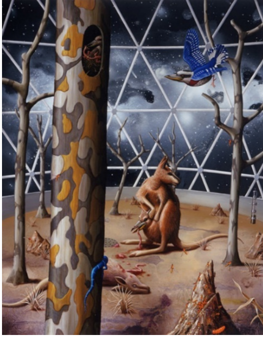
Görsel 14. Alexis Rockman, "Biyosfer Avustralya", Ahşap üzerine yağlı boya, 1993