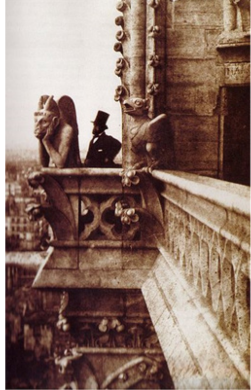
Görsel 5. Henri Le Secq 1853, Fotoğraf

Kimeraların Orta Çağ'da sanatçılara sınırsız bir hayal gücü sunmasının ardından Rönesans, Barok veya Romantik dönemde de çeşitli kılıklara bürünerek karşımıza çıktıkları görülmektedir. Hieronymus Bosch'un triptik eseri "Dünyevi zevkler bahçesi" üç bölümden oluşmaktadır (Görsel 6). Yapıtın sol paneli Âdem ve Havva'nın cennetteki tasvirlerini içerirken orta panelde çıplak insanların