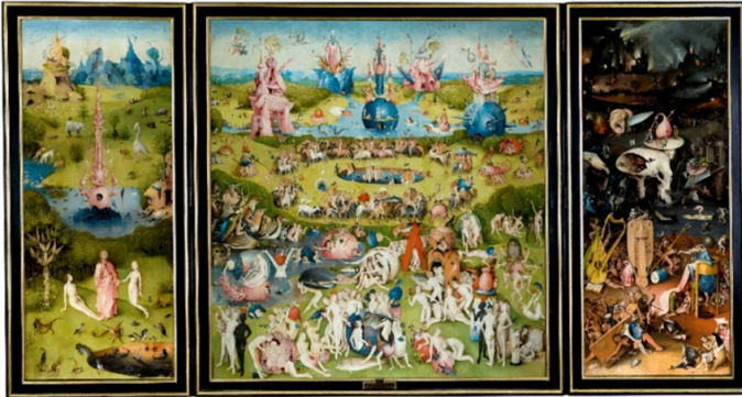
Görsel 6. Hieronymus Bosch, "Dünyevi Zevkler Bahçesi", 1503-1504, Ahşap üzerine yağlı boya

betimlendiği, dünyevi zevklerin şehvetiyle vecd olma halinde insanların yorumlandığı bir dünya sunulmuştur. Sağ panelde ise ürkütücü varlıkların olduğu cehennem sahnesinde birçok sürreal görüntüyle karşılaşmaktayız. Bu panelin tiksindiren ve ürküten yaratıklarının en önemlisi kuşkusuz, kafasında bir kazan olan cehennem prensidir (Görsel 7). Kimera olarak nitelendirebileceğimiz bu yaratık farklı canlıların niteliklerini bir bedende taşımaktadır.