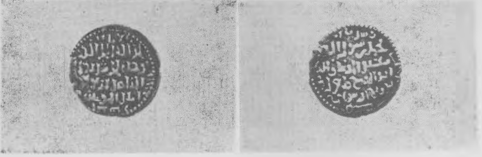
Muğis el - Din Tuğrul Gümüş sikke