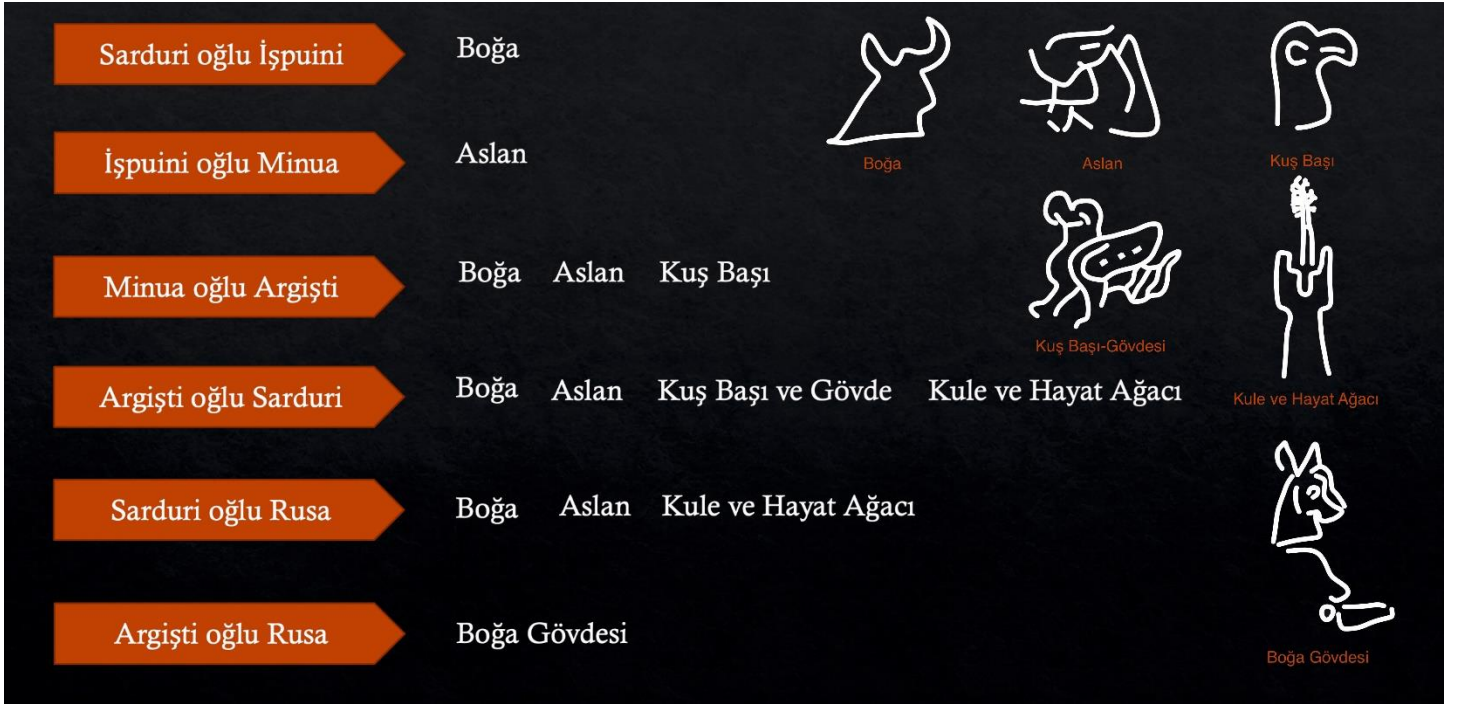
Figür 1: Yazıtlı Tunç Eserlere Göre Piktogramların Dağılımı.