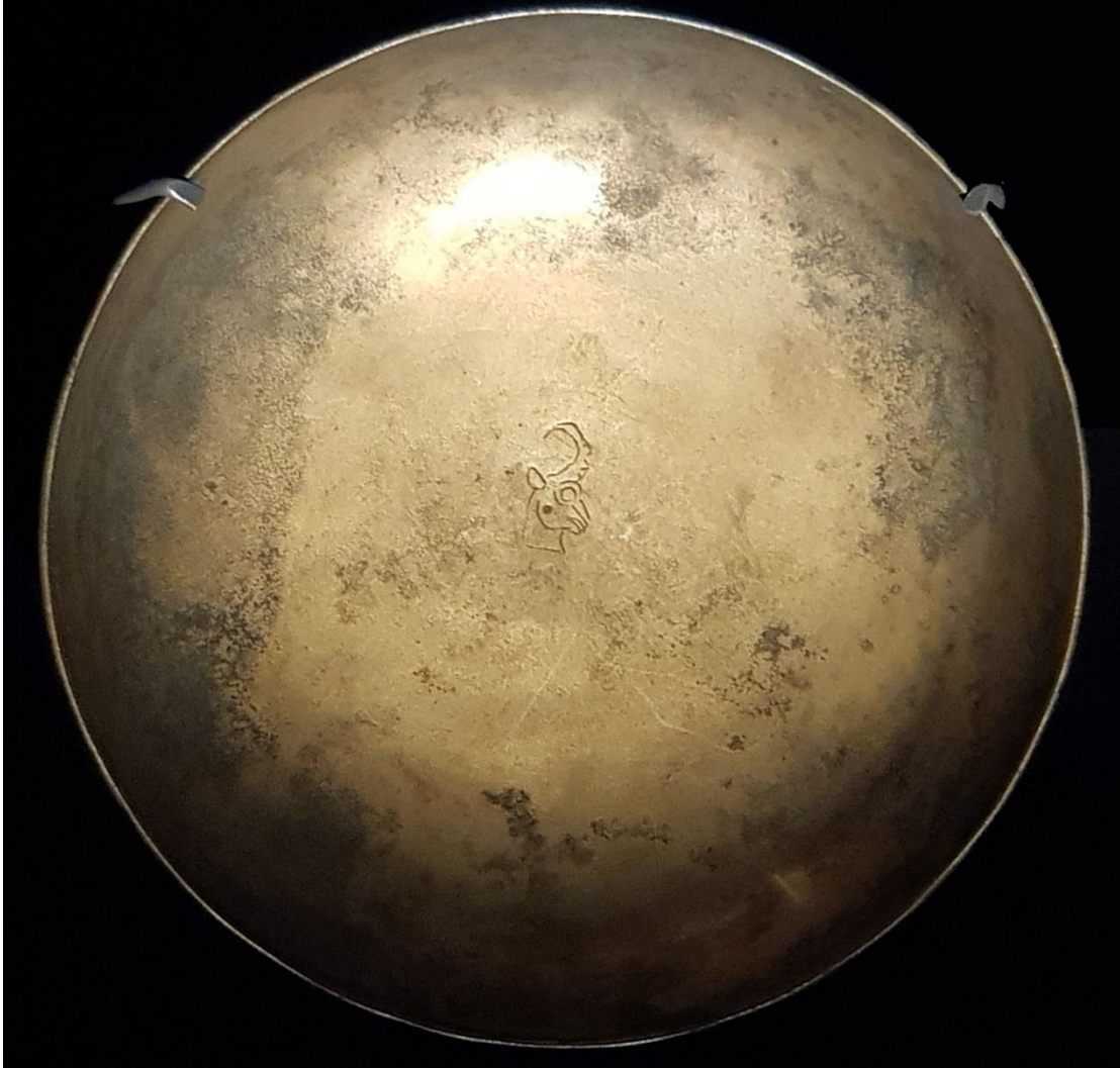
Figür 4: Boğa Başı Piktograma Sahip Tunç Kâse (Van Müzesi).