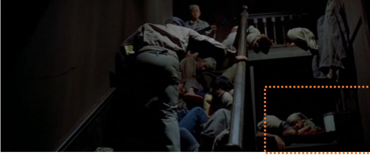
Şekil 6. Roth ve Thorn'un oturdukları yapının merdiveni, Soylent Green (Fleischer, 1973).

bir metafor sunmaktadır. Burada fiziksel-psikolojik anlamda mahremiyet olanakları oldukça sınırlıdır. Tüm bunların yanında, mahremiyet anlayışının toplumun yaşam biçimine ve komünal özelliklerine göre şekillendiği söylenebilir.