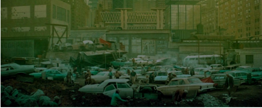
Şekil 3. Şehir görüntüsü, Soylent Green (Fleischer, 1973).

Kentsel çevrenin kelimelere kolayca dökülemeyen bazı temel özellikleri olduğunu söyleyen Lynch (2015), mekân örüntüsünün görünür biçimine dikkat çekmektedir. Lynch (2015), kentin biçiminin insanların kenti kendilerine tutarlı bir şekilde temsil etme becerilerini nasıl etkilediğini araştırmış; açıklık, basitlik ve görünür formun baskınlığı gibi değişkenlerin bazılarının, bir şehir unsurunun akılda kalıcılığını belirlemede ilk başta görüldüğünden daha önemli olduğuna dair kanıtlar ortaya çıkarmıştır. Bu bağlamda kalabalık bir kurguda kent imgesinin ve diğer unsurların geçici olarak bellekte yer alabileceği düşünülebilir. Bu bağlamda, filmin mekânları içinde semtlerin, caddelerin ya da binaların sembolize ettiği göreceli sosyal değerlerin (Şekil 3) yanında insan-çevre etkileşiminde yapıların kişisel kontrolü azaltan kalabalık deneyimlere dahil olması en az insan-insan etkileşimi kadar önemli olmaktadır.