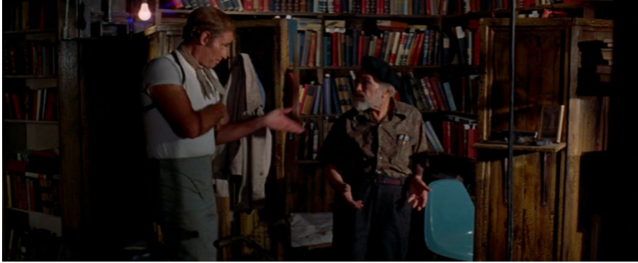
Şekil 4. Roth ve Thorn'un yaşam alanı içinde tanımlanmış, Roth'un çalışma alanı, Soylent Green (Fleischer, 1973).

Genel olarak alansallık , mekanizmanın veya grupların kendilerini fiziksel bir alanın sahibi olarak algılamalarına dayanan bir dizi davranıştır: Bu davranışlar mekanizma için önemli itkilere ve ihtiyaçlara hizmet ederler ve bir alanın işgal edilmesini, kişiselleştirilmesini ve korunmasını içerirler (Bell, Fisher ve Loomis, 1978; Edney, 1976'dan akt. Göregenli, 2021, s. 131). Tüm çevresel alan, her biri içinde meydana gelen davranışı değişen derecelerde belirleyen eylem bölgelerine veya ortamlarına bölünmüş olarak düşünülebilir (Tolman, 1951; Barker ve Wright, 1955; Goffman, 1959; Goffman, 1963; Hall, 1969; Carr, 1970, s. 10).