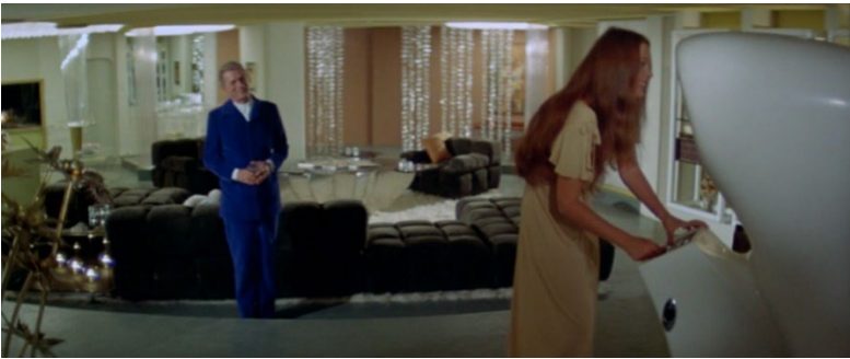
Şekil 7. Chelsea West apartmanı dairesi, Soylent Green (Fleischer, 1973).

Westin (1970), modern toplumların, bireysellik ve mahremiyetin sağlanmasına karşı bir gelişimi de beraberinde getirdiğine vurgu yapmaktadır (s. 22). Nüfusun kalabalıklaşması ve yoğunlaşması ile yaygın bürokratik kurumsal yaşam, modern insanı ortaya çıkarmıştır. Modern toplumlarda aileler, bireyler ve gruplar için arzu edilen düzeyde mahremiyetin sağlanması bir zorunluluk ürünü olmaktan ziyade bir özgürlük sorunu haline dönüşmüştür (Göregenli, 2021). Filmde dış kabuğun iç kabuktan ayrılması da bu özgürlük sorununun bir sonucudur. Yüksek güvenlikli Chelsea West apartmanlarında (Şekil 7) yaşayan zenginlerin dış kabuktan bağımsız mahremiyet düzenleriyle ve dayatılan toplumsal ilişkilerden yalıtılmışlıklarıyla bir anlamda kendi özgürlük tanımlarını oluşturmaktadır.