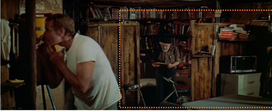
Şekil 1. Roth ve Thorn'un yaşam alanında, Soylent Green (Fleischer, 1973).

mahremiyet seviyeleri arasında bir denge sağlamak üzere tasarlanmış sınır düzenleme mekanizmaları şeklinde ifade etmektedir. Hall (1969) kişisel alanı bir iletişim biçimi olarak tanımlamış ve kişilerarası mesafenin ilişkisinin niteliğini ve niceliğini belirlediğini ileri sürmüştür.