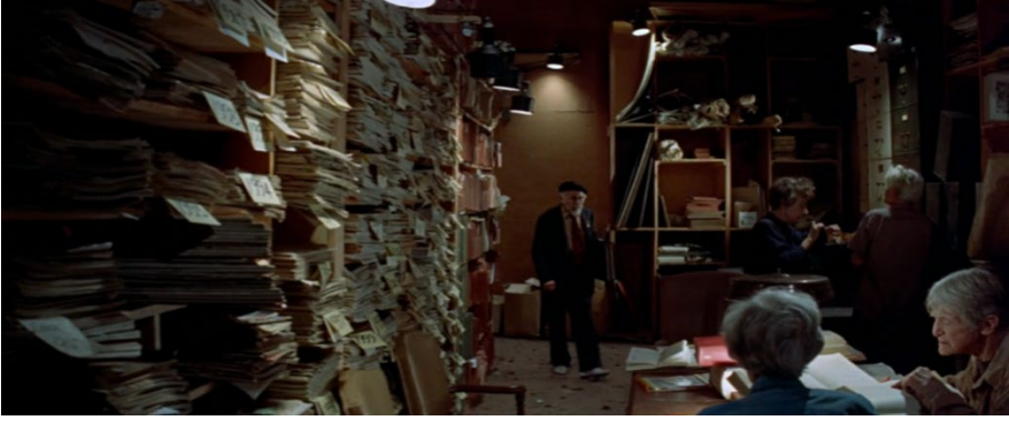
Şekil 5. Şehir kütüphanesi, Soyilent Green (Fleischer, 1973).

yoğunluğun davranışsal kısıtlamaları, aşırı uyarım yüklemesini yani mahremiyetin azalmasını, aşırı manipülasyonu ve kişisel alan ve dolayısıyla alansallık ihlalinin kaynaklanan olumsuz uyarılmayı teşvik ederek durumların kalitesini zaman zaman bağımsız olarak bozabileceğini öne sürmektedir (Stokols, 1978, s. 272). Bunun yanında Şekil 5'te de görüleceği üzere, kullanıcıların ortamdaki davranışları içerisinde sosyal-örgütsel işlevlerini şekillendiren bir nedenin nesne yoğunluğu olduğu ve dolayısıyla bölgesel baskınlıkların da işlevsel alanları tanımlayan unsurlar olduğu söylenebilir.