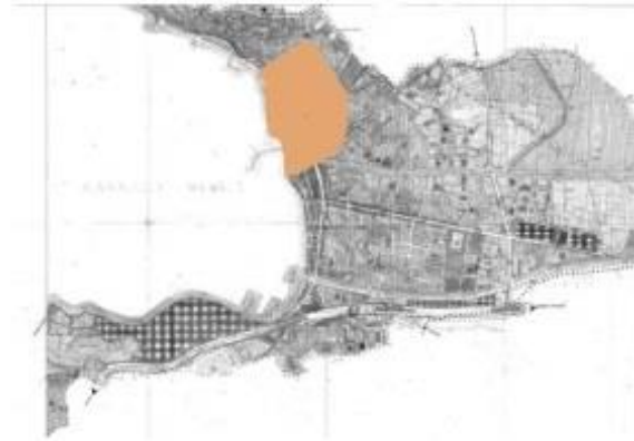
ESKİ GEMLİK TARİHİ YERLEŞİM PLANI