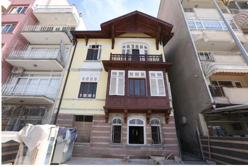
Şekil 8: Yalı Konak ve Çevresindeki Doku

( http://projeler.bursa.bel.tr/gemlik-yali-konagi-restorasyonu.html , erişim tarihi: 01.08.2017)