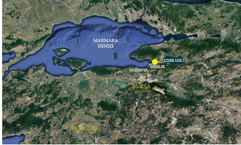
Şekil 1: Gemlik İlçesi Konumu ( https://earth.google.com , erişim tarihi: 01.08.2017)

edilmiştir. Bizans döneminde de önemli bir liman, zeytincilik ve ipekböcekçiliği merkezi konumuna gelen Kios o dönemde denizcilik faaliyetleri açısından güçsüz bulunan Anadolu Selçuklu Devleti tarafından İstanbul’u denizden kuşatmak amacıyla 1087 yılında alınır. Haçlı seferleri sırasında da denizcilik üssü olarak kullanılan Gemlik için, Osmanlı Devleti egemenliğindeki tarihsel sürecinde yeni tersaneler inşa ettirilmiş ve körfezde denizcilik faaliyetleri devam etmiştir. Coğrafi konumunun getirdiği avantajları tarih sahnesinde farklı imparatorlukların egemenliği altında geçiren Gemlik, her dönemden ayrı etkilenmiş ve mekansal gelişimiyle günümüzde de önemli yer tutmaya devam etmektedir.