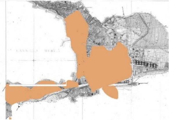
1970-2000 YILLARI GEMLİK YERLEŞİM PLANI