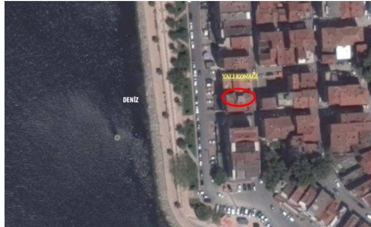
Şekil 7: Yalı Konak ve Kıyı Konumu ( https://earth.google.com , erişim tarihi: 01.08.2017)

Kıyı mimari kimliğinin sürdürülebilir olmasını sağlayan çalışmalardan biri de; kıyıda bulunan Yalı Konak örneğidir. 1910 yılında Rum bir tüccar tarafından yaptırılmış olan ahşap ev; bodrum, zemin, 2 normal kat ve çatı katından oluşmaktadır. Yapı, hem konut olarak hem de ticaretle uğraşan ailenin zeytin depolama alanı olarak kullanılmıştır. Sahile yakın olması, gemilere kolay ulaşılması ve yükleme yapılması da yapının konumunun avantajıdır (Şekil 7). 2014 yılında restore edilmeye başlanan ve 2017’de çalışmaları tamamlanan Yalı Konak, kıyı mimarisinin sürdürülebilir olduğunun önemli örneklerindedir. 1910’lu yıllara ait, Helenistik izler taşıyan bu sivil mimari yapı; kıyı kimliğinin mimariye yansımış halidir. İç mekanların kullanım amacına uygun tasarlanması, depo olarak kullanılacak alanların ve konut alanlarının birlikte çözülmesi, iki farklı girişinin bulunması o dönemin mimari yapılarıyla ilgili fikir vermektedir.