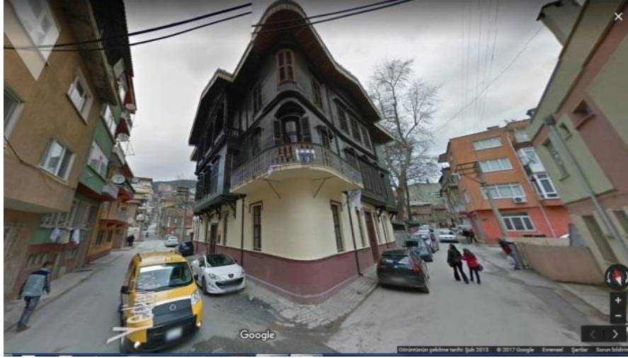
Şekil 6: Tarihi Paşa Konağı ve Çevresi

Kıyı mimari kimliğinin sürdürülebilir olmasını sağlayan çalışmalardan biri de; kıyıda bulunan Yalı Konak örneğidir. 1910 yılında Rum bir tüccar tarafından yaptırılmış olan ahşap ev; bodrum, zemin, 2 normal kat ve çatı katından oluşmaktadır. Yapı, hem konut olarak hem de ticaretle uğraşan ailenin zeytin depolama alanı olarak kullanılmıştır. Sahile yakın olması, gemilere kolay ulaşılması ve yükleme yapılması da yapının konumunun avantajıdır (Şekil 7). 2014 yılında restore edilmeye başlanan ve 2017’de çalışmaları tamamlanan Yalı Konak, kıyı mimarisinin sürdürülebilir olduğunun önemli örneklerindedir. 1910’lu yıllara ait, Helenistik izler taşıyan bu sivil mimari yapı; kıyı kimliğinin mimariye yansımış halidir. İç mekanların kullanım amacına uygun tasarlanması, depo olarak kullanılacak alanların ve konut alanlarının birlikte çözülmesi, iki farklı girişinin bulunması o dönemin mimari yapılarıyla ilgili fikir vermektedir.