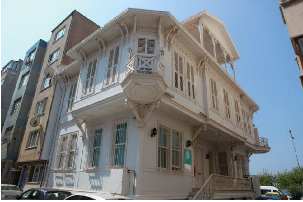
Şekil 9: Gemlik Daniş Ekim Öğretmenevi ve çevresindeki doku ( http://gemlikdanisekimogretmenevi.meb.k12.tr , erişim tarihi: 29.10.2017)