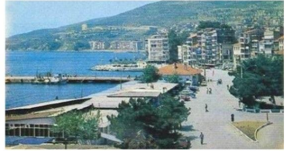
1985-2000 YILLARI GEMLİK SİLÜETİ