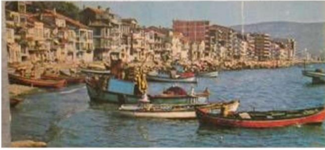
1970-1980 YILLARI GEMLİK SİLÜETİ

Kıyı silüetinde büyük bir değişim olmazken, kent kıyıdan oldukça iç kısımlara doğru yayılma eğilimi göstermiştir. Kıyı boyunca ise 2-3 katlı ahşap yapılar, hemen hemen hepsi aynı gabariye sahip kırma çatıları ile kıyıya paralel devam etmektedir (Şekil 3). 1970'lerde kentin kıyı silüetinde yüksek katlı yapılaşma görülmeye başlanmış ve kıyı silüetinde gabari anlamında bir dengesizlik oluşmuştur. Bu durum ile birlikte; tarihi ahşap yapıların devamında yükselen 5-6 katlı betonarme binalar; mimari doku olarak birbiriyle bütünleşememiş yapı stokları meydana getirmiştir.