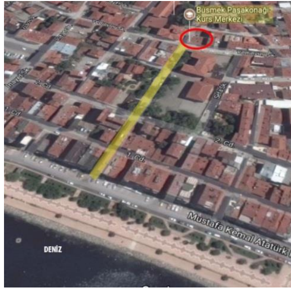
Şekil 5: Tarihi Paşa Konağı'nın Konumu ( https://earth.google.com , erişim tarihi: 01.08.2017)

Gemlik sahilinden yaklaşık 200 m. içeride bulunan Paşa Konağı, sürdürülebilirlik stratejilerinin bir parçası olarak dönüşüm geçiren, 1800'lü dönemlere ait önemli bir sivil mimari örneğidir (Şekil 5). Rumlara ait bir papazhane olan, 3 katlı ahşap yapının tek katı yaklaşık 450 metrekaredir.