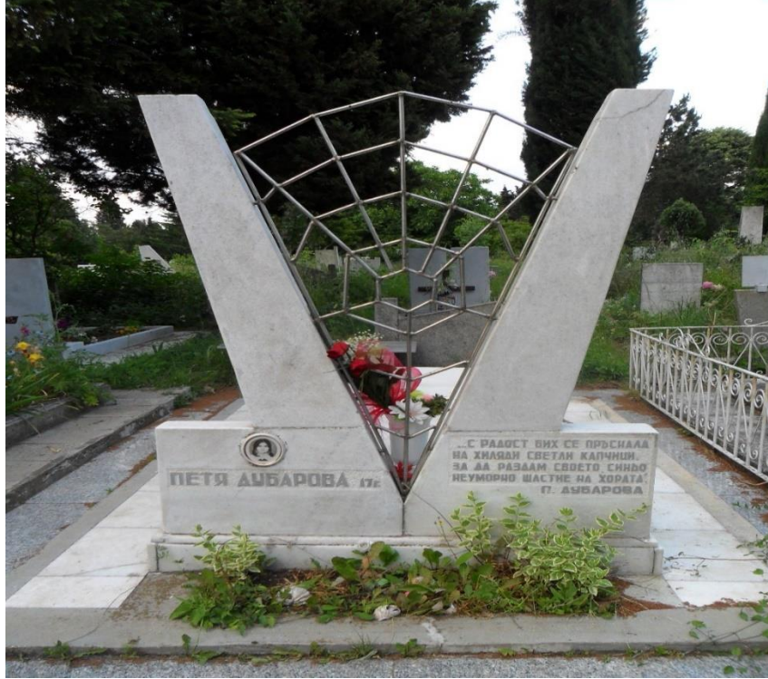
Resim 5: Burgaz kentinde yer alan Petya Dubarova'nın mezarı 28

Derin yaşam ikilemleri, güven ile güvensizlikler, başarı ve başarısızlıklar, mutluluk ile mutsuzluklar, baskılar ve özgürlükler arasındaki gelgitler Petya'yı yaşam boyu düşündürecek ve ölümüne kadar takip edecektir. Yazar bir yandan körlük ve karanlık içinde yaşamak istiyor, diğer yandan da aydınlık ve özgürlük onu ürkütüyor. Bir yandan iyi ve mutlu insanların olduğuna inanıyor, diğer yandan da mutlu insanların dahi talihsiz olduklarını görüyor. Müthiş bir çıkmaz, çözümü olmayan bir ikilem, yanıt bulamamış felsefi sorular ve tüm bunlar 17 yaşındaki genç bir kızın daima meşgul olan kafasında. Yanıtsız sorular, bitmeyen arayışlar, felsefi sorgulamalar ve çıkmaza götüren ikilemler Petya'nın intihar etmesinin bir başka nedeni olabilir.