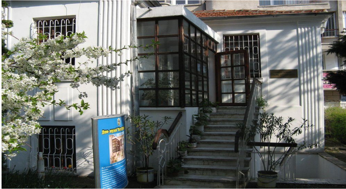
Resim 6: Burgas kentindeki Petya Dubarova Ev Müzesi giriş bölümü 31

Sıradan Bulgar yurttaşlarının yazmış oldukları bu duygu dolu kısa metinler, hem geniş halk kitlelerinin genç şaire olan sevgisini ve saygısını yansıtmakta hem de daha yüzlerce yıl boyunca bu sıra dışı edebiyatçının konuşulacağını, anılacağını ve tartışılacağını göstermektedir.