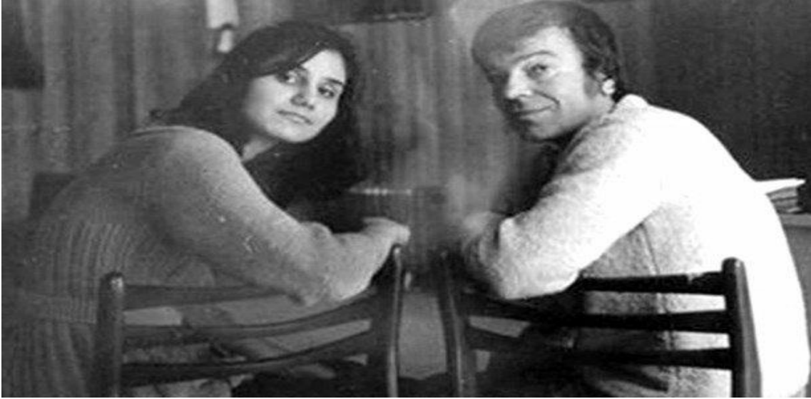
Resim 2: Ünlü şair Hristo Fotev ve Petya Dubarova birlikte poz vermişler 4

Burgazlı ünlü şair Hristo Fotev, Petya'nın yeteneğini keşfeden ilk kişilerden biri olarak kabul edilmektedir. Hristo Fotev'in hocalık yaptığı bir edebiyat kulübüne küçük Petya da katılmış ve etkin görev almıştır. Daha o zaman usta ozan Fotev, sıra dışı bir kızla çalıştığını fark etmiş, Petya'nın etrafındaki dünyaya yönelik farklı bakış açılarını ve eleştirel gözlemlerini hemen hissetmiştir. Onun küçük yüreğindeki fırtınaları ve çocuk yaşta olmasına karşın yetişkinlerden daha çok duyarlı olduğunu ilk o keşfetmiştir. Özverili ve sistemli çalışmalara bir de çocuğun sıra dışı yeteneği eklenince ilk yazınsal meyveler de ortaya çıkmaya başlamıştır. Çocukluk dönemindeki Petya'nın en büyük özelliklerinden birisi yılmadan, sıkılmadan, yorulmadan ve bitkinlik hissetmeden bir gün içinde çok sayıda şiir yazmasıdır. Kimi zaman günde 5-6 şiir yazdığı olmuştur. Şiir dilini ustalıkla kullanışı ve sözcüklere adeta onlarla dans edermişçesine egemen olması okurları hayrete düşürmüştür.