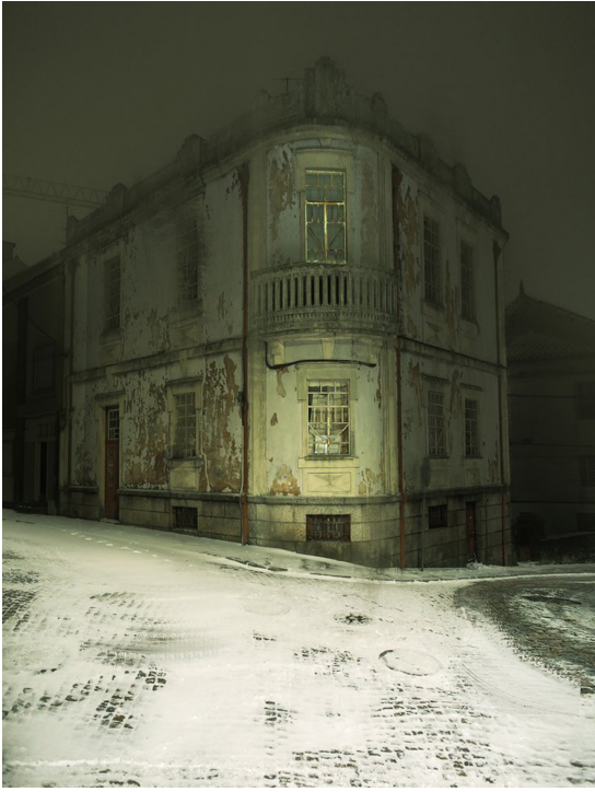
Resim 7. Henri Prestes. Kasabanın Kıyısında (At The Edge of Town).

https://henriprestesp.com/upcoming/9g0qiklwk-m71o8hwcxjedjfb9zrnn7 .