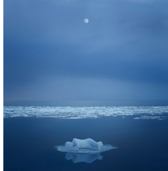
Resim 8. Gabriel Isak. Işığa Doğru (Into The Light). 2020.

Resim 8'de yer alan "Mavi" serisinden "Işığa doğru" (Into The Light) isimli bu fotoğrafın atmosferi, bir rüya, gerçeküstü dünya hissi yaratıyor; her yer mavi ve buzlarla kaplı deniz. Deniz dingin ve gökyüzünün maviliğinde dolunay var. Bembeyaz buzun üstünde yatan insan figürünün, izolasyon ve yalnızlık duygusunu temsil ettiği düşünülebilir. İnsan figürü, çevresindeki dingin denizin ortasında küçük, savunmasız ve yalnız bir varlık gibi görünüyor. Fotoğraf estetik açıdan güzel ve izleyiciye dingin bir deneyim sunuyor gözüküyorsa da onun bu fotoğrafı diğerlerinin çoğunda olduğu gibi kişisel derinliklerdeki kaosu dingin görünümü gibidir; başka bir ifadeyle dinginliğin içindeki çılgınlıktır.