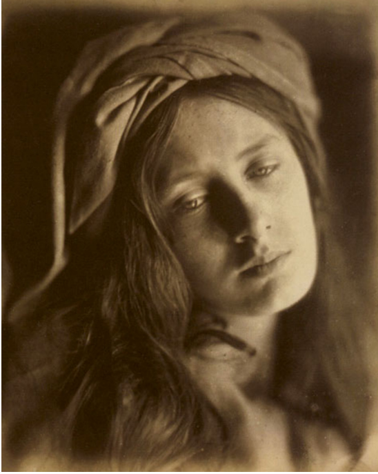
Resim 2. Julia Margaret Cameron. Beatrice. 1866. https://commons.wikimedia.org/wiki/File:Julia_Margaret_Cameron-Beatrice.jpg .

olması ve yanal ışık içsel yalnızlığı da akla getirmektedir. Cameron bu fotoğrafı doğal bir anda çekmiş olabilir. Onun doğal ve içsel anlara odaklanması, melankolinin estetik bir şekilde ifade edilmesine katkıda bulunduğu söylenebilir. Fotoğraflanan anın doğallığı ve içtenliği, izleyiciye duygusal bir bağ kurma fırsatı sunar.