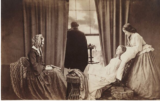
Resim 1. Henri Peach Robinson. Solup Gitmek (Fading Away). 1858.

negatiften oluşturulmuş ve bir genç kızın hastalıkla boğuştuğu ve yaşam gücünün azaldığı melankolik bir sahneyi gösteren kompozit bir çalışmadır (2000, :126). Bu eser, Victorian dönemindeki fotoğrafçılık anlayışını ve estetik tercihleri yansıtan önemli bir örnektir.