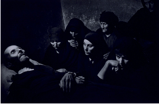
Resim 4. W. Eugene Smith. İspanyol Uyanışı (Spanish Wake). 1951.

karedir. Fotoğraflarındaki duygusal atmosfer için kendi ifadesi oldukça kıymetlidir: “Hiçbir zaman iyi ya da kötü hiçbir fotoğrafı duygusal kargaşa içinde bedelini ödemedim yapmadım” (W. Eugene Smith Memorial Fund, 2023).