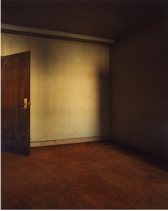
Resim 6. Todd Hido, İç Mekanlar (Interiors #4042-B), 1996. http://www.toddhido.com/interiors .

Portekizli günümüz genç fotoğraf sanatçılarından Henri Prestes, fotoğraflarındaki melankoli, hüzün ve yalnızlık gibi duygusal temaları yansıtan gece ya da az ışıklı sahneleriyle tanınır. Prestes'in çalışmaları hafızanın geçici doğası üzerine kuruludur. Fotoğraflarını çektiği eski binalarda, terk edilmiş mekanlarda, bomboş sokaklarda, puslu ağaçlıklarda, ormanlarda, ıssız banliyölerde, çoğunlukla belirsiz ve gölgeli figürler zamansız bir görüntü oluşturur. Çalışmalarının çoğu izleyiciye yalnızlık, yabancılaşma ve nostalji duygularını aktarır. Ama bir taraftan da sinemadaki suç ve karanlık atmosferler barındıran, gizem ve tehlike dolu korku öğeleriyle bezenmiş “neo-noir” estetik yaklaşımları çağırıştırır. Tüm bunlar güzel ve dingin görüntü içinde oluşur. Prestes'in estetik kaygıyla kurguladığı kad-