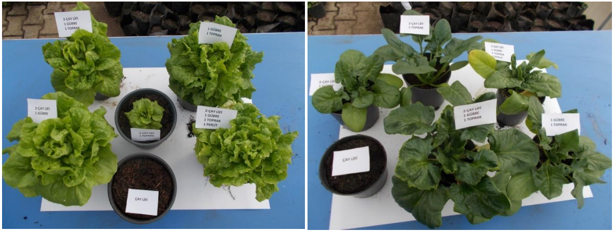
Ek 3. Farklı ortamlarda yetiştirilen ıspanak ve marul bitkileri.