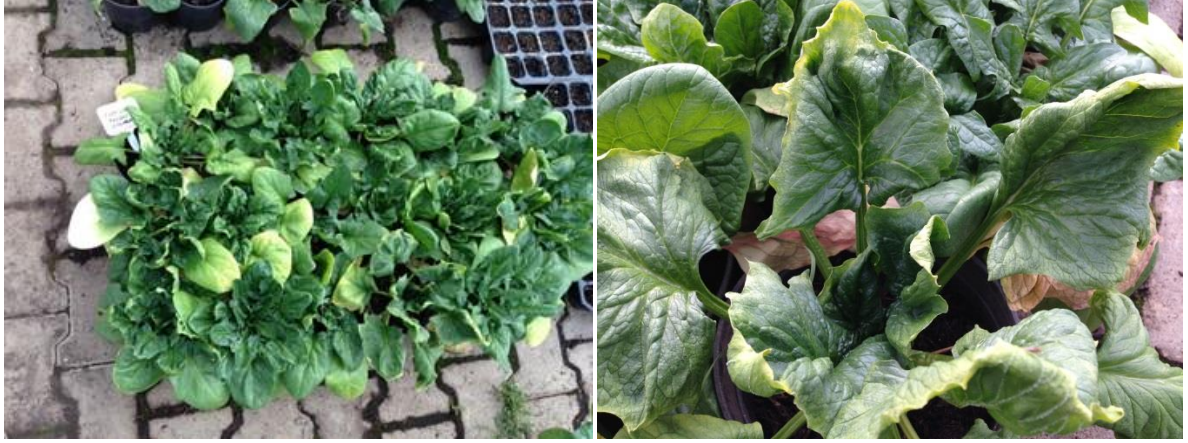
Ek 2. ıspanakta ÇGT ortamında yaprak uçlarında görülen kıvrılma ve yanmalar.