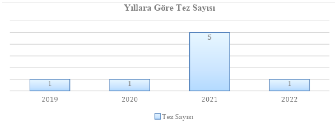
Grafik 1: Yıllara Göre Tez Sayısı

Daha önce de belirttiğimiz gibi 2018 yılında Konya’da yapılan “Gençlik ve İnanç” konulu çalıştayın sonuç bildirisinde değerlendirilen deizm konusu akabinde Türkiye kamuoyunda da sıklıkla ele alınan bir tartışma konusu olmuştur. Görüldüğü üzere, din sosyolojisi araştırmacıları da müteakip yıllarda bahsi geçen konuyu lisansüstü tez araştırması olarak incelemişlerdir. 2021 yılı itibarıyla din sosyolojisi alanında yapılan deizm konulu lisansüstü çalışmaların önemli boyutlara ulaştığı anlaşılmaktadır.