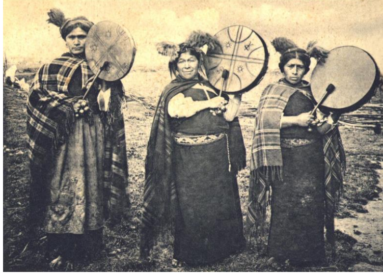
Fotoęraf 1. "Kultrun" alan Mapue Őamanlar (1900'den Bir Fotoęraf, Carrereñi Sector, Chol-chol) 12

Mapue halkının geleneksel kltrnde machi, dnyanın doęal dengesine karşı aşırı gçlerin olumsuz etkisinden kaynaklanan hem fiziksel hem de ruhsal nitelikteki rahatsızlıkları (saęlık aracıdır) iyileştirme rolne sahiptir. Buna ek olarak, machi, atalarının topraklarında hl var olan Mapue topluluklarında bir tren lideri ve atalara ait inan ve uygulamaların ana taşıyıcısı olarak bilinmektedir.