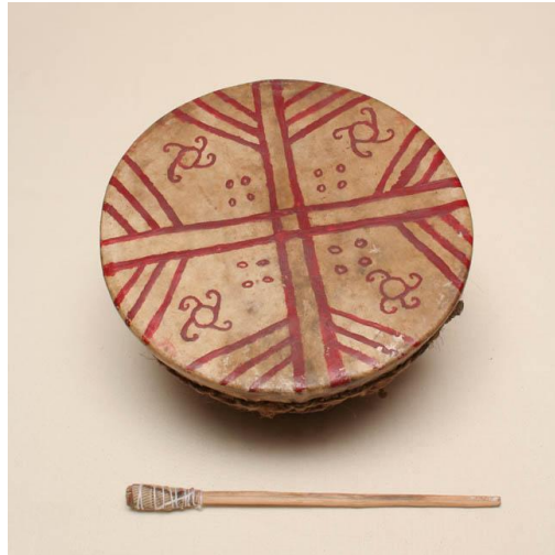
Resim 1. Mapuçe Kultrunu 20

Davul, Mapuçeler tarafından kultrun olarak bilinmektedir. Bu davul, Mapuçe mitolojisinde ve özellikle insanların dünyadaki varlığının kökeni hakkındaki efsanelerde büyük önem taşımaktadır. “Dünya ve insanlık doğduğunda, Mapuçe kultrunu o zamandan beri var oldu ve ilk machi onu sundu” denmektedir, bu nedenle bu temel Mapuçe unsurunun dünyanın yaratılışından beri var olduğuna inanılmaktadır (Grebe, 1973: 32).