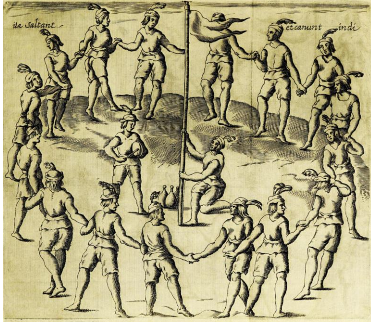
Resim 3. Őili Krallıđı'nın Tarihsel İliřkisinde Bir Guillatun (1646) 34

“Topluluđun, Dnya’nın, insanların Yaraticısı olan ve yaratmaya devam eden g olarak eřitli tezahrlерinde Yce Ruh olan Mavi Ruh'a adak ve dualar yoluyla hara dediđi manevi bir tezahr olan guillatun” dua riteli olarak kabul edilip uygulanmaktadır (Chihuailaf, 1999: 79).