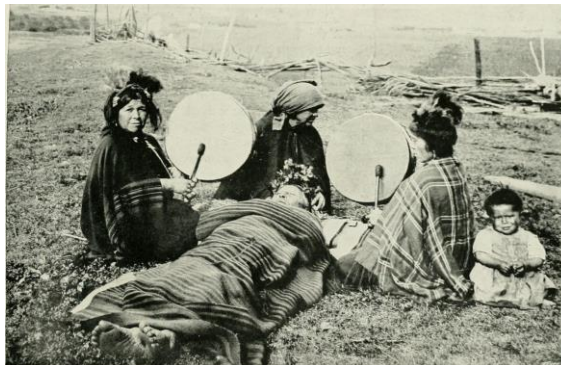
Fotoğraf 2. Machiler Bir Hastayı Tedavi Ediyor (yaklaşık 1908) 30

Vlutun ve datun olarak bilinen ritüeller olmaktadır. Birincisi vlutun , törende başka bir kişinin yardımı olmaksızın hafif dereceli hastalıklar için kısaca yapılan bir şifa anıdır. Datun ritüeli ise daha kapsamlı ve karmaşık bir ayin olup, ciddi veya kronik hastalıklar için kullanılmaktadır. Bu dinamikte, machiye , Mapuçe dilinde " yegvlfe " olarak bilinen, ilgili tören enstrümanlarını machi ile birlikte ve dönüşümlü olarak çalan bir müzik asistanı eşlik etmektedir. Ayrıca Mapudungun'da " meli kefafafe " 29 olarak anılan dört efsanevi savaşçının varlığını görmek mümkündür (Grebe, 1973: 29).