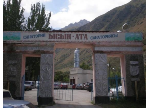
Görsel 10-11. Kaya Üzerine İşlenmiş Antik Buda Resmi ve Sanatoryumun Girişinden Bir Görüntü (Guide services Kyrgyzstan Uslugi gıda Kyrgyzstan, 2016)