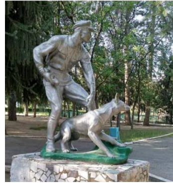
Görsel 4-5. Sanatoryumun Girişi ve Sınır Koruma Muhafız Heykeli (Andrianova, 2020)

Sanatoryumda genel ve koroner dolaşım bozuklukları, kas-iskelet sistemi rahatsızlıkları, çevresel sinir sistemi kronik hastalıkları, pulmoner (kanı kalpten akciğerlere taşıyan dolaşım sistemi) ve kalp yetmezliği ile birlikte tüberküloz kökenli kronik solunum yolu hastalıkları tedavi edilmektedir (Issyk-kul, 2024a)