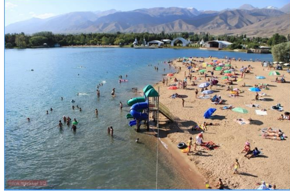
Görsel 2-3. Issık Göl'den Görüntüler