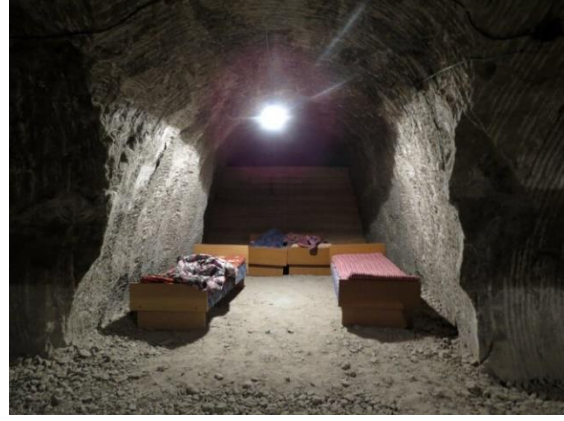
Görsel 8-9. Çon- Tuz Sanatoryumunda bir Sosyal Alan ve Konaklama Yapılan Odalardan Biri (Livejournal, 2014)