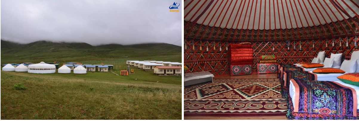
Görsel 12-13. Baytur Kırmızı Tedavi Merkezinin Dışarıdan Görünümü ve Bozıy (yurt) Türündeki Odalarından Biri (Kumisoleçebnitsa Baytur Rezort / Baytur Resort, 2024)