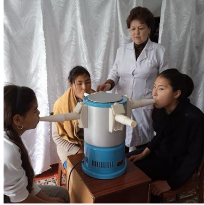
Görsel 1. UV Iřınlarıyla Üst Solunum Yolu Tedavisi (Reabilitatsionny.tsentr Bakıt.Jalal-Abad, 2024)

Celal-Abad bölgesinde bulunan Bakıt isimli sanatoryum daha çok çocuk hastalıkları üzerine hizmet vermektedir. Bu sanatoryumda vitamin tedavisi, fizyoterapi, fitoterapi (bitkilerle tedavi), terapötik fizik tedavi ve masaj gibi hizmetler sunulmaktadır (Reabilitatsionny.tsentr Bakıt.Jalal-Abad, 2024).