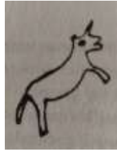
Gergedan 19 (Bang ve Rahmeti, 1970: 19).

Ava çıkan Oğuz'un ise, avda sıradan hayvanları avlaması beklenemez. Destan kahramanı olmasının yanı sıra bir milletin ülküsünü gerçekleştirecek bir bireyin avı da olağanüstü özelliklere haiz olmalıdır ki av vasıtasıyla kendi erkini ve bilhassa Tanrıdan aldığı kutunu ispatlayabilsin. Bu sebepten anlatı, insanların başına türlü dertler açan canavar yani problem bir durumla başlar; Oğuz'un yurdunda, ormanda insan ve hayvanları yiyen büyük bir gergedan yaşarmış. Bu canavar, at sürülerini basar, atları yer, insanlara zarar verir, canlarını almış. Oğuz Kağan, ilk iş olarak insanları bu zahmetten kurtarmak için onu avlamaya karar verir: "Kargı, kılıç aldı, kalkan ile ok ile, / Dedi, gergedan artık, kendisini yok bile!" (Ögel, 2014a: 132). Bu kısımda Oğuz'un gergedanı avlaması, Derin Ekoloji ile çelişmez; aksine bir türün başka bir tür (!) üzerinde kurmaya çalıştığı baskı ve hükmetme arzusuna karşı bir duruştur. Bu duruş, Türk tefekkürü açısından önemlidir; zira ekolojik bakışa göre insan tahakküm etme arzusunda iken, burada bir başka canlının kendini özne olarak görmeye alışmış insanı nesneleştirmeye çalıştığı görülür.