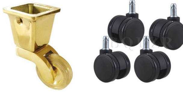
Şekil 12. Tekerlek Örnekleri (Wheels Samples)

Tekerlekler mobilyaların hareket edebilmesini (ileri geri ya da 360° hareket etmesini) sağlayan elemanlardır. Özellikle ağır mobilyalar ve sürekli hareket etmesi gereken sandalye gibi mobilyalarda büyük öneme sahip elemanlardır [7]. Şekil 12’de gösterildiği gibi birçok çeşit ve büyüklükte bulunmaktadır.