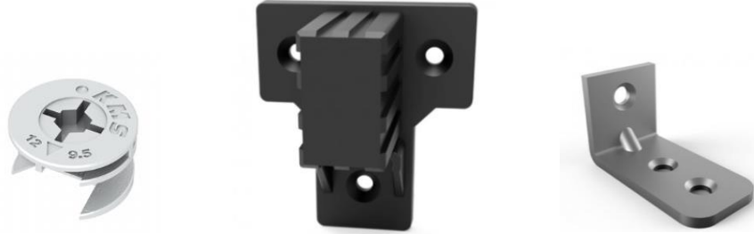
Şekil 3. Çeşitli Bağlantı Elemanları (Furniture Fittings Samples)

Kabara: Mobilyalarda deri yâda kumaşı ahşaba tutturmak için kullanılan iri, yarım yuvarlak başlı demir çivi, taslı çivi. Deri döşemelerde çivi başlarını örtmek ve güzel görüntü sağlamak amacı ile kullanılır. Kumaş kaplı mobilyanın kenarındaki şeridin üzerine ara verilmeden çakılan süslü çivilerdir. Şekil 4’de mobilya kabara örneği verilmiştir.