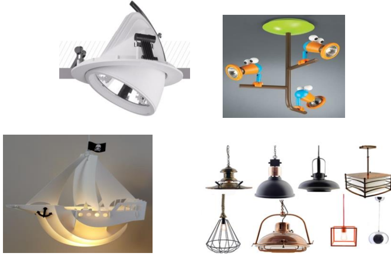
Şekil 6. Aydınlatma Elemanı Örnekleri (Lightning Product Samples) [6].