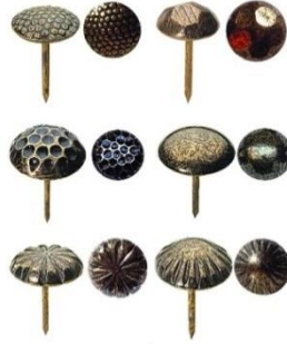
Şekil 4. Kabara ( Furniture Nail) [4].

Kabara: Mobilyalarda deri yâda kumaşı ahşaba tutturmak için kullanılan iri, yarım yuvarlak başlı demir çivi, taslı çivi. Deri döşemelerde çivi başlarını örtmek ve güzel görüntü sağlamak amacı ile kullanılır. Kumaş kaplı mobilyanın kenarındaki şeridin üzerine ara verilmeden çakılan süslü çivilerdir. Şekil 4’de mobilya kabara örneği verilmiştir.