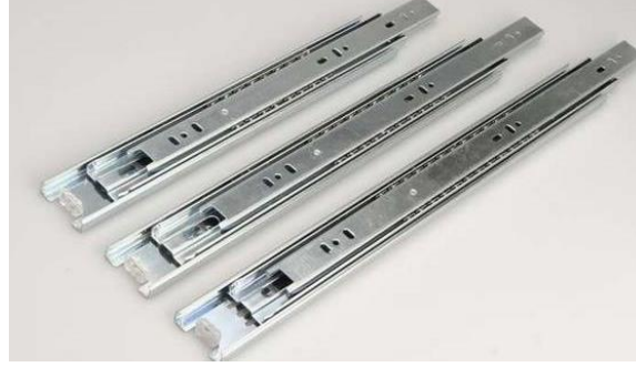
Şekil 11. Ray Örnekleri (Furniture Rail Samples)

Mobilya elemanlarının açılıp kapanmasını sağlamak amacıyla kullanılan elemanlardır. Frenli teleskopik raylar, bilyeli raylar, masa rayları ve gizli çekmece rayları gibi çeşitleri bulunmaktadır [7]. Şekil 11’de ray örnekleri verilmiştir.