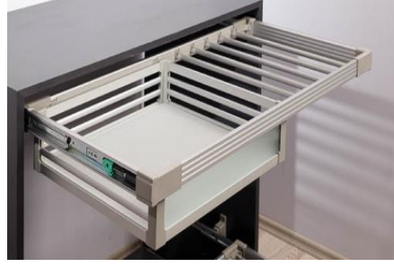
Şekil 5. Çekmece Örnekleri (Furniture Drawer Samples) [5].

Bir çekmece; Ön kayıt, Yan kayıt, Arka kayıt, Altlık, Kulp veya sap elemanlarından oluşmaktadır. Çekmece önlerinin mobilyaya uyum ve uygunluğunu sağlamak için çekmece önlerine klapa denilen tablalar bağlanır. Bu tablalar mobilya renk ve formuna uygun yapılır ve çekmece iç kısmından çekmece ön kaydına vida ile bağlanarak çekmeceye sabitleştirilir.