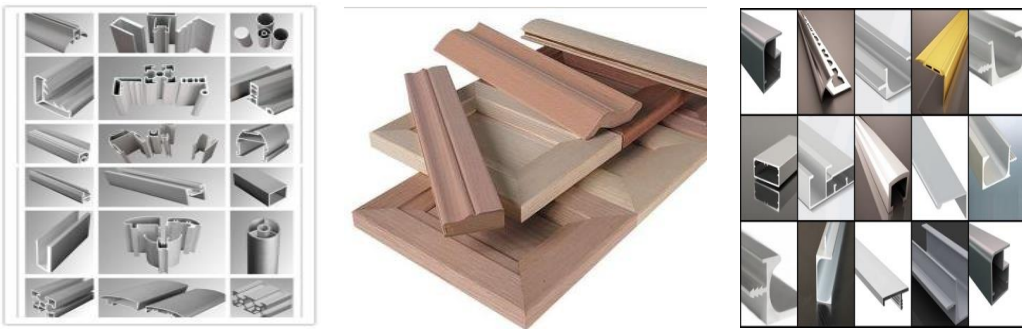
Şekil 10. Profil Örnekleri (Furniture Profiles Samples) [7].

Mobilyalara derinlik kazandırmak amacıyla kullanılırlar. Belirli statik mukavemete sahip, çeşitli fonksiyonları içeren tırnak, yuva, kulak vb. gibi girintili ve çıkıntılı haiz ekstrüzyon üretimi ile elde edilmiş kapalı veya açık alüminyum profillerdir. Çeşitleri: Tezgâh önü ve baza profilleri, market raf ve stand profilleri, kapı kasa ofis bölme profilleri, sürme kapak profilleri vb dir [7]. Şekil 10’da çeşitli profil örnekleri verilmiştir