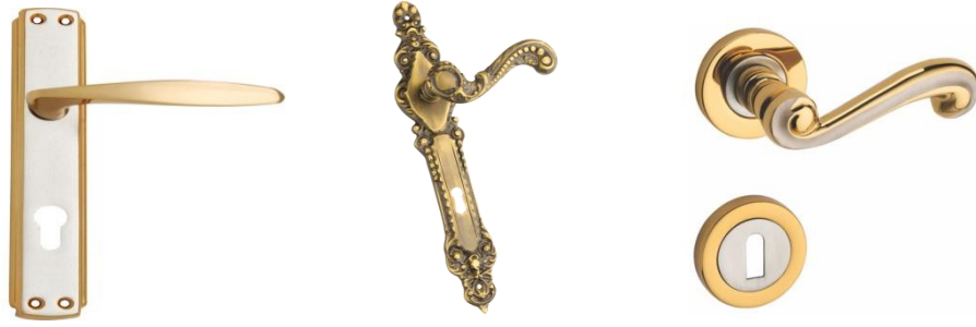
Şekil 13. Kol Örnekleri (Door Handle Samples)

Geleneksel Türk evleri mimarisi; taş, ahşap işçiliği yâda kalem işleri gibi özelliklerinin yanı sıra kapıları ve kapılarındaki madeni elemanları ile de dikkat çekicidir [8]. Şekil 13 de kol örnekleri verilmiştir.