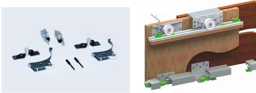
Şekil 7. Sürgü kapak Sistemleri (Furniture Sliding Door System) [6].

Mobilyalarda gizemlilik, temizlik ve kullanım özelliklerine bağlı olarak kapak sistemleri kullanılmaktadır. Kapaklar; Sürme ve Katlanır Kapı/Kapak olarak detaylandırılabilir. Mekanizma Sistemleri, masa rayları, eş zamanlı açılır kapanır masa sistemleri, dolap ve kapı/kapak sistemleri, ağır sürme gardolap sistemleri, cam kapak/kapı sistemleri, bölme panel sürgü ve katlanır sistemler, duvardan duvara ve tabandan tavana ray dolap panel sistemleri bu grupta yer almaktadır. Şekil 7’de sürgülü kapı sistemi ve elemanlarına örnek verilmiştir.