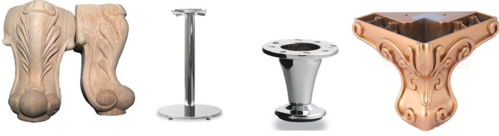
Şekil 8. Mobilya Ayakları (Furniture Feet)