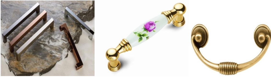
Şekil 1. Kulp Örnekleri (Handles Samples) [3].

Tutma yeri; İngilizce “handle” anlamında kullanılan kulp; kazan, tencere, fincan, dolap, altın vb.nin tutulacak yeri anlamına gelmektedir. Mobilya, dolap, çekmece, kapı, gardırop ve diğer tutma açma-kapama amacıyla kullanılan mobilya elemanlarıdır. Ahşap, paslanmaz çelik, alüminyum, pirinç, zamak ve porselen gibi birçok farklı malzemeden farklı modellerde üretilebilir [3]. Şekil 1’de kulp örnekleri verilmiştir.