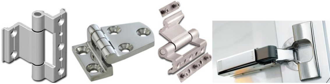
Şekil 9. Kapak Mentеше Sistemleri (Door Hinge Systems)

Kapı ve pencerelerde, mobilya, pano ve makine kapaklarında kullanılan ve takıldığı yere hareket imkânı sağlayan metal ve plastikten mamul ürünlerdir. Genel itibari ile mil etrafında hareket eden iki parçadan oluşmaktadır. İşlev, kullanılan alan ve kapak takılması yöntemine bağlı olarak çeşitleri bulunmaktadır. Şekil 9’da da gösterildiği gibi taş menteşe, deveboynu, okka menteşe vb. şeklinde sınıflandırılabilirler [7].