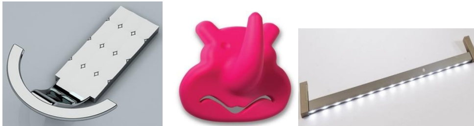
Şekil 2. Askı Örnekleri (Hanger Samples) [3].

Bu ürün grubunda ayrıca askılar da yer almaktadır. Şekil 2’de bazı askı örnekleri verilmiştir.