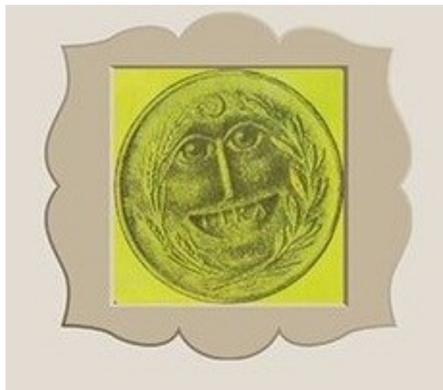
Şekil 3. Kitabın ön kapağında yer alan görsel.

Şekil 2’deki bulgulara göre başlıkta kullanılan punto büyüklüğü kapakla ilk karşılaşma anında dikkatlerin sadece tasarımda kullanılmış görselle kaymasını engeller.