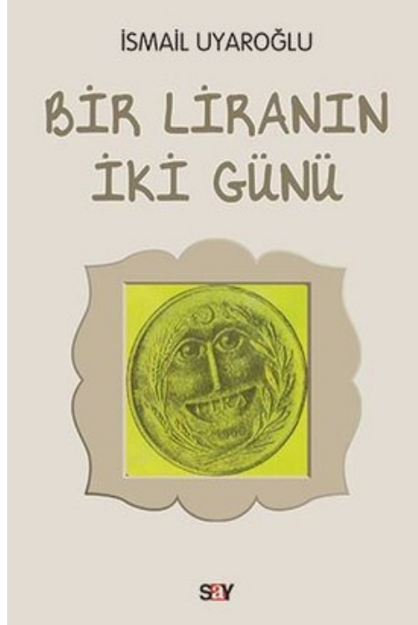
Şekil 1. “Bir Liranın İki Günü” kitabı ön kapağı (Uyaroğlu, 2018).

Şekil 1’deki bulgulara göre görsel “Bir Liranın İki Günü” adlı eserin kapak tasarımıdır. Mehmet İlhan Kaya tarafından tasarlanan kapağın resimleyeni ise Tan Oral’dır. Kapak resminde yer alan para figürü için renk tercihi çocukların dikkatine yönelik ilgisini çekmekle beraber kitabın adının görselden ayrı yazılışı okurun ilk bakıştaki karşılaştığı kargaşayı önleyici nitelikte olmuştur. Kapak yapısında kaliteli ve parlak nitelikte karton kapak tercih edilmiştir.