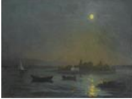
Resim 3. Hüseyin Avni Lifij, Kız Kulesi, 42.5 x 69 cm Tuval Üzerine Yağlıboya

Galeri alanında atölyenin konusu olan Avni Lifij'in eserlerine geçildiğinde atölye lideri eserler ve dönemleri veya ressam hakkında herhangi bir bilgi vermedi; doğrudan resimlere odaklanılmasını sağladı. Avni Lifij'in altı eserinden birini her katılımcının seçmesini ve seçtikleri esere bir süre odaklanarak bakmalarını istedi. Müzede diğer ziyaretçilerin galerileri geçişleri sürüyordu ki tam odaklanma esnasında bir ziyaretçilerden bir çocuğun artan ağlama sesi ile katılımcıların dikkati dağıldı. Çocuk alandan uzaklaşınca tekrar odaklanma sağlandı. Odaklanmanın sonunda, dikkat dağınıklığı ile geçen süre hariç takriben 10 dakika kadar katılımcılar sessizce eserlere odaklandılar. Sürecin sonuna atölye lideri tekrar bir yönerge vererek odaklanma sürecini sonlandırdı. Her katılımcının seçtiği eseri neden seçtiğini ve onda yarattığı duygu durumunu sordu. Daha sonra önce kimin başlamak istediği soruldu ve ilk katılımcı ile başlandı. Hüseyin Avni Lifij'in Kız Kulesi tablosunu, yolculuğunun gözünde büyümesi nedeni ile atölyeye isteksiz katılan katılımcı seçmişti.