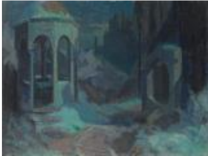
Resim 4. Hüseyin Avni Lifij, Türbe, 28x46 cm, Tuval Üzerine Yağlıboya

Tablolara odaklanan katılımcılar etiketleri fark etmemiş olduğundan öncelikle Kız Kulesi tablosunun yeri konusunda kararsız kaldılar. Ama tabloyu seçen katılımcı tabloda kendisini çekenin ışık olduğunu ve oldukça karanlık bir gecede güven verdiğini ifade etti. Günün hangi saati olabileceği konusunda ise kararsız kaldı. Diğer katılımcılar “ayın en parlak zamanı sabaha karşı olabilir” görüşünü dile getirdiler. Atölye lideri, tabloda bulunan yelkenliye dikkat çekti. “Nereye gidiyor olabilirler? Neden demirlemiş olabilirler?” sorularına resmi seçen katılımcı, manzara izledikleri yorumunu yaparken diğer katılımcı gece yolculuk yapmanın karanlıkta endişe verici olabileceği için demirlemiş oldukları yorumunu yaptı.