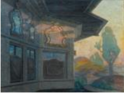
Resim 8. Hüseyin Avni Lifij, Mihrişah Sultan Dairesi , Kontrplak Üzerine Yağlıboya

Manzara resmini seçen katılımcı ise mahalle oluşunun ve eski zamanda bir mahalleyi anımsattığı ve nostaljik bulunduğu için resmi seçtiğini anlatmıştır. Uzaktan görünen cami manzarasının kendini etkilediğini bir diğer katılımcı söylemiştir. Bir diğer katılımcı ise gökkuşağının kendisini etkilediğini, yağmurlu bir bahar günü gibi düşündüğünü ve gökkuşağını görmenin mutlu hissettirdiğini ifade etmiştir.