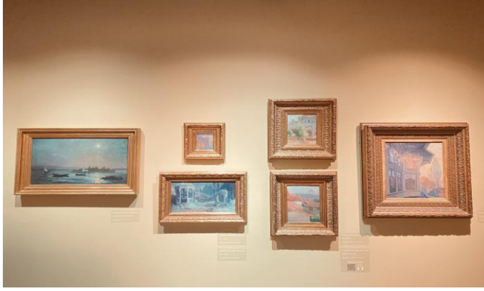
Resim 1. Atölye'de Odaklanılan Eserler

'Müzedede An'da Yetişkinler İçin Sanat Terapi Atölyesi, SSM'nin Modernizmin İzinde Türk Resmi sergisindeki Avni Lifi eserlerinden ilhamla gerçekleşiyor. Atölye, mevsim sembolizmi üzerinden duyguların dışavurumuna odaklanarak, katılımcıların iç dünyalarını yansıtan sanat eserleri üretmelerine olanak sağlıyor. Katılımcılar, sanat eserinin çağrıştırdıklarından, kendi yaşantı ve duygularına doğru bir içsel yolculuğa çıkmaya davet ediliyorlar.' (Müze'de Anda, 18 Şubat 2024 https://www.sakipsabancimuzesi.org/sayfa/muzede-anda ).