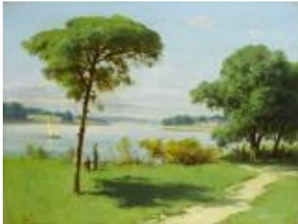
Resim 2. Hoca Ali Rıza, Manzara (1906-1907) 54x73 Tuval Üzerine Yağlıboya

Kaynak: Sabancı Üniversitesi Sakıp Sabancı Müzesi Koleksiyonu ( https://digitalssm.org/digital/collection/ResimKlksyn/id/687/rec/239 )