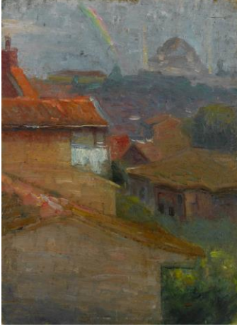
Resim 7. Hüseyin Avni Lifij, Manzara , Mukavva Üzerine Yağlıboya