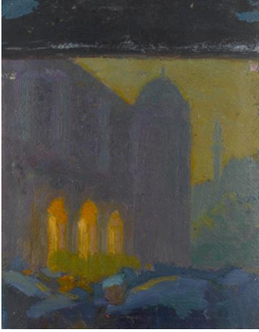
Resim 5. Hüseyin Avni Lifij, Gece, Mukavva Üzerine Yağlıboya.