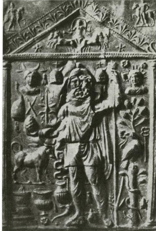
Resim 4: Roma'da bulunmuş bronz levha. Günümüzde Koppenag Müzesi'nde.