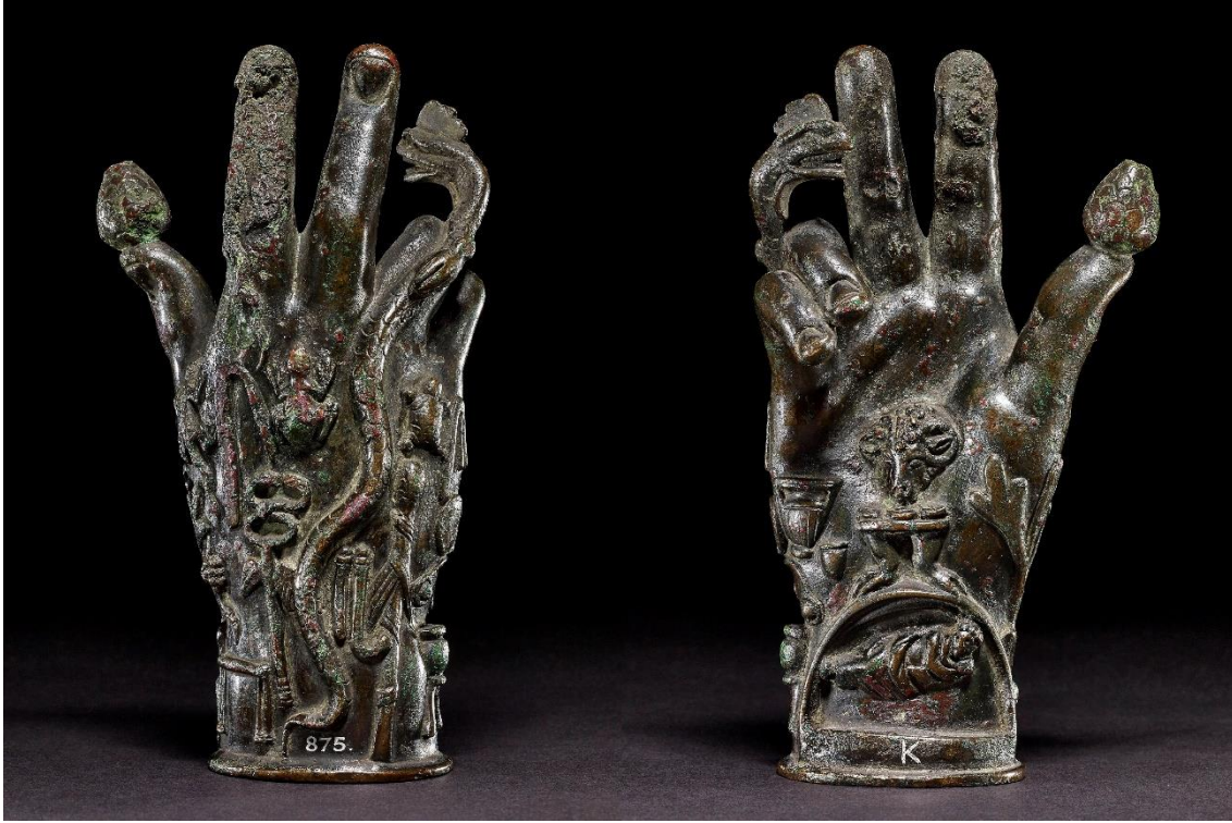
Resim 1: Sabazios Eli. (British Museum, Katalog No: 1613525177)