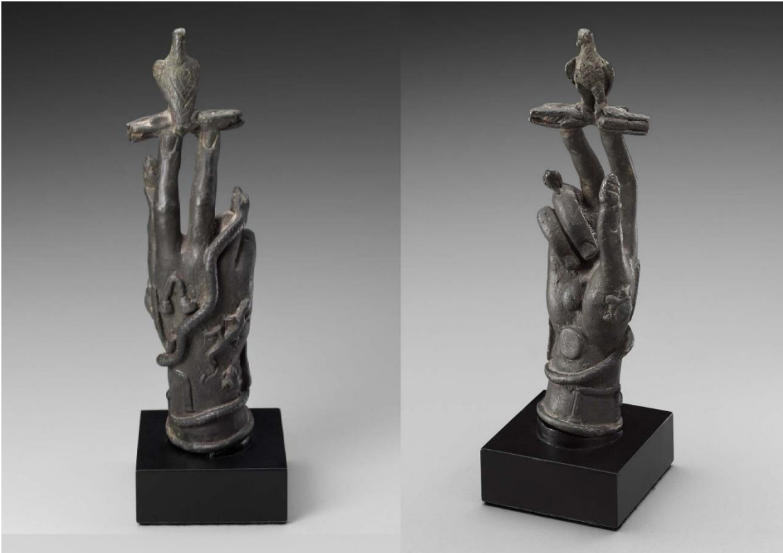
Resim 2: Sabazios eli. (Resim- Sabazios Eli- Boston MFA. Katalog No: 2006.1893)