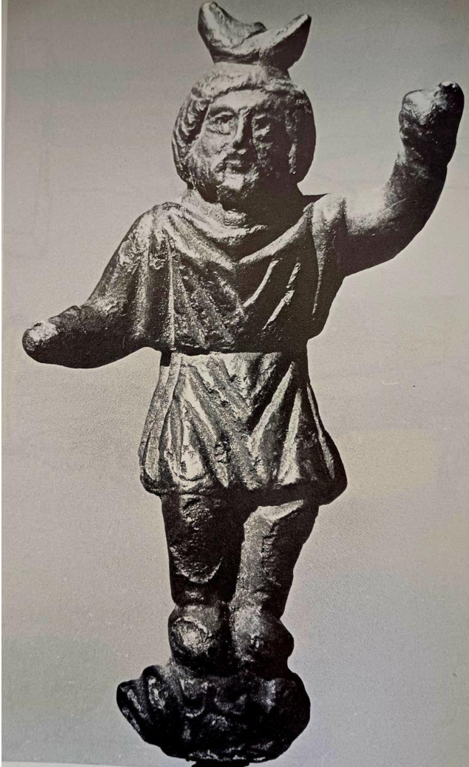
Resim 5: Bronz el üstüne yerleştirilen aplik Sabazios figürü. Kaynak: Lane 1983: Lev.20, Fig.19.