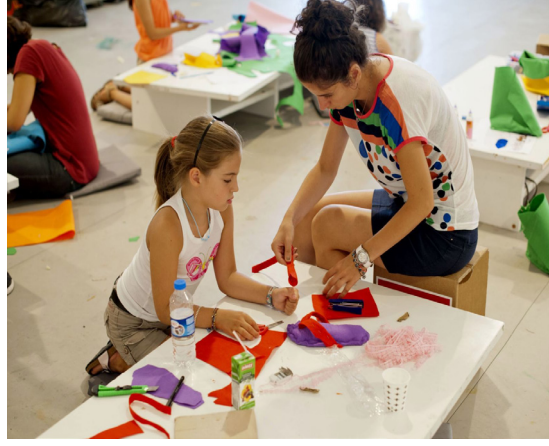
Resim 1. Müzede Çocuk Atölyesi (URL 2)