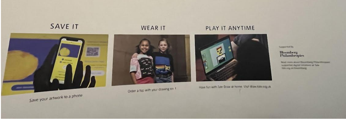
Resim 5. Ünal Gerdan S. (2024) Tate Britain

Bu dijital sanat uygulamaları, kâğıt tüketimini azaltarak çevresel sürdürülebilirliği desteklemekte önemli bir rol oynamaktadır. Tate Draw gibi dijital araçlar, kullanıcıların sanat eserlerini dijital platformlar üzerinde oluşturmasına ve paylaşmasına olanak tanırken, geleneksel kâğıt ve mürekkep kullanımını azaltmaktadır. Bu da doğal kaynakların korunmasına ve çevresel etkilerin azaltılmasına katkı sağlamaktadır. Tate Draw örneği, sürdürülebilir bir sanat uygulaması olarak öne çıkarken, diğer sanat kurumlarına ve kullanıcılara çevresel farkındalığı artırma ve çevre dostu uygulamalara geçişi teşvik etme konusunda ilham vermektedir.