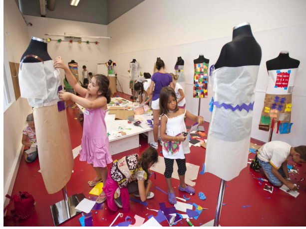
Resim 2. Müzede Çocuk Sanat Atölyesi, (URL 3)

Sanatın çocuk gelişimi üzerine etkisi, yaratıcılık ve hayal gücünün gelişimi bakımından değerlendirildiğinde çocuğun kendini ifade edebilmesi açısından önemli olduğu görülür. Bu önem, çocuğun karşılaştığı kavramları analiz etmesi, yorumlaması, üzerine düşünerek yeni bir bakış açısı getirmesiyle doğrudan ilişki kurar. Sanat çocuğun yaratıcılığını zenginleştirip geliştirirken duygularını aktarmada bir ifade aracı olur. Çocuk sanatla uğraşırken çevresiyle yardımlaşır yeni fikirler öğrenerek yaratıcılığını geliştirir. Bu bağlamda sanat, çocuğun bilişsel gelişimini desteklemiş olur. Sanat eğitimi ile kolektif çalışmayı öğrenen çocuk, bu doğrultuda farklı açılardan düşünmeyi de öğrenerek problem çözme becerisi de edinir. Belirli bir kavramı sanatsal ifadeyle aktarırken öncelikle kavramın ne olduğu