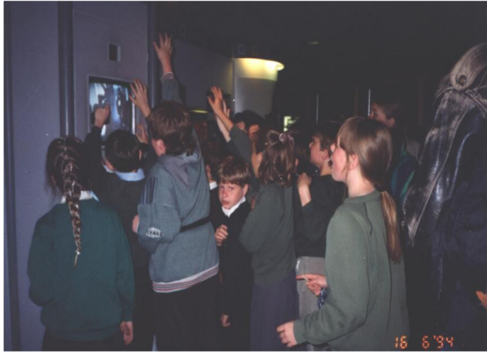
Resim 6. Londra Savaş Müzesi Dokunmatik Sistemler X Kuşağı

Bir müze, kültürel değerleri koruma, inceleme ve sergileme amacıyla toplum yararına sürekli olarak yönetilen bir kurumdur. Son yıllarda müzecilik insan odaklı hale gelmiştir. 20. yüzyılda müzeler, kütüphane ve laboratuvarlar gibi önemli eğitim kurumları arasına katılmıştır. Modern müzecilikte müzeler, kütüphane, toplantı salonları, laboratuvar ve eğitim bölümleri ile bir kültür ünitesi olarak görülmektedir (Okan B, 2018). Okan'ın belirttiği gibi, modern müzecilik anlayışının insan odaklı hale gelmesi, müzelerin kültürel ve eğitsel işlevlerini daha da güçlendirmektedir.