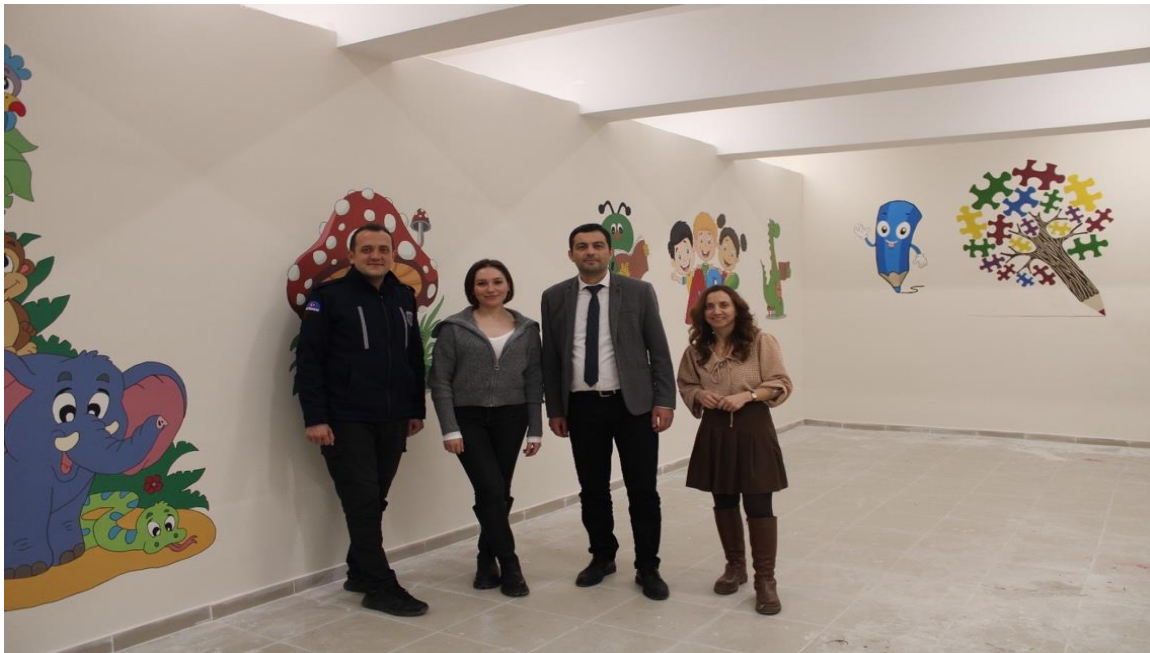
Figure 9 Illustration of the children's nursery area of Edirne L Type Prison Women's Ward.