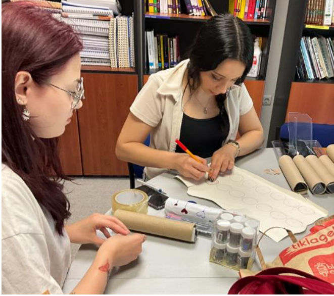
Resim 8 “Çiçek Dürbünü” Yapımının tamamlanması

Etkinlik Yeri ve Tarihi: Şükrüpaşa İlkokulu-Edirne/03.05.2023