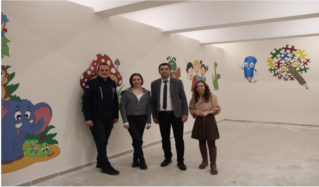
Resim 9 Edirne L Tipi Cezaevi Kadınlar Koğuşu Çocuk Kreş Alanının Resimlenmesi.