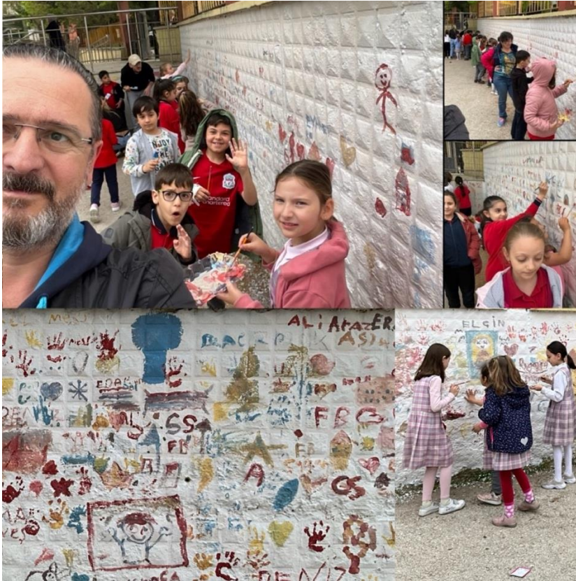
Figure 4 Courtyard Wall Painting Activity