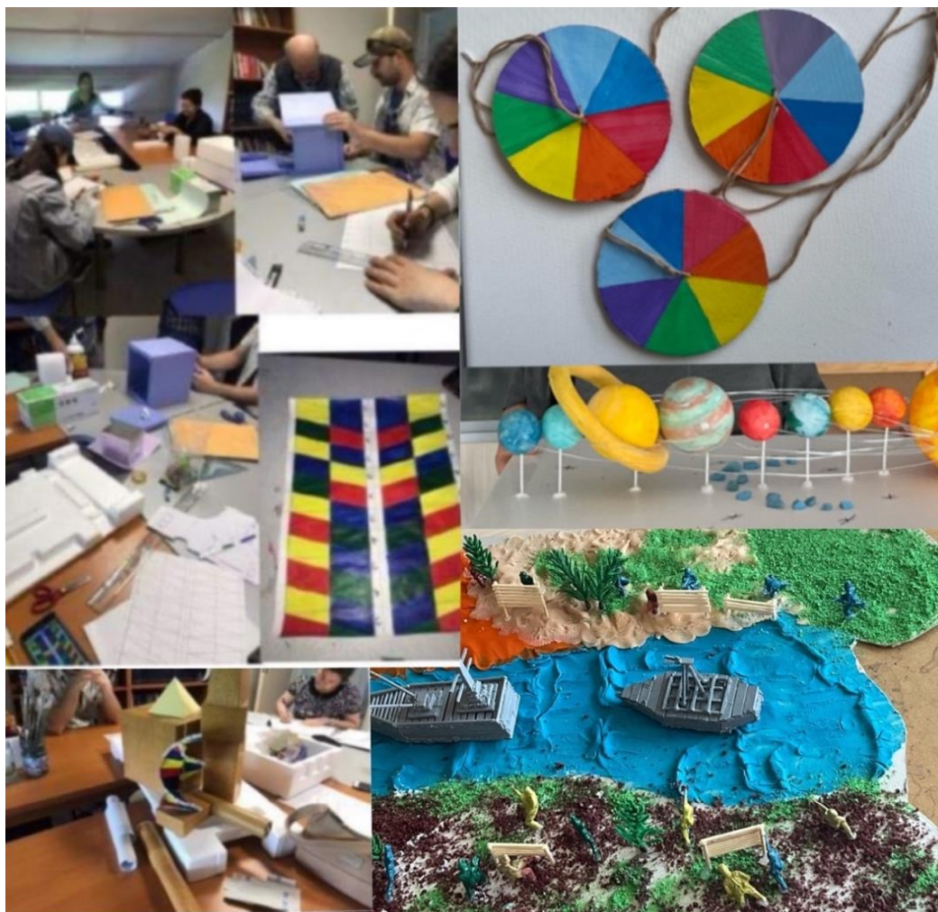
Figure 6 Examples of materials prepared by students of the Community Service Practices course group in three semesters