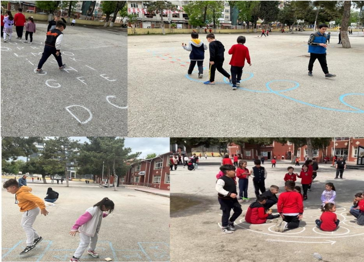
Resim 3 Hazırlanan Oyun Alanlarında Çocukların Oyunları

Okul bahçesinde gerçekleştirilen yönleri gösteren pusula, harflerle ve sayılarla oluşturulan oyun parkurları, ilköğretim için uygun alanlardır. Bunun gibi formüllerle, matematik işlemlerle ilerlenen çeşitli platformlar, labirentler de öğrenciler tarafından tasarlanmıştı fakat zaman, malzeme ve öğrenci kısıtlılığı dolayısıyla en pratik olanlar hayata geçirildi. Sek sek ve diğer oyun alanlarında boyama yaparken çocukların ilgisi başladı ve daha kurmadan oynamak için çocuklar birbirleriyle yarıştı. Çocuklarda çok büyük bir oyun açlığı olduğu görüldü. Gözlemlerimize göre tenefüs en az 20 dakika olmalıdır. Bahçedeki platformlar beden derslerinde kullanılacak gibi olmalıdır. Uygulama kapsamında hazırlananlar buna müsaittir. Öğrenci sayısı, ders saati, yeri, belli olan etkinlikler daha düzenli geçti bununla birlikte bahçede gerçekleşen etkinliklerde tenefüs saatinde yoğun talep ve küçük çaplı izdihamlar yaşandı. Oyun alanlarının nasıl kullanılacağı yağ satarım bal satarım, istop gibi oyunlar öğretildi. Öğrenciler kısa sürede adapte olup hemen oyun oynamaya başladılar.