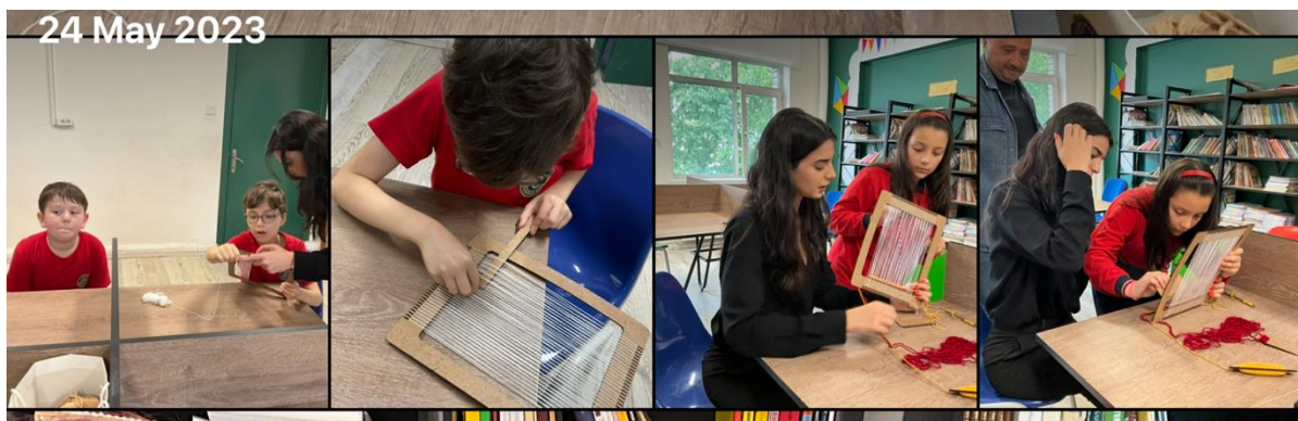
Figure 7 Rug Weaving Introduction

Since the school principal knew that such an activity would be held, he suggested the library as a suitable venue. He sent 5 students and volunteers who were running, playing and sweating a lot in the garden. At the beginning of the activity, it was explained to the children that they would get to know weaving and rugs and that there would be an exercise related to this. It was asked Would you like to try it too?. The importance of rugs, carpets and textiles in Turkish culture was mentioned. After chatting with the children on this subject, warp thread, other threads and materials such as comb, kirkit and vargel were introduced. The warp thread was threaded onto the small rug loom with the help of the Project Instructor, Community Service Applications student and children. Then, the process steps were explained and it was shown how the rug is woven by passing it from one bottom to the other. Children experienced this process in turn. The activity lasted until weaving several rows. Even though the students got a little bored because there were outdoor games outside, they later enjoyed it and had a new experience and learning.