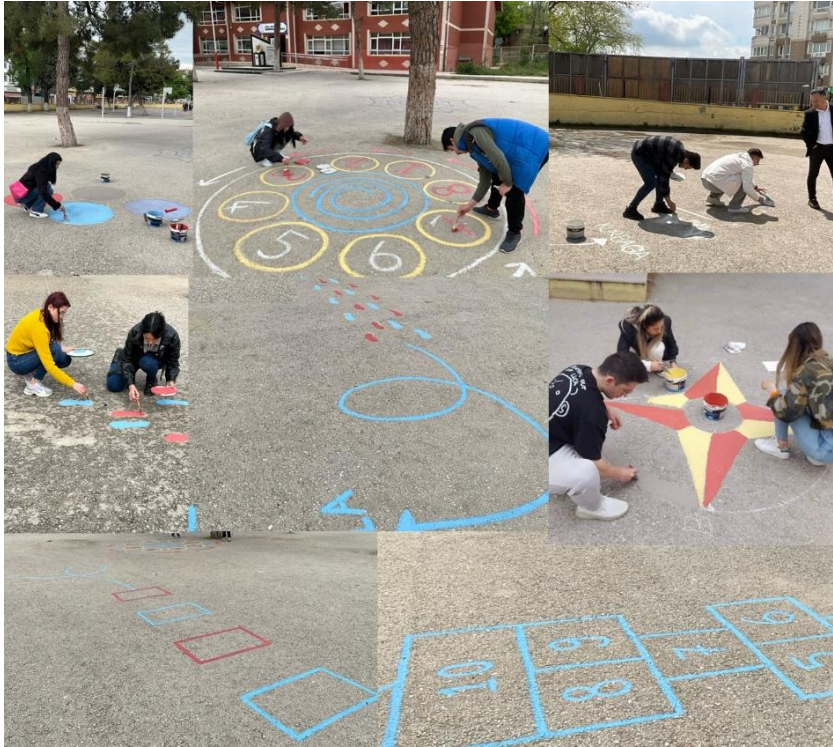
Figure 2 Preparation of Playgrounds in the School Courtyard