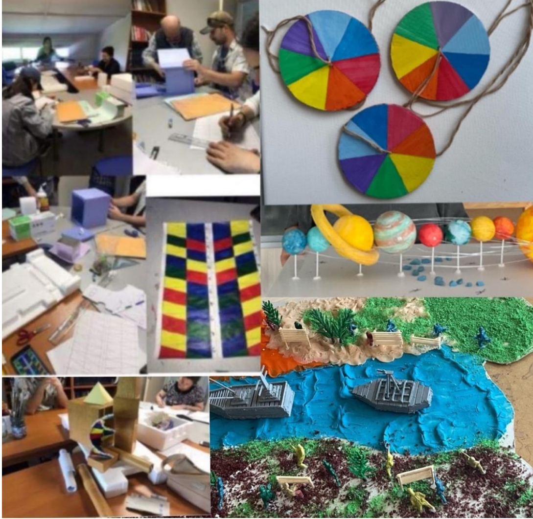
Resim 6 Üç dönemde Topluma Hizmet Uygulamaları ders grubu öğrencileri tarafından hazırlanan materyallerden örnekler