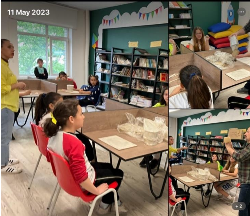
Resim 5 Doğa Sevgisi” Temalı Seramik Saksı Yapımı

Etkinlik Yeri ve Tarihi: Şükrüpaşa İlkokulu-Edirne/10.05.2023-11.05.2023 (2 gün)