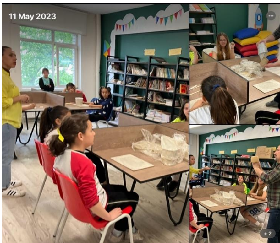
Figure 5 Making a "Love of Nature" Themed Ceramic Flower Pot

Activity Place and Date: Şükrüpaşa Primary School-Edirne/10.05.2023-11.05.2023 (2 days)