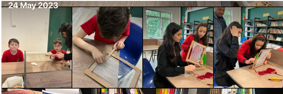
Etkinlik 7: Kilim Dokumayla Tanışma Etkinliği