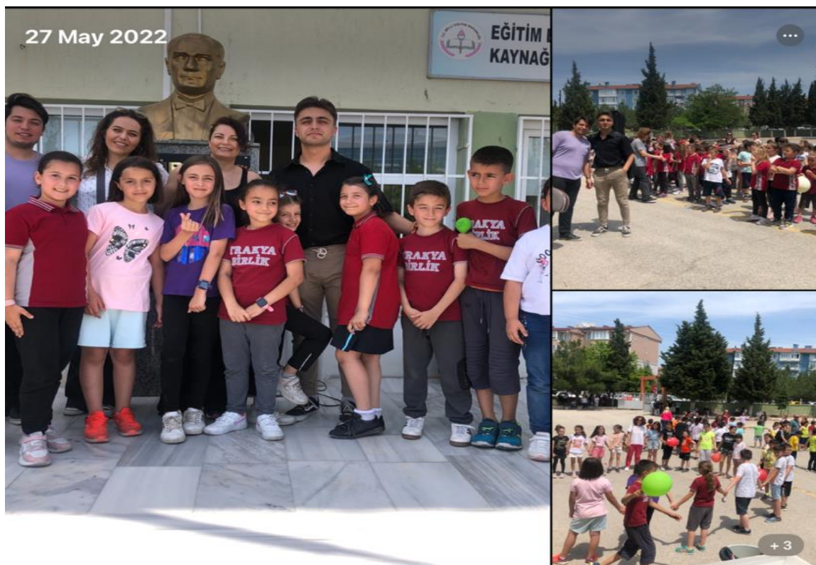
Figure 1 Activity of Games with Music

Activity Place and Date: Trakya Birlik Primary School / 27.05.2022