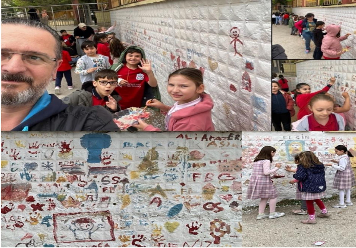
Resim 4 İlkokul Öğrencileriyle Gerçekleştirilen Avlu Duvarı Boyama Etkinliği

Etkinlik Yeri ve Tarihi: Şükrüpaşa İlkokulu/28.04.2023