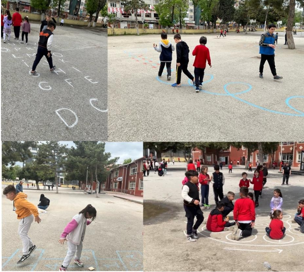
Figure 3 Activities for Children to Play in the School Courtyard