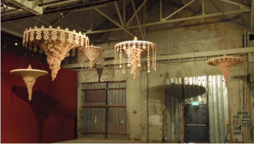
Resim:7 Hema Upadhyay, Loco foco sloganı, 2007, Milano - İtalya