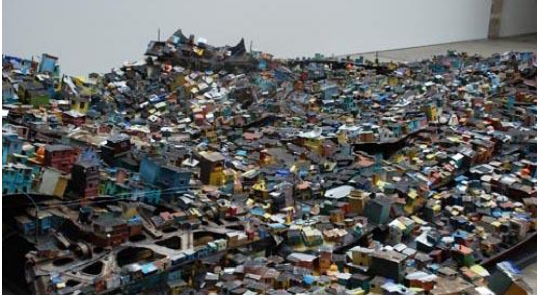
Resim:4 Hema Upadhyay, Rüya bir dilek- Dilek bir rüya, Enstalasyon, 2006.

Hema Upadhyay, enstalasyon çalışmaların da, yükleme veya sonuç çıkarmayı ifade eden bireyin algısında, duyuşların bilgisi ile algılama sonucu çoklu malzemenin birbiri ile meydana getirdiği form ve devamında enstalasyonun görsel hareketi, duyuşsal ve bilişsel anlamdaki nedensel çıkarımda bulunmayı vurgular.