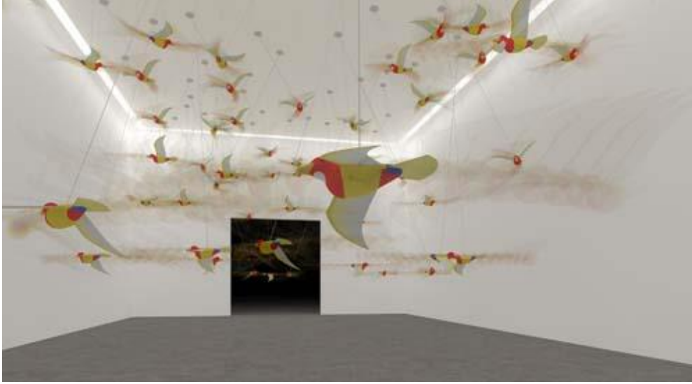
Resim:6 Hema Upadhyay, İkiz Ruhlar, Enstalasyon, 2010

Kovaryasyon teorisi, atfın (yüklemenin) anahtarı olarak, olası nedenlerin ve hareketlerin karşılıklı ilişkisine odaklanır (Fiske, 2009:103). Sonucun atfına neden olan bu çıkarımsal sonuç, çalışma da sanatçının yükleme sonucuna ulaşarak, ifade biçimlerini ve kavram sorgulamalarının nedensel yüklemelerini görmemiz mümkündür. Bu süreç mekânsal kullanımlarda kendini gösterirken mekânın ve formun duyuşsal algısı, kavramsal modelin kişisel nedenselin yargısıdır.