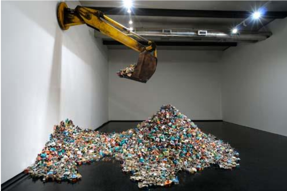
Resim: 5 Hema Upadhyay, Çeken Arılar nerde, Çeken burada I (Where the bees suck, there suck I), 2009, MACRO Müzesi, Roma- İtalya.

Hema Upadhyay, enstalasyon çalışmaların da, yükleme veya sonuç çıkarmayı ifade eden bireyin algısında, duyuşların bilgisi ile algılama sonucu çoklu malzemenin birbiri ile meydana getirdiği form ve devamında enstalasyonun görsel hareketi, duyuşsal ve bilişsel anlamdaki nedensel çıkarımda bulunmayı vurgular.