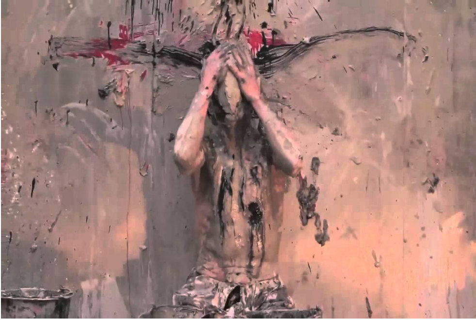
Resim:1 Olivier de Sagazan, Kendi Yaşamından 24 saatinin Performansı

Olivier de Sagazan'ın Başkalaşım performansı çözümlemesinde diğer bir anlam yüklemeye de, atfetme teoremindeki, içsel ve dışsal yüklem ikililiği performansın değerlendirmesinde oldukça önemli bir yer tutmaktadır. Bireylerin deneyimlerini, davranış ve anlayışlarını açıklamak için onları nasıl ilişkilendirildiği atıfların (nedensel yüklemelerin) etkisi olabilir. Ana fikir başkalarının davranışlarının anlamlandırma yaparken, insanlar dış atıflar için kendi davranışlarını anlama eğiliminde sonuca bağlamada iç faktörler etkilidir (Gesa,2015).