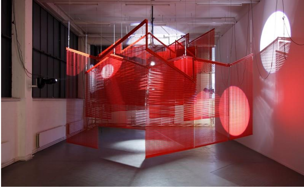
Resim:8 Haegue Yang, Karşılaşmanın Dağları (Mountains of Encounter), 2008 (Hamburg, Almanya montajı görünümü 2008)