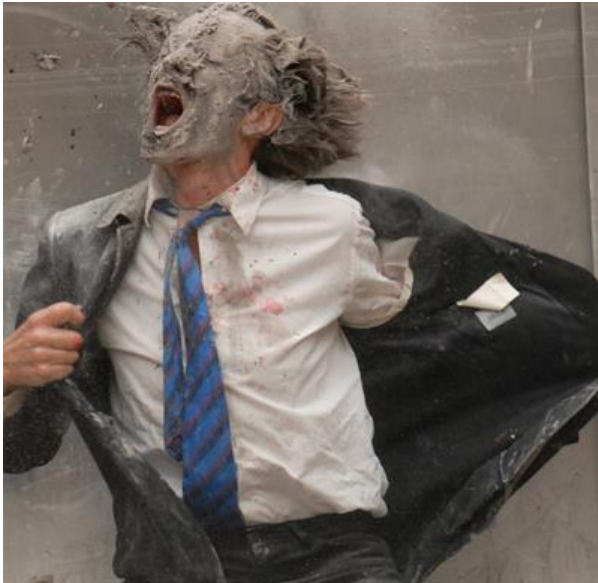
Resim:2 Olivier de Sagazan, Başkalaşım, Performans

Olivier de Sagazan'ın Başkalaşım performansı çözümlemesinde diğer bir anlam yüklemeye de, atfetme teoremindeki, içsel ve dışsal yüklem ikililiği performansın değerlendirmesinde oldukça önemli bir yer tutmaktadır. Bireylerin deneyimlerini, davranış ve anlayışlarını açıklamak için onları nasıl ilişkilendirildiği atıfların (nedensel yüklemelerin) etkisi olabilir. Ana fikir başkalarının davranışlarının anlamlandırma yaparken, insanlar dış atıflar için kendi davranışlarını anlama eğiliminde sonuca bağlamada iç faktörler etkilidir (Gesa,2015).