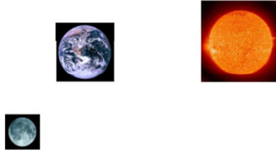
Şekil 2. Yedinci soruya ait Dünya, Güneş ve Ay’ın konumları

Bilimsel olarak kabul edilemez cevapların %87.50’ten %33.34’e gerilediği tespit edilmiştir.