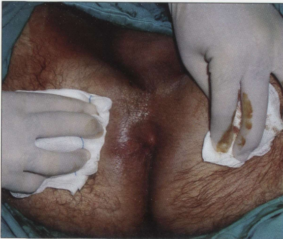
RESİM 1: Ülser görünümünde perianal fistül ağzı.

38 yaşında erkek hasta anorektal ağrı ile başvurdu. Anamnezinde ağrı şikâyetinin yanında, yaklaşık 2 yıldır perianal pruritus ve akıntı şikâyetinin de olduğu, bu şikâyetlerinin zaman zaman azalıp artmakla beraber hiç geçmediği öğrenildi. Daha önce 3 kez perianal fistül sebebiyle medikal tedavi alan hastanın fizik muayenesinde litotomi pozisyonunda saat 8 hizasında ülser fistül ağzı tespit edildi (Resim 1). Soygeçmiş ve özgeçmişinde özellik bulunmayan hastanın rektal tuşe ve diğer sistemik fizik muayenesi normaldi. Hastaya uygulanan fistulografide, fistülün yaklaşık 2 cm kadar devam ettikten sonra rektum sağ lateral duvara açılarak sonlandığı tespit edilerek fistülektomi yapıldı (Resim 2). Preoperatif olarak yapılan rutin biyokimya ve hemogram tetkiklerinde patoloji saptanmayan hastanın Akciğer grafisi de normaldi. Spesimenin histopatolojik incelenmesinde fistül