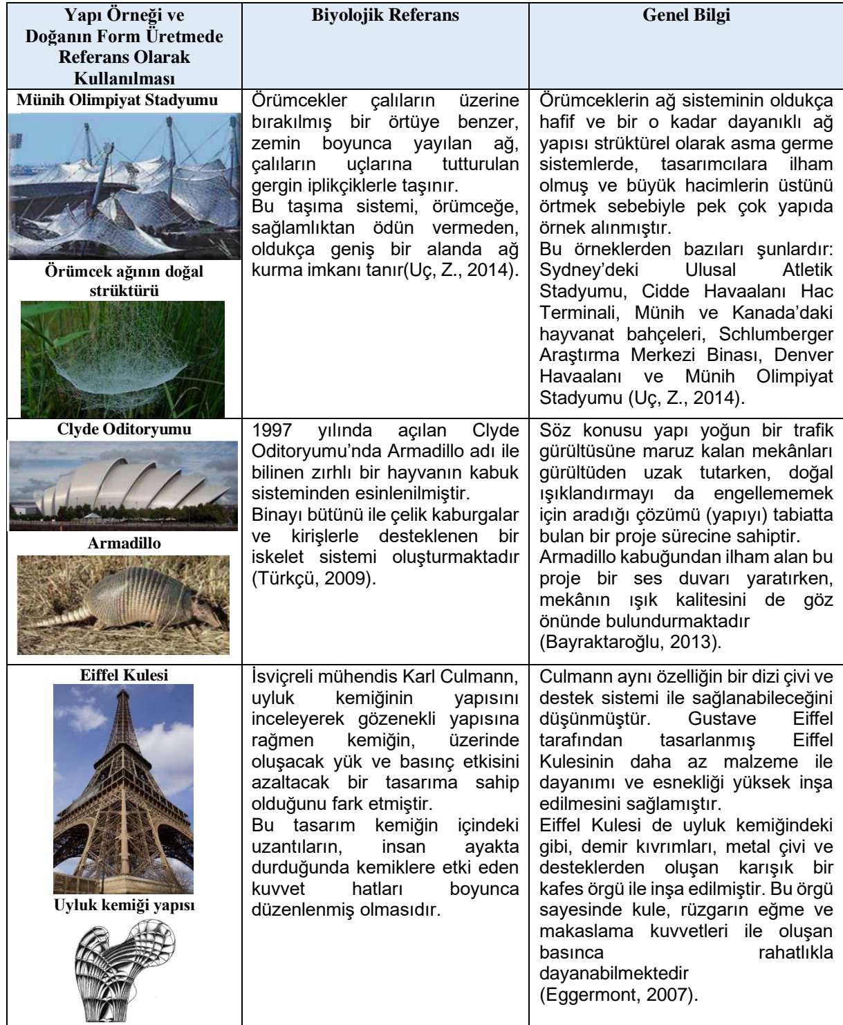
Tablo 1: Biyomimetik tasarım örnekleri