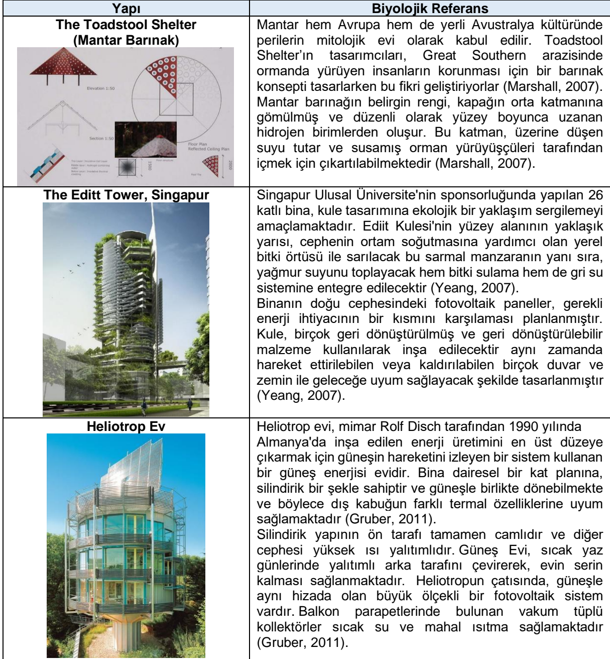
Tablo 2: Ekomimetik tasarım örnekleri

Bjarke Architecture Group (BIG) tarafından tasarlanan ve ekomimikri yaklaşımına uygun özellikteki Zira Island projesinde doğal bir ekosistemde olduğu gibi enerji tüketimi sıfır olan bir şehir hedeflenmiştir. Bu şehirde rüzgârdan enerji üretmek için rüzgâr türbinleri, güneş enerjisinden enerji üretmek amacıyla yapıların çatı ve cephelerinde fotovoltaik paneller tasarlanmıştır (Yazıcıoğlu, 2020). Ekosistem temelli birçok tasarım örneği mevcuttur bunlardan bazıları Tablo 2’ de verilmiştir.