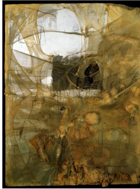
Görsel 3. Bruce Conner, Arakhne , 1959, Karışık teknik: Naylon çoraplar, kolaj ve karton, Smithsonian American Art Museum, ABD.

Çağdaş sanat içerisinde bu miti çalışmalarına aktaran sanatçılara Bruce Conner, Damien Hirst, Diane Victor ve Tomás Saraceno örnek verilebilir. Bu isimlerden Bruce Conner'a bakıldığında II. Dünya Savaşı sonrası dönemin önde gelen isimlerinden biri olduğu görülür. Çeşitli disiplinlerde çalışmalar üreten ve burjuva sanat ideallerini kabul etmeyip doğallık, kirlilik, aşağılanmışlık ve marjinalite dayalı işler üreten Conner'ın (http 1) Görsel 3'te yer verilen "Arakhne" adı çalışması incelendiğinde bir asamblaj örneği ile karşılaşılır.