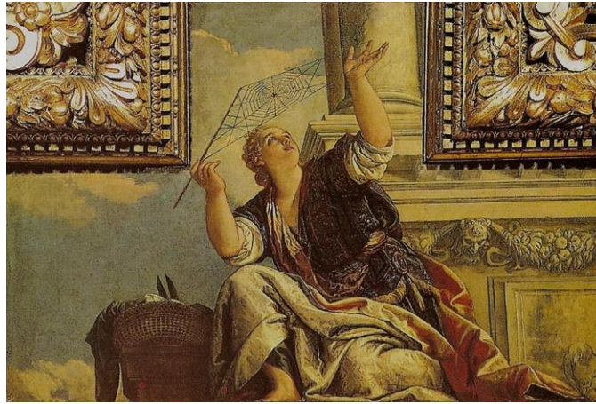
Görsel 1. Paolo Veronese, Arakhne & Diyalektik , 1520, Fresk, 250 x 180 cm, Palazzo Ducale, İtalya.

her sanatçının özgün anlatımı aracılığıyla günümüze ulaşmıştır. Genel olarak fresk, tuval üzerine yağlı boya ve baskı gibi geleneksel yöntemlerle oluşturulan bu çalışmalarda Arakhne'nin Athena tarafından cezalandırılışı Romalı şair Ovidius'un Dönüşümler adlı kitabından referans alınarak yorumlanmıştır. Sayıları çoğaltılabilecek bu çalışmalara araştırma kapsamında Paolo Veronese'in "Arakhne & Diyalektik" (Görsel 1) ve René-Antoine Houasse'nin "Minerva ve Arakhne" (Görsel 2) adlı eserlerinin görselleri örnek olarak verilmiştir. Bu eserlerde çağdaş sanattaki yorumlamaların aksine tasvire dayalı olarak hikâyenin bütünlüğüne odaklanılmış ve resimdeki bazı küçük detaylarla çalışmalara zenginlik katılmaya çalışılmıştır.