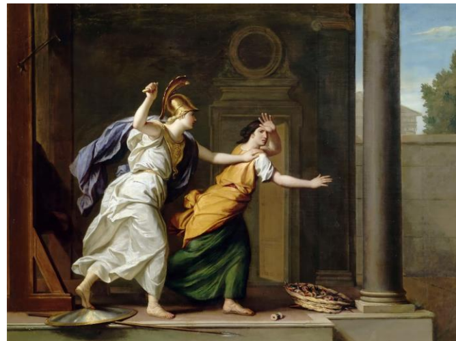
Görsel 2. René-Antoine Houasse, Minerva ve Arakhne , 1706, Tuval üzerine yağlı boya, 105 x 153 cm, Versailles, Fransa.