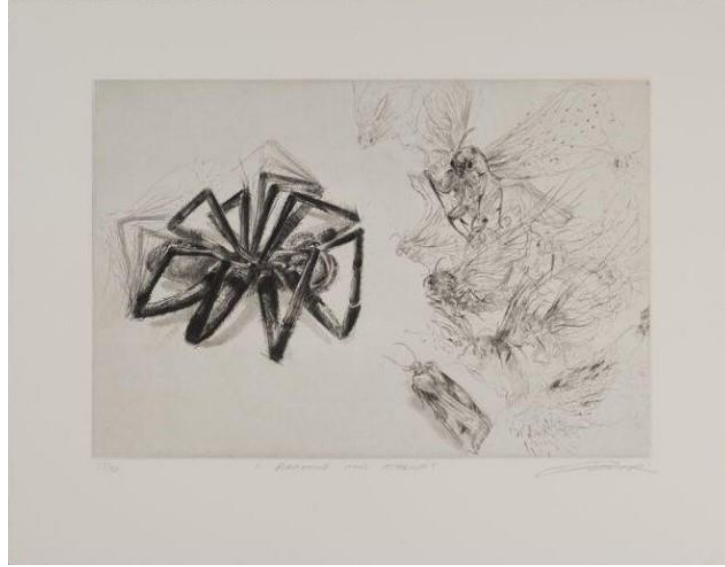
Görsel 5. Diane Victor, Bir Ulusun Doğuşu: Arakhne ve Athena , 2009, 37,4 x 47,4 cm, Kuru Kazı.

ve bacaklarıyla birleştiren Hirst, bu heykel çalışması aracılığıyla mitolojik bir efsanenin yorumlamasını bizlere sunar (http 4).