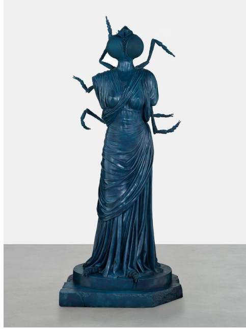
Görsel 4. Damien Hirst, Dönüşüm , 2016, Bronz heykel, 211,6 x 88,2 x 88,7 cm.

cazibe ve alçakgönüllülük beklentisi içine hapsettiği iddiasını, savaş sonrası tüketimciliği ve cinsiyete dayalı şiddeti besleyen nesneleştirici bir gücü örneklemektedir. Sanatçının eserinde gerilmiş, sarılmış ve yırtılmış şekilde naylon materyalini kullanması da bir zamanlar güzel bir duvar halısı olan, lakin dokuyucusunun kibri nedeniyle sadece karanlığı ve yıkımı doğuran sefil ve harap hale gelen Arakhne'nin ağına göndermede bulunur (http 2).