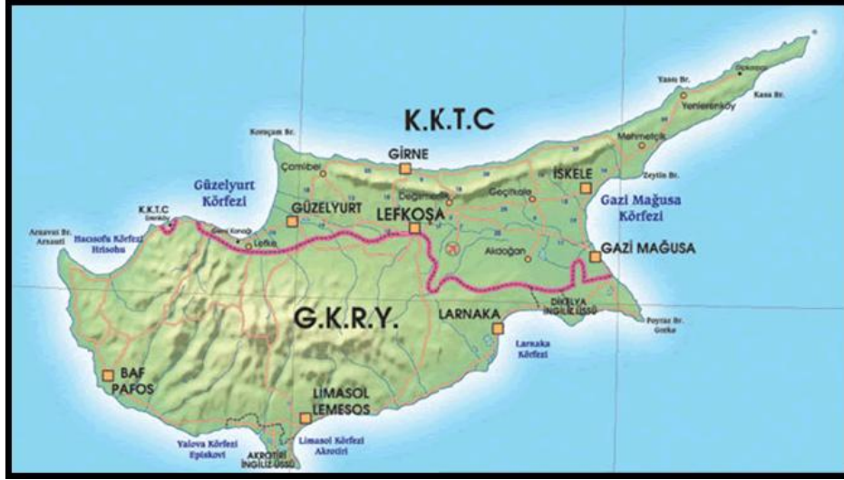
Resim 2: Kıbrıs'ta Türk ve Rum Toplumlarının Egemenlik Bölgeleri