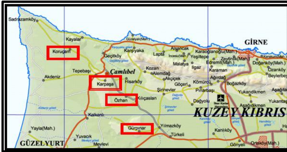
Resim 3: Kuzey Kıbrıs'taki Maronit Köyleri

(Harita: KKTC Harita Dairesi, 2002; İşaretleme: Rıdvan Bal)