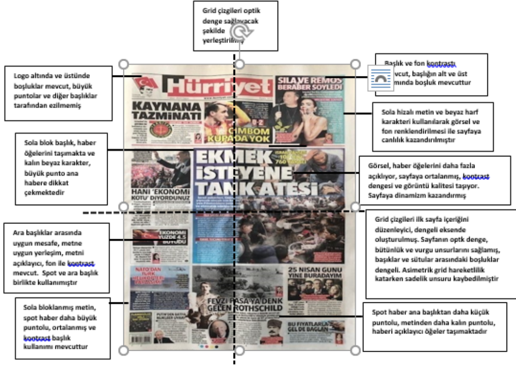
Görsel 2: 07 Mart Tarihli Hürriyet Gazetesinin Kapak Sayfası