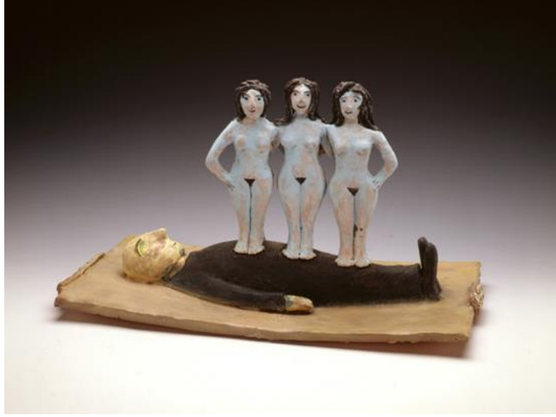
Görsel 10. Beatrice Wood, Kariyer Kadını (Career Women) , 1990, Sırlı seramik heykel.

Sanatçının Kariyer Kadını (Career Women- Görsel 10) adlı bir eserinde, yatmakta olan giyinik bir erkek figürü üzerine çıplak bir şekilde ayakta duran üç kadın figürü yerleştirilmiştir. Erkek siyahlar içinde ve giyinik olmasına rağmen, kadınlar tamamen çıplak ve cinsel organlarındaki tüyler dikkat çekecek şekilde tasvir edilmiştir. Kadınların iş hayatında karşılaştıkları zorlukları kendi tarzında aktarmaya çalışan sanatçı çıplak bedenlerle belki de kadının şeffaflığına dikkat çekmeye çalışmıştır diyebiliriz. Bir erkeğe karşı üç kadın olması fikri, kadınların bir araya gelerek güçlerini birleştirirlerse ancak amaçlarına ulaşabileceklerine dair bir anlatım olabilir. Eser Wood'un yaşadığı dönemin Amerika'sında kadın ve aynı zamanda sanatçı olarak, kendisinin de tecrübe etmiş olabileceği ve günümüzde de halen devam etmekte olan kadınların iş hayatındaki varoluş çabalarına bir gönderme niteliğindedir.