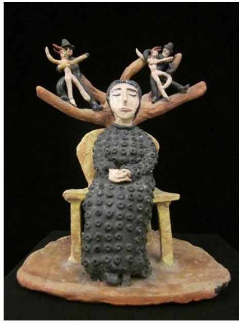
Görsel 5. Beatrice Wood, Bakirenin Rüyası (The Virgin's Dream) , Sırlı seramik heykel.

Sanatçının, adını imza niteliğindeki figüratif bir seramik çalışmasından (Görsel 4) alan Bakirenin Rüyası (The Virgin's Dream) adlı sergisi 2011 yılında Oceanside Museum of Art'ta Wood'un 1930'lardan 1990'lara kadar ürettiği eserlerden özel bir seçki niteliği taşımaktadır. Sergide figüratif seramiklerin yanı sıra seramik kaplar ve tabaklar, sulu boya çalışmaları, grafiti çizimleri, kitap illüstrasyonları ve sanatçının eskiz defterleri yer almıştır. Bu sergi, 2010 yılında David Van Gilder tarafından Oceanside Sanat Müzesi'ne bağışlanan Beatrice Wood arşivlerindeki çalışmaları öne çıkartmıştır. Van Gilder, Wood'un arşivcisiydi ve Ojai, Kaliforniya'da onunla birlikte yaşadığı on yıllık süre boyunca sanatçı hakkında kapsamlı bir bibliyografya da hazırlamıştır ( http 1).