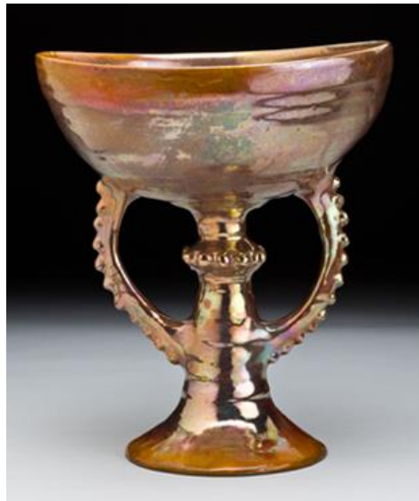
Görsel 4. Beatrice Wood, Altın Lüsterli Kadeh , 1987, Seramik, 14 cm.

Sanatçının lüster pişirimleri esnasında ortamı oksijensiz bırakmak için özellikle naftalini kullandığı bilinmektedir. Bu uygulamayı büyük ihtimalle Otto Natzler'den öğrenmiş olabilir (Sorkin, 2014:55). Sonuçları tahmin edilemez olan bu teknik başarılı bir şekilde uygulandığında aşırı parlak renkler elde edilebilir. Beatrice Wood bu tekniği profesyonelce kullanarak vazolar, sofa takımları, çaydanlıklar ve heykeller gibi birçok seramik ürün ortaya koymuştur. Ama en çok kadeh yapmayı sevdiği bilinmektedir, Görsel 4'te görüldüğü üzere yeşil ve gül tonlarını da içeren altın parıltılı kadeh bunun güzel örneklerinden biridir.