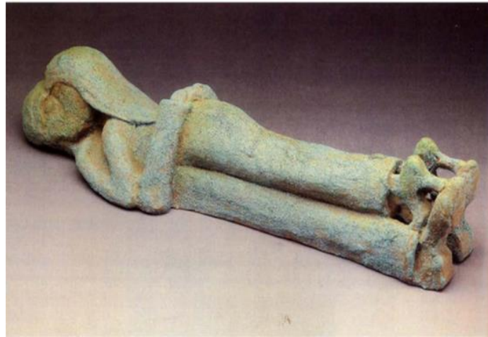
Görsel 6. Beatrice Wood, Orta Doğu Sorununun Çözümü (Settling the Middle East Question) , 1958, Seramik heykel.

Bakirenin Rüyası (The Virgin's Dream- Görsel 5) adlı heykel Beatrice Wood'un kadın erkek ilişkilerine ve aşka dair yorumlarını ironik bir biçimde aktardığı örneklerden biridir. Siyah elbiseli, gözleri kapalı bir kadın figürü sandalyede oturur vaziyette şekillendirilmiştir. İsminden de anlaşılacağı üzere sandalyedeki kadın uyuyor ve rüya görüyor bir vaziyettedir. Bu rüyanın ne olduğuna dair bilgiler ise siyah elbiseli kadın figürünün arkasında ağaç benzeri bir formun üzerine yerleştirdiği ikili gruplar halindeki kadın ve erkek figürlerinden anlaşılabilir. Çıplak bir kadın bedenine arkadan sarılmış veya kadınla temas halinde oldukları görülen erkekler eklenmiştir. Sanatçının naif tarzıyla şekillendirdiği bu heykelde figürlerin biçim bozuklukları ve oran orantı problemleri göze çarpmaktadır. Fakat bu problemler daha önce de değinildiği gibi bilinçli bir tercihin sonucu olarak karşımıza çıkmaktadır. Bu yüzden sanatçının eserini hiçbir estetik kaygı gütmeden tamamen içinden geldiği gibi şekillendirdiğini söylemek mümkündür. Burada bakire olarak nitelendirilen bir kadının rüyasında erkeklerle kurduğu ilişkilere vurgu yapılmaktadır. Erkek bedeniyle temas halindeki kadın bedeni oldukça rahat bir tarzda ifade edilmiştir. Kadın belki de gerçek hayatta deneyimlemediği bu duyguları rüyası aracılığıyla yaşamaktadır diyebiliriz. Bu anlatım biçimindeki hikâyenin tamamen masum ve safça olduğunu söylemek mümkündür.