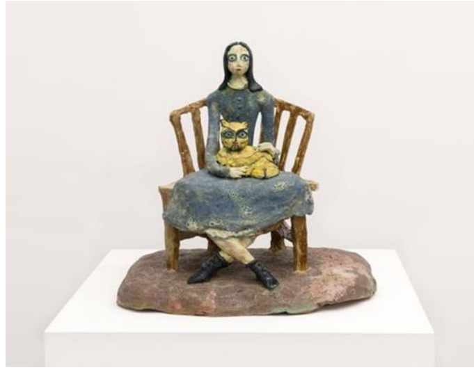
Görsel 8. Beatrice Wood, Bekar (Not Married) , 1965, Sırlı seramik heykel, 42.5 x 40 x 31.8 cm.

“azize, anne ve fahişe” hepsinin erkek egemen dünyası tarafından kuşatıldığı ve kontrol edildiği anlatılmaya çalışılmıştır. Tarih boyunca kadının varlığının erkek kimliği üzerinden tanımlanmasına eleştirel bir yaklaşım sunduğunu söylemek mümkündür. Sanatçı'nın Dada ruhunu ne kadar benimsediğini gösteren bu eser ironi ve hiciv çerçevesinde ortaya konmuştur. Çağdaşı olan birçok Dada sanatçısı gibi biçimden çok ifadeye ağırlık vererek güçlü eleştirel bir anlatım biçimi yarattığını söyleyebiliriz.