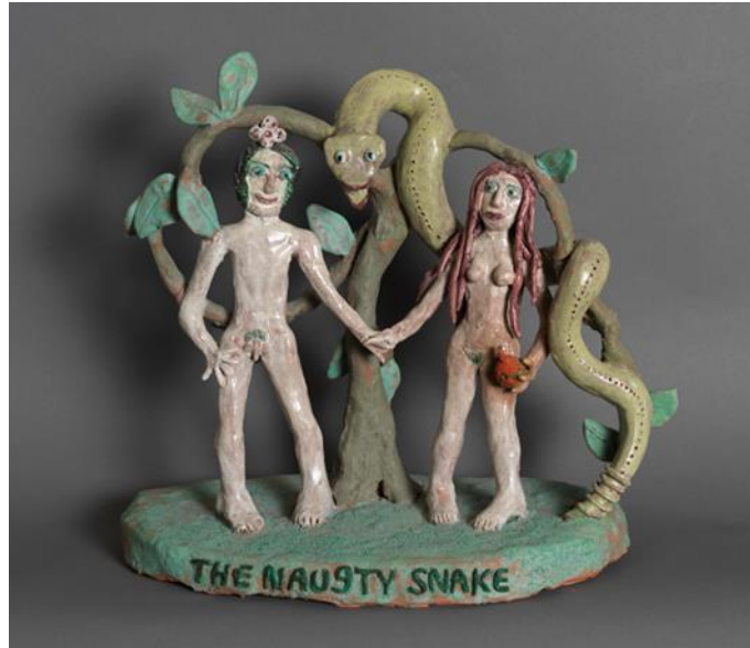
Görsel 7. Beatrice Wood, Yaramaz Yılan (The Naug[h]ty Snake) , 1972, Sırlı seramik heykel, 38.1 x 41.91 x 21.59 cm.

bir görüntünün ortaya çıktığı görülmektedir. Kadın bedeninin erkeğin üstüne yerleştirildiği eserde, erkeğin fiziksel avantajından vazgeçtiğini ve kadının üstün konumda ifade edilmeye çalışıldığını söylemek mümkündür. Clark, sanatçının Orta Doğu Sorununun Çözümü ismini verdiği çalışmasının bugün de devam etmekte olan İsrail-Filistin çatışmasına gönderme yaptığını ifade etmektedir. Örneğin tam olarak kim zirvededir (ya da olmalıdır), İsraililer mi yoksa Filistinliler mi? Sanatçı bu sorunu kadın ve erkek bedeni üzerinden hicvederek anlatmaya çalışmıştır. Bu iki ülke arasında yıllardır süregelen sorunu kadın ve erkeğin üstünlük mücadelesi üzerinden aktarmaktadır. Şiddetin şiddeti doğuracağına inanan sanatçı İsrail ve Filistin'in birbirine sınıksız sarılarak olayların üstesinden gelebileceğine inanmaktadır diyebiliriz (Longhauser ve Melandri, 2011:124).