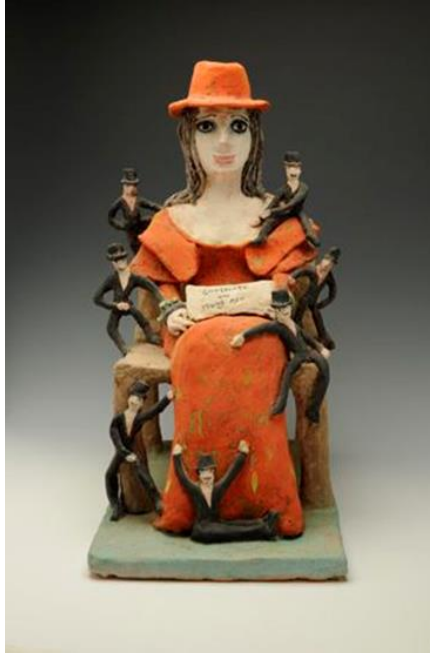
Görsel 11. Beatrice Wood, Çikolata ve Genç Erkekler (Chocolate and Young Men) , 1990, Sırlı seramik heykel, 53x 25 cm.

Çikolata ve Genç Erkekler (Chocolate and Young Men- Görsel 11) adlı eseri uzun bir yaşam süren ve 105 yaşında hayatını kaybeden sanatçının bir röportajında kendisine yöneltilen soruya verdiği cevaba dayanmaktadır. Nasıl bu kadar uzun bir yaşam sürdürdünüz sorusuna, çikolatanın ve genç erkeklerin hayatındaki yerini anlatarak cevap vermiştir. Sandalyede oturan (muhtemelen kendisi) kırmızı elbiseli, kırmızı şapkalı kadın figürü elinde çikolata ve etrafını saran altı erkekle tasvir edilmiştir. Takım elbiseli ve şapkalı şık giyimli bu erkeler, kadın figürüne temas edecek şekilde yerleştirilerek, onlarla kadın arasında bir bağ kurulmaya çalışılmıştır. Sanatçı ilkel bir naifliği çocuklara özgü masumiyetle birleştirerek kendi kadınlık dünyası hakkında bize bilgiler aktarmaya çalışmıştır.