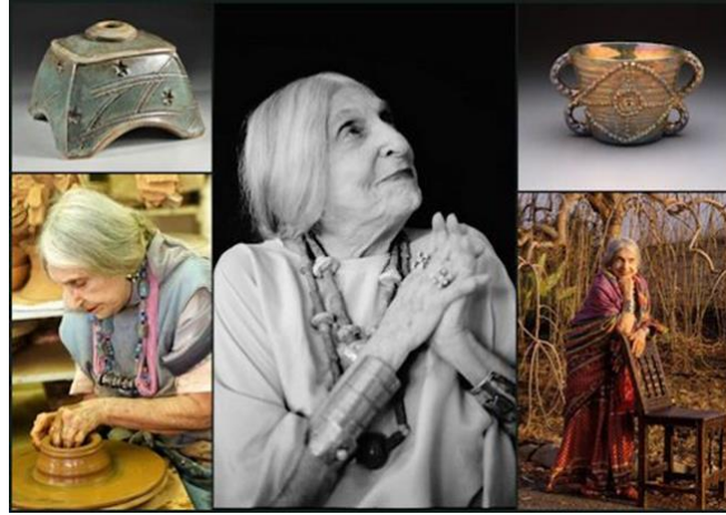
Görsel 1: Beatrice Wood, atölyesinde çalışırken ve kendisine ait seramik eser örnekleriyle birlikte.

Bu araştırmanın amacı Dada seramiğinin önemli bir temsilcisi olan Beatrice Wood'un Sofistike İlkeller adını verdiği seramik eserlerini detaylı bir şekilde ele almaktır. Araştırmada yöntem olarak içerik analizi ve sanat eseri analizi yöntemleri kullanılmıştır. Sanatçının yaratım sürecine katkı sağlayan olaylar, durumlar ve bunun sonucunda ulaştığı noktayla ilgili literatür taramaları yapılmış, araştırma için gerekli olduğu düşünülen ana konular kuramsal bir çerçevede aktarılmıştır. Kısmen biyografi kısmen de analiz niteliğindeki bu çalışmanın kapsamında, Wood'un kadın bir sanatçı olarak kendine biçtiği rolün, sanatsal pratiklerinin ve estetik anlayışının üzerinde durulmuştur. Sanatçıya ait Sofistike İlkeller adlı seramik heykel serisinden seçilmiş yedi adet örnek üzerinden eser analizi yöntemi kullanılarak değerlendirmeler yapılmıştır. Bu heykellerin biçimleri, yapılış amaçları ve verilmek istenen mesajlar yorumlarla desteklenerek aktarılmaya çalışılmıştır. Sonuç bölümü ile tamamlanan araştırma, sanatçının bu heykeller aracılığıyla kadınlar hakkındaki toplumsal normlara karşı vermek istediği mesajları içermektedir. Araştırmada yer verilen bilgilerin ve elde edilen sonuçların seramik alanı başta olmak üzere plastik eser çalışmaları gerçekleştiren sanat alanları için faydalı olacağı düşünülmektedir.