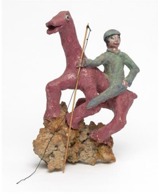
Görsel 9. Beatrice Wood, Her Kızın Rüyası (Every Maiden's Dream) , 1990, Sırlı seramik heykel, 33.7 x 25.4 x 10.2 cm.

Görsel 9'daki Her Kızın Rüyası (Every Maiden's Dream) adlı eser Wood'un, yine erkek egemen toplumun kadına biçtiği rollerden birini seçip bunu Dadaesk şakacı provokasyonlarıyla birleştirerek bir çeşit ironiye dönüştürdüğünü söylemek mümkündür. Pembe renkteki bir at üzerine yerleştirilmiş erkek figürü elinde bir sopa ya da kırbaç tutmuş vaziyette tasvir edilmiştir. Aslında çalışmadaki hayvanın at olduğunu anlamak pek mümkün görünmemektedir. Fakat bu esere Her Kızın Rüyası adını vermiş olması ve bir dönemin çocuk masallarında bile olan "kızlar beyaz atlı prensini bekler" algısının varlığı düşünüldüğünde bu figürün at olduğu çıkarımını yapabiliriz. Aslında sanatçı bilinçli bir şekilde yaratılmış bu tarz hikâyelerde verilmek istenen mesajları sorgulamaya çalışmaktadır. Çünkü hikâyelerde genellikle yaşadığı sıkıntılı durumdan kurtulmak isteyen genç kız hep bir kurtarıcıyı yani beyaz atlı prensini beklemektedir. Burada kadının zayıf bir varlık olduğu, kendi başına sorunlarını halledemeyeceği ve her zaman bir erkeğin kurtarıcılığına ihtiyaç duyacağı vurgulanmaktadır. Sanatçının içinde bulunduğumuz toplumun kadını konumlandırmasına ve kadının toplumdaki yerini sorgulamaya yönelik ürettiği bu yapıtı ile kendine has bir ifade biçimi yarattığı söylenebilir.