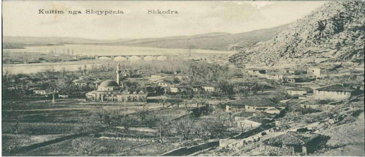
Resim 5: İřkodra řehir merkezinden genel bir görünüm (19. yy) 39