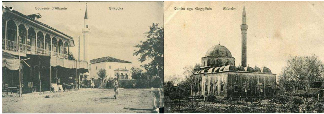
Resim 3: İřkodra'da günlük hayat (19.yy) 37 (19. yy) 38

İřkodra'yı almak hem politik hem de ticari açıdan çok önemliydi. Karadağlılar saldırıya geçtiklerinde, İřkodra'daki Osmanlı birliklerinin başında Albay Hasan Rıza Pařa bulunuyordu. Hasan Rıza Pařa iâşe sıkıntıları ve ordunun merkezle irtibatını kaybetmesine rağmen altı buçuk ay şehri müdafaâ etmiştir. Hasan Rıza Pařa'nın bir suikast sonucu şehit edilmesinin ardından, yerine tayin edilen Esat Pařa, 22-23 Nisan 1913 günü Karadağlılarla yapılan görüşmeler sonunda İřkodra'nın Karadağ'a teslimini kabul etmiştir. 35 İřkodra, Karadağlıların elinde çok uzun süre kalmamış 14 Mayıs 1913'te yeni kurulan Arnavutluk'a teslim edilmiştir. 36 İřkodra 27 Haziran 1915 tarihinde Avusturya-Macaristan, II. Dünya Savaşı'nda da İtalya tarafından işgal edilerek bu devletlerin idaresinde kalmış, 1944-1991 yılları arasında sosyalist idare ile yönetilmiştir. 1992 yılından itibaren ise üniter parlamenter sistemle idare edilmektedir.