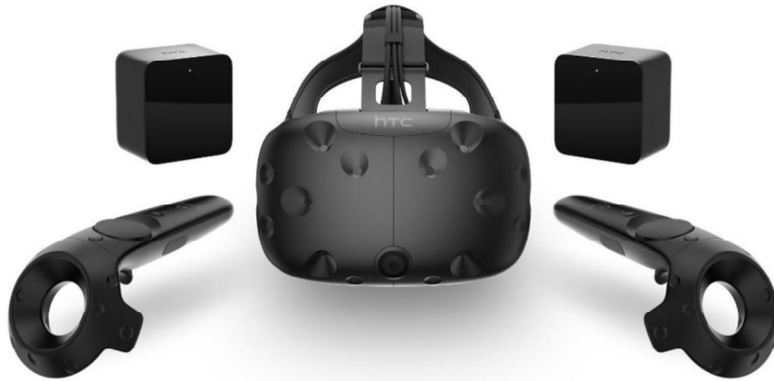
Şekil 2: HTC Vive Sanal Gerçeklik Başlığı ve Aparatları