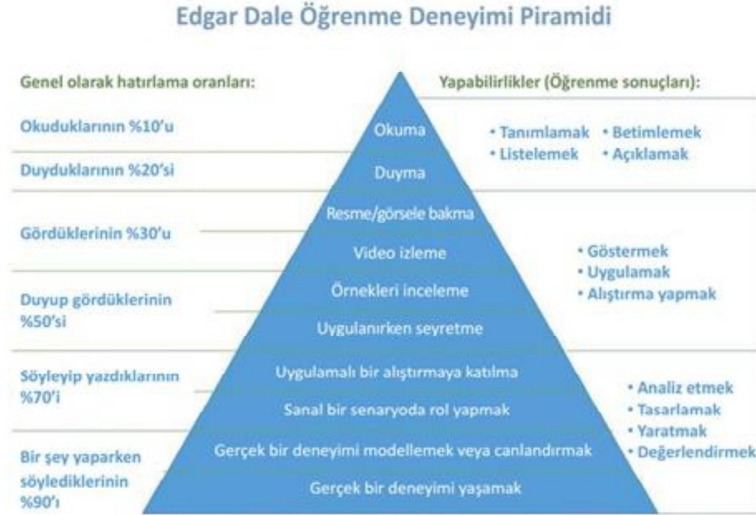
Şekil 4: Edgar Dale Öğrenme Piramidi